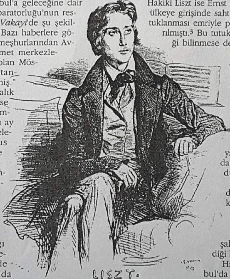
Gençlik yıllarında Liszt, Deveria'nın gravürü, 1832.

mekteydi. Listmann biraz kurnazca davranarak isminin son hecesini düşürmüş ve etrafa kendisini meşhur Liszt olarak tanıtmıştı. Ancak bilemezdi ki imkânsız olan gerçekleşecek ve hakiki Liszt kendisiyle aynı anda, aynı şehirde bulunacaktı. Sahte Liszt bu şekilde birkaç konser vermiş ve hatta padişah'tan dahi değerli bir ödül almayı başarmıştı. Hakiki Liszt ise Ernst Burger'in iddiasına göre, ülkeye girişinde sahtekâr diye suçlanarak tutuklanması emriyle padişahın huzuruna çıkarılmıştı. 3 Bu tutuklanma emrinin gerçekliği bilinmese de, Liszt'in böyle bir sahtekâr ile İstanbul'da karşılaşacağı bir hakikattir.