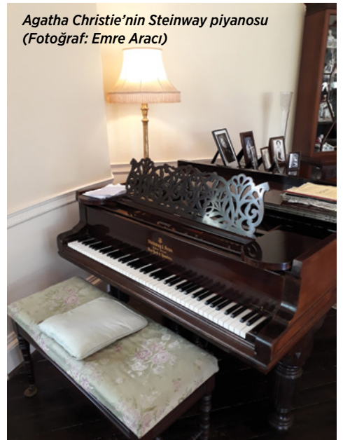
Agatha Christie'nin Steinway piyanosu