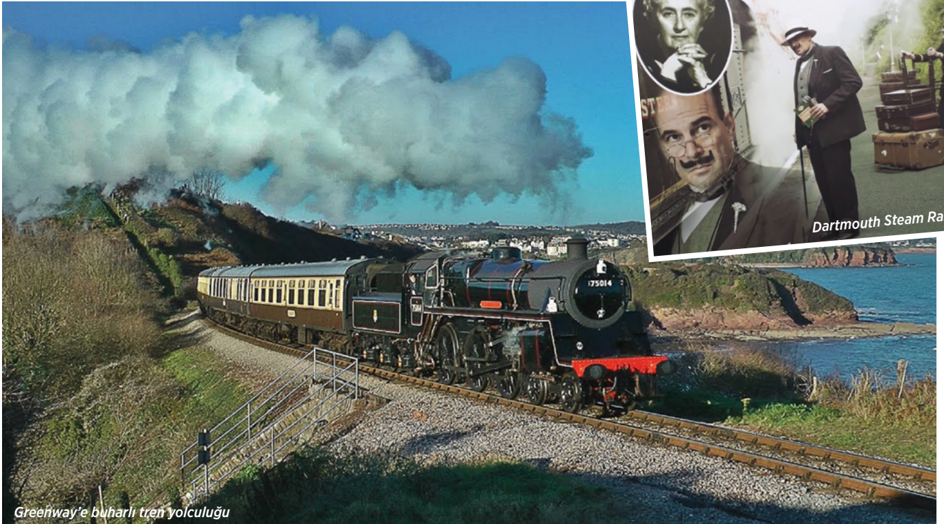
Greenway'e buharlı tren yolculuğu

tarafından 1924'de yayımlanmış olan Through the Window ( Pencereden Bakarken ) kılavuz kitabında yol boyu sağlı sollu tasvir edilen manzaralar ve tarihi binalar, katedraller ve kaleler arasında, eski taş köprülerin altından aheste kanal teknelerinin hâlâ dar su yollarından işlemeye devam ettiği bu coğrafyada geçen 93 sene zarfında, nelerin değişmemiş olduğunu