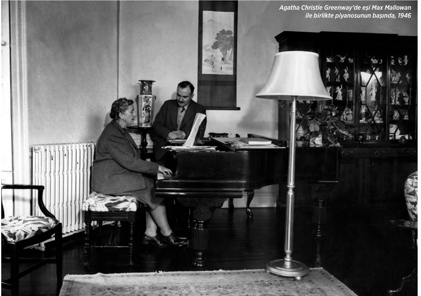
Agatha Christie Greenway'de eşi Max Mallowan ile birlikte piyanosunun başında, 1946