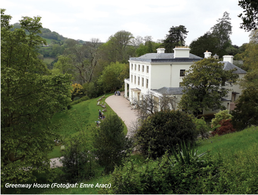
Greenway House