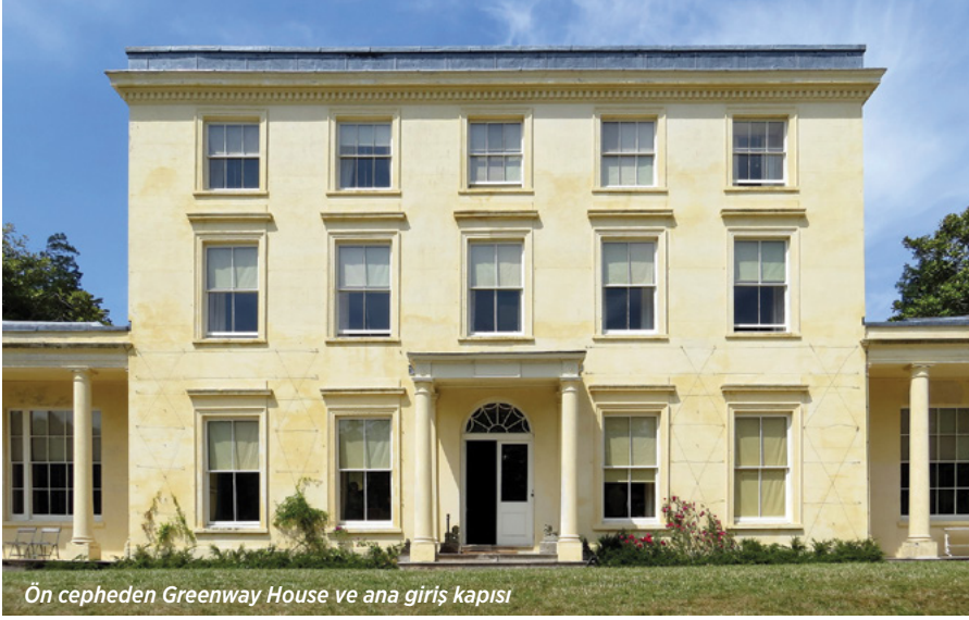
Ön cepheden Greenway House ve ana giriş kapısı