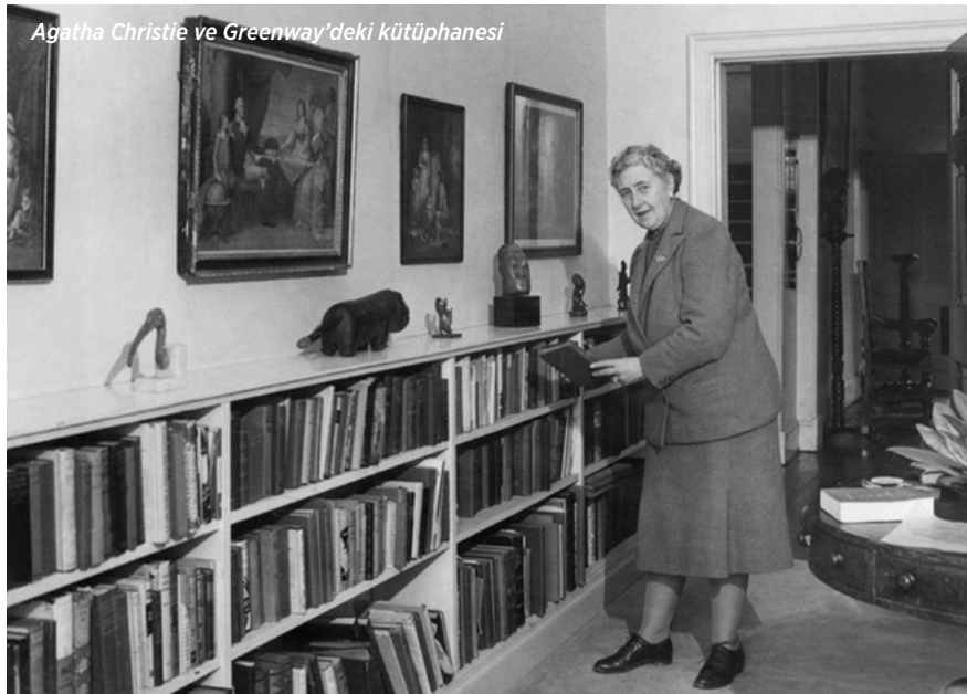
Agatha Christie ve Greenway'deki kütüphanesi