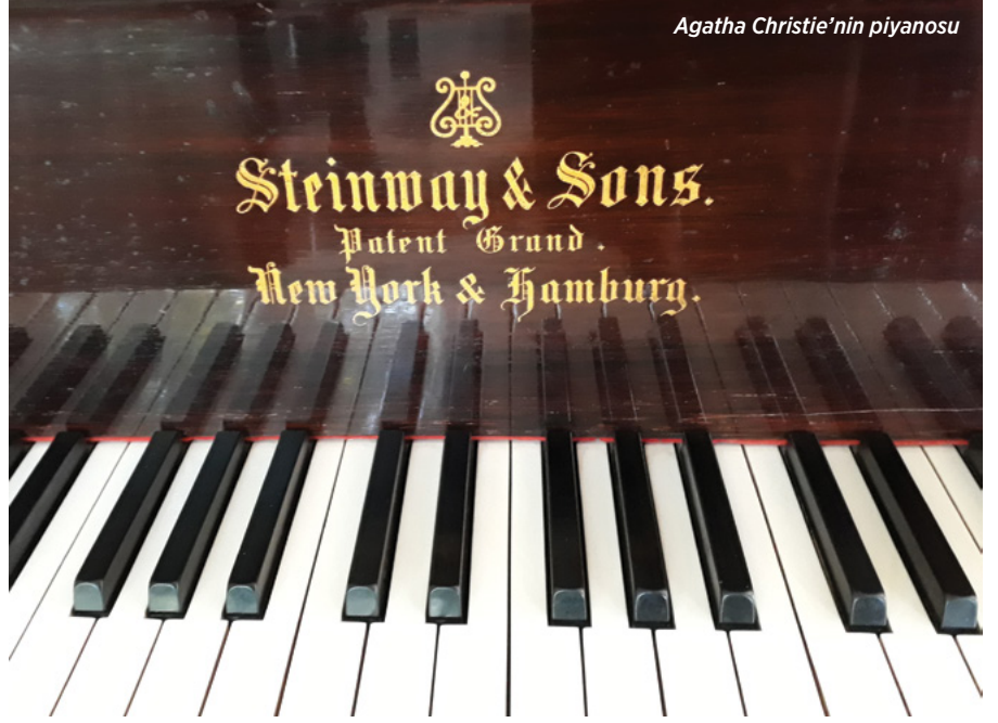
Agatha Christie'nin piyanosu