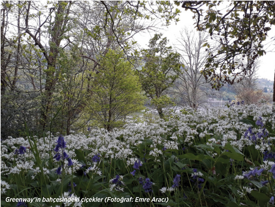
Greenway'in bahçesindeki çiçekler

hızlı ilerleyen bir film şeridine bakarcasına seçmeye çalışıyordum. Ve ne çok yapının, onları saran yeşil alanın, ağaçların ve ormanların esasında hep aynı kalmış olduğuna tanık olmanın huzurunu da bir yandan duyuyordum.