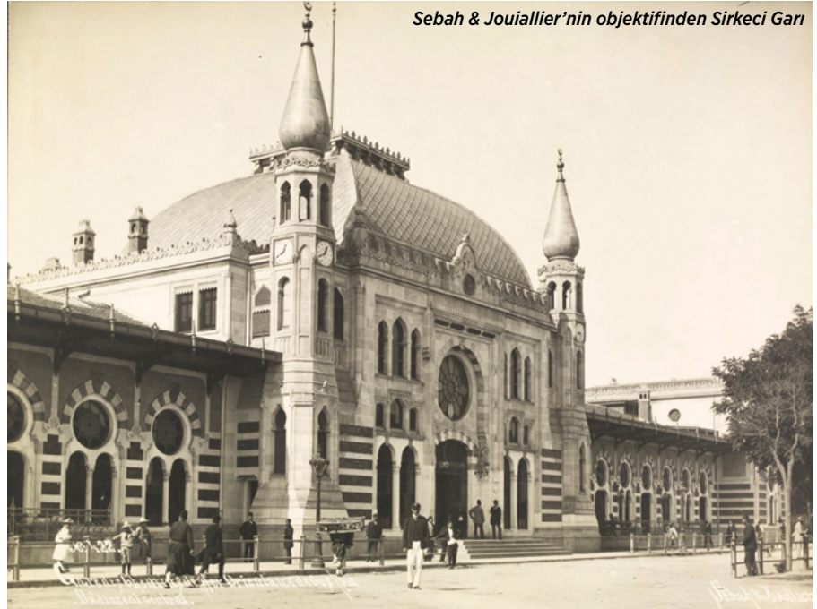
Sebah & Jouiallier'nin objektifinden Sirkeci Garı

bir yangının hafif kırmızılıklarına boyanmış bıraktım. Onun için zifiri bir karanlıkta tren Sirkeci'den ayrılırken sınırlarım iyi değildi" diye söze başladığı gibi. "Gece her çeşit kuruntuların kafatasımızın kovuklarından çıkıp