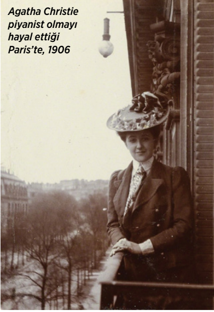
Agatha Christie piyanist olmayı hayal ettiği Paris'te, 1906