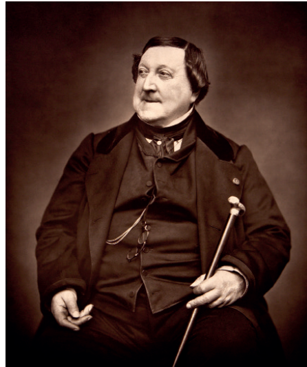
Gioachino Rossini

heyecanlanmıştım, çünkü Rossini bu mektubunu İstanbul'a yollamak üzere Giuseppe Donizetti'ye hitaben kaleme almıştı ve ona şöyle yazıyordu: "Çok Değerli Bay Donizetti, İyi dostum Doktor Anibale Foresti Sultan Hazretleri'nin benim küçük hediyemi küçük görmeyebileceğini söyledi, ben de size güvencemle bir 'Passa Doble' sunmakta sakınca görmedim. Büyük özen ile yönettiğiniz bandonun önemini tam olarak bilmediğimden ve bestelerimden bazılarının öğrencileriniz tarafından yorumlanmasını çok arzuladığım için size bir adet daha 'Passa Doble' gönderiyorum, hangisinin zevkinize ve bando teşkilâtına uygun olduğuna karar verme nezaketini de size bırakıyorum." (Emre Aracı, Donizetti Paşa - Osmanlı Sarayının İtalyan Maestrosu , YKY, 3. Baskı, 2020, s.105). Anlaşılan oydu ki bugün Rossini'nin Sultan Abdülmecid Marşı olarak bilinen ve 'Pasodoble' veya 'Pas redoublé', yani çift adım (dakikada 120 adım) olarak bilinen hızlı tempodaki marşını, eline ulaşan iki seçkiden, Giuseppe Donizetti seçmişti. Townsend'in aranjmanı bir tarafta, ABD Marine Bandosu'nun kaydı diğer yanda ve hepsine ışık tutan Rossini'nin Floran-