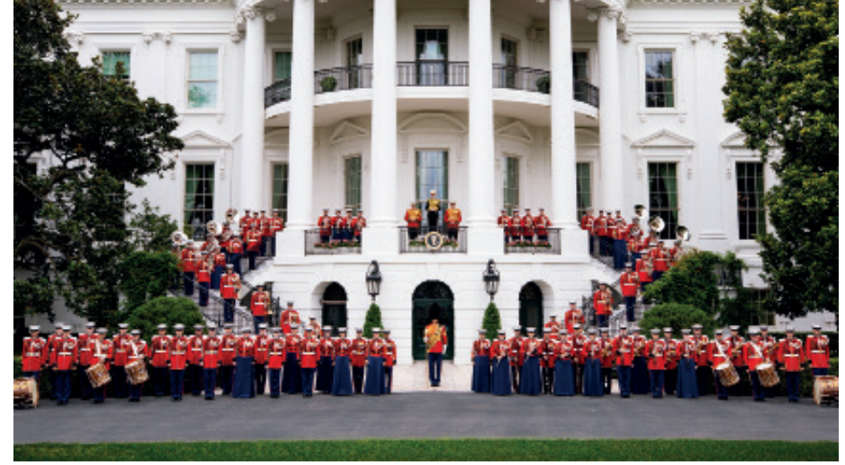
ABD Marine Bandosu Beyaz Saray'da, Washington DC, 8 Haziran 2021

Rossini'nin ülkemizde dahi unutulmuş olan Sultan Abdülmecid için bestelediği bu askeri marş nasıl olmuştu da ABD Marine Bandosu'nun repertuarına girmişti? İşte belki de en çok bu soruya cevap arıyordum. Bunu sağlayan kişi hiç şüphesiz ki 2012'de