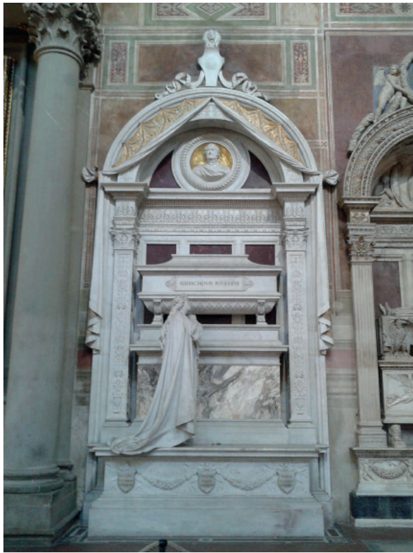
Rossini'nin Floransa'da Santa Croce Kilisesi'ndeki mezarı

ki bunlardan bir tanesi J. Alfred Novello'nun kurduğu İngiliz The Musical World dergisinde basılmıştı: "Söylenenlere göre Rossini'nin sağlığı şu an her zamankinden daha da iyi durumdadır. Büyük Maestro hakkında bize iletilen şu hadise kısa bir zaman önce Floransa'da cereyan etmiştir. Aşırı derecede müziğe meraklı olan Sultan [Abdülmecid], kendisi için lirik bir eser bestelemesi koşulu ile, geçtiğimiz iki sene boyunca Rossini'ye çeşitli defalar farklı farklı Türk madalya ve liyâkat nişanlarının yanı sıra büyük miktarda paralar yollamıştır. Rossini bu isteklerin hiçbirine cevap vermeyince Majesteleri elçiliğinden bir ataşeyi, İstanbul'daki tiyatro için besteciden bir eser almadan geri dönmemesi emriyle, yollamaya karar verdi. Ataşe bu emir üzerine Rossini'yi ziyaret etti. Rossini onu alışıldık nazik tavırları ile kabul ederek, ondan