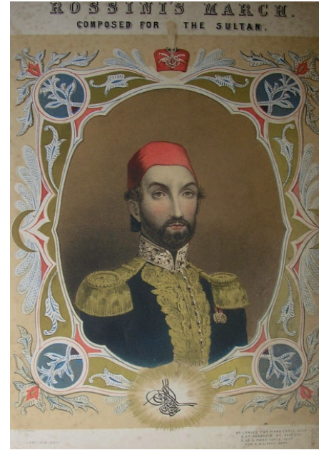
Rossini'nin Sultan Abdülmecid Marşı'nın Londra'da Cramer Beale & Co. Yayınevi tarafından basılan notasının kapağı, (Emre Aracı koleksiyonu)

sa'dan yazdığı orijinal mektubu elimde, kaybolup gitmiş bir bestenin yavaş yavaş ortaya çıkış öyküsüne tanık olmak işte böylesine heyecan vericiydi.