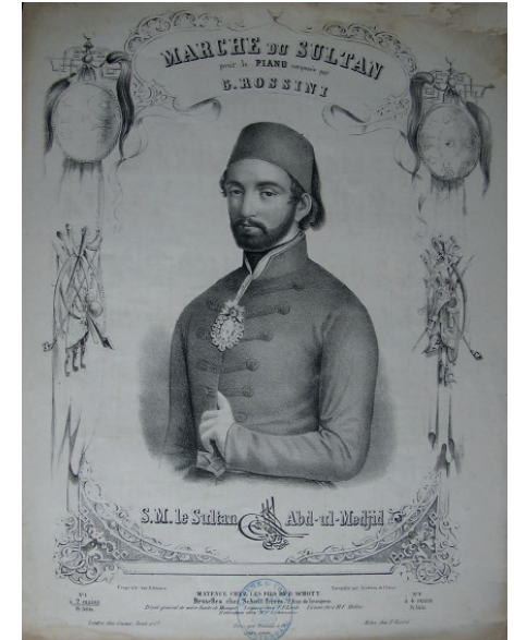
Rossini'nin Sultan Abdülmecid Marşı'nın Brüksel'de Schott Yayınevi tarafından basılan notasının kapağı

Marşın 19. yüzyıl baskıları arasında Schott Yayınevi tarafından Brüksel'de basılan bir kopyası daha bulunmaktadır. Plaketler, anılar, kütüphane raflarında ve özel koleksiyonlarda saklı kalan notalar ve CD kayıtları; bir de bu marş hakkında o devir müzik dergilerinde çıkan dedikodu türünde haberler vardı