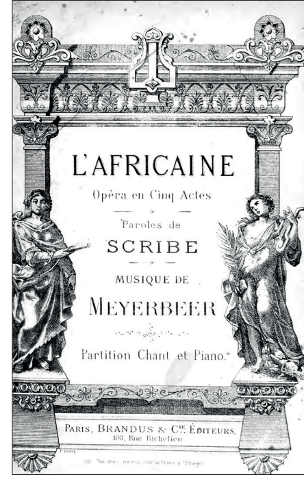
Meyerbeer'in son operası L'Africaine

Seyirciler arasında hiç Müslüman kadının olmayışı da Russell'in dikkatini çekmişti, ancak Suriyeli, Levanten, Rum ve bilhassa Ermeni hanımlar mücevher ve göz alıcı elbiseleriyle pırıl pırıl parlıyorlardı. Giydiği elmas madalya ve nişanlarla bezeli sırma kıyafeti içerisinde son derece ciddi ve heybetli duran Padişah, bir gece öncesinde Birleşik Krallık Büyükelçiliği'nde verilen baloda da olduğu gibi, Prens ve Prenses'in arasına oturmuştu. Sadrazam Âli Paşa ise Padişah'ın koltuğunun tam arkasında ayakta duruyordu. Saltanat locasında Mustafa Fazıl Paşa ve Halil Paşa da yerlerini almışlar, L'Africaine operasının temsili başlamıştı. Sahnede olup bitene dikkat kesilmiş bir hâlde olayları takip eden Sultan Abdülaziz'in yüz ifadesi Russell için başlı başına seyretmeye değer bir olaydı. Ara ara Âli Paşa'dan açıklamalar alıyor, ara ara da misafirleriyle konuşuyordu. Ancak ne yazık ki o akşam büyük bir şevkle seçilen bu operaya kumpanya gerektiği hakkı verememişti. "Karmaşık bir opera ve konusunu anlamak da pek o kadar kolay değil. Sultan için epey şaşırtıcı olmuş olmalıydı, zira zaman zaman Zat-ı Şâhane'nin yüz ifadesini belirsizlik alâmetleri alıyor, tavırlarından da sıklıkla hissediliyordu. Majesteleri sonunda ayrıldı"