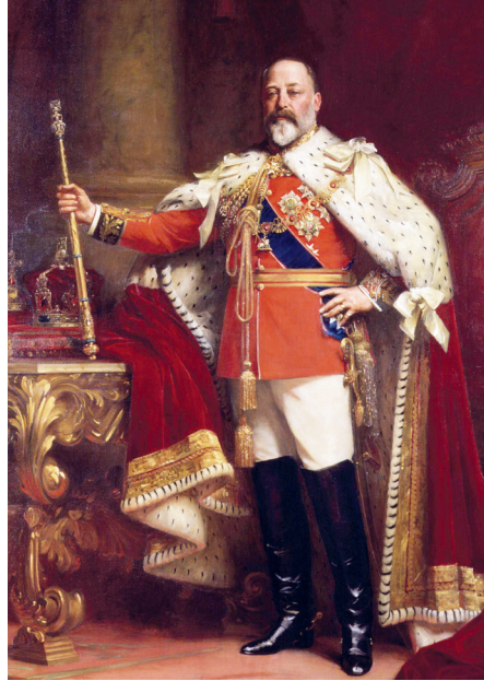
Kral VII. Edward, (Sir Luke Fildes, 1901)