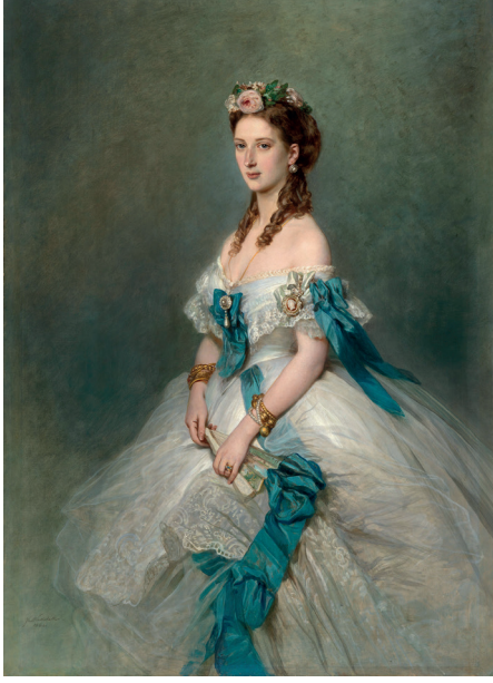
Galler Prensesi Alexandra (Franz Xaver Winterhalter, 1864)

seph-Fétis'in hazırladığı edisyondan ilk defa Paris Operası'nda oynanmış, devrinde son derece popüler olmuş, ancak diğer Meyerbeer operaları gibi zaman içerisinde genel anlamda repertuvardan düşmüştür. 1869 yılının Beyoğlu'nda beş perdeli böyle bir grand operanın sahneye konmuş olması ve o temsili Sultan Abdülaziz'le birlikte istikbâlin İngiltere Kralı VII. Edward'ın izlemiş olduğunu düşünmek her ne kadar bugünün perspektifinden geriye dönüp bakıldığında inanılması bir hayli güç gibi geliyorsa da devrin kitap ve gazetelerinde yazılıp anlatılanlar, renkli tasvirler, bir nebze de olsa, şuurumuzun tiyatro sahnesinde o akşamı canlandırmamızı sağlıyor.