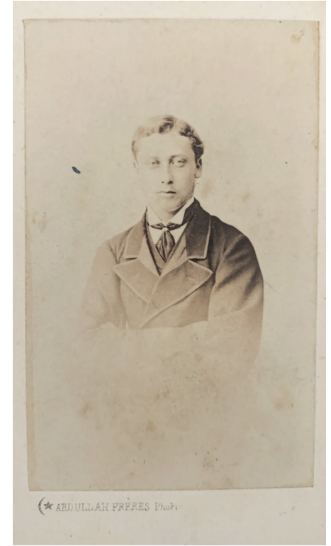
Galler Prensi Edward'ın Abdullah Biraderler Stüdyosu'nda çekilen fotoğrafı, 1862.

Prens Edward, 1869 ilkbaharında İstanbul'a Mısır üzerinden geri dönecekti, ama bu defa ona 1863'te evlendiği Danimarka Prensesi Alexandra da eşlik ediyordu. Galler Prens ve Prensesi'nin 1 Nisan 1869'da İstanbul'a İngiliz savaş gemisi HMS Ariadne ile varışları gazetelerde yayımlanan gravürlerde de belirtilmişti. Prens ve Prenses'in ikameti için ilk başta Beylerbeyi Sarayı düşünülmüşse de Beyoğlu'ndaki Birleşik Krallık Büyükelçiliği'nin binası Pera House'a olan yakınlığından dolayı, Salı Pazarı Sarayları olarak da bilinen Fındıklı'daki Cemile Sultan ve Münire Sultan Çifte Sarayları'nda kalmaları daha uygun görüldü. Bu aynı zamanda turistik bir ziyaret; zira İstanbul'da Galler Prens ve Prensesi -Mr. and Mrs. Williams adı altında- Çamlıca tepelerinden Ayasofya ve Topkapı Sarayı'na kadar bütün şehri gezerek Kapalı Çarşı'da alışveriş dahi yapmışlardı. Sultan Abdülaziz 1867 yazında İngiltere'yi ziyaret ettiğinde Galler Prensi, Padişah'ı Londra'daki resmi ikametgâhı olan Marlborough House'ta bir öğlen yemeğinde ağırlamış ve Covent Garden Operası'nda onuruna verilen Auber'in Masaniello temsilinde hazır bulunmuştu. Belki de bu davete karşılık olarak Galler Prens ve Prensesi'nin İstanbul'da da bir opera temsi-