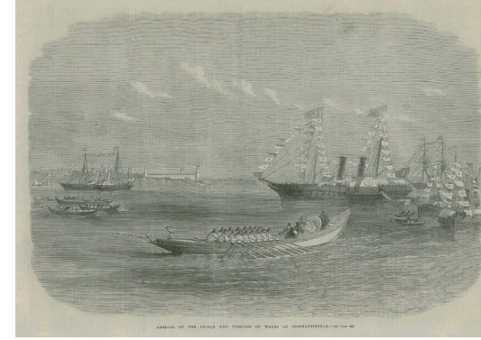
Galler Prens ve Prensesi'nin İstanbul'a varışları, (The Illustrated London News, 21 Nisan 1869)

Esasında 7 Nisan akşamı gerçekleşen gala Prens ve Prenses'in Naum Tiyatrosu'na ilk gi-dişleri değildi. Edward ve Alexandra, belki de meraktan olsa gerek, tiyatrodan 2 Nisan akşamı yapılan Le Prophète temsiline de gizli olarak katılmış ve operayı Sultan Abdülaziz'in loca-