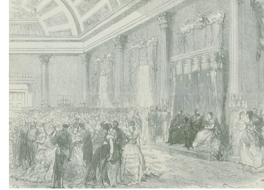
Birleşik Krallık Büyükelçiliği'nde verilen baloda Sultan Abdülaziz, Galler Prens ve Prensesi'nin arasında (The Illustrated London News, 21 Nisan 1869)

sından izlemişlerdi. Theresa Grey bu temsili de "epey kötü" olarak değerlendirmişti. Prenses Alexandra sarayda kalmayı tercih ederken Prens Edward 5 Nisan'daki Martha temsiline de yine sivil kıyafetleri içerisinde katılmıştı. Görülen oydu ki istikbâlin İngiltere Kralı, İstanbul'da bulunduğu bir hafta içerisinde tam üç defa Naum Tiyatrosu'nun kapısından içeri girmişti. Prens ve Prenses İstanbul'dan ayrılmadan önce, 19 Nisan 1869 tarihli La Turquie gazetesinin bildirdiğine göre tiyatro sahibi Joseph Naum'a 400 frank değerinde bir iğne hediye etmiş, Naum, Prenses'e bir buket çiçek yollamış ve karşılığında Prenses Alexandra da ona bir fotoğrafını hediye etmişti. Şimdi kim