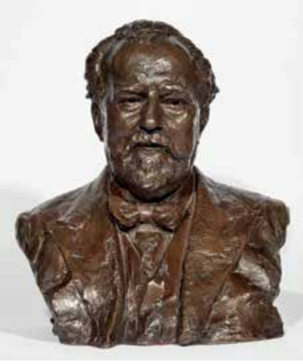
Sir Henry Wood'un bronz büstü (Kraliyet Müzik Akademisi)

de Sir Henry Wood'un idaresindeki Londra Senfoni Orkestrası'nın müzisyenleri Beethoven çalmaya devam ediyorlar. İlk yarıda 2. Leonore Uvertürü'nü Prometheus Uvertürü, piyanist Benno Moiseiwitsch'in solistliğinde İmparator Piyano Konçertosu'nu ise 4. Senfoni takip ediyor. Programın en altında ise insanı hayrete düşürdüğü gibi bir hayli düşündürülen bir not var; bu notta hava saldırısı sirenleri duyulduğu anda dinleyicilerin derhal salonu terk ederek belirtilen sığınaklara doğru yönelmeleri gerektiğinin uyarısı yapılıyor.