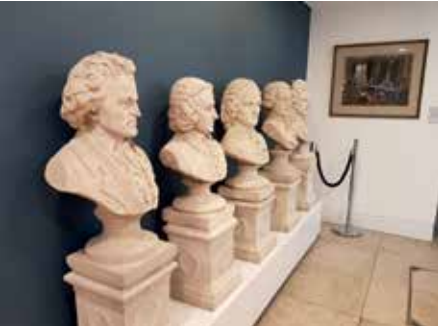
Queen's Hall'un cephesinden geriye kalan büstler

insanoğlunun bir türlü almadığı dersler yüzünden o bodrum katındaki steril koridora mahkûm edilmiş bir hâlde, şimdi önlerinden gelip geçenleri umursamaz bir edayla âdeta bir boşluğa bakarcasına bakıyorlardı. Haksız da sayılmazlardı; zira akademinin tarihi kon-