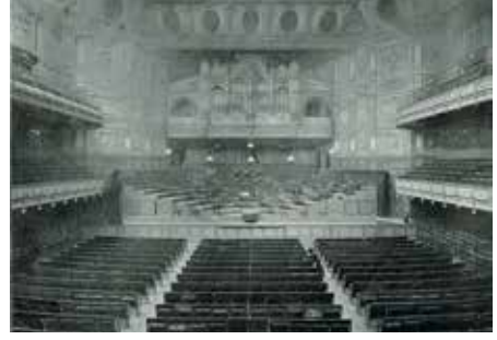
Queen's Hall'un içi

geçışı esnasına terk eden Helen Schlegel ile onu takip eden Leonard Bast'ın tesadüfi tanışmalarını da gözümün önüne getirmişti. Scherzo'da da duyulan o kader teması filmde piyano redüksiyonuyla ilk olarak duyulurken giderek orkestra devreye girer ve Londra'nın yağmuru içinde kalabalığa karışan Helen Schlegel, Beethoven'ın romantik bir kahramanı gibi hayallerine doğru gözden kaybolur. Bir konserde böylesine olası tesadüfi bir tanışma bazen gerçek hayatta da kader değiştirecek nitelikte olabilir ve o gün eseri seslendirilen besteci Beethoven ya da Chopin olsun, müziği artık o ilişkinin de bir tür teması haline dönüşmüştür. Forster da bunun gayet açık bir şekilde farkındaydı ki Proust'tan bahsederken Vinteuil'ün sonatının Fransız yazarın anıtsal romanında tematik bağları nasıl kuvvetlendirdiğini dile getirmiş, Virginia Woolf'un Deniz Feneri 'ni ise "sonat yapısındaki bir roman" olarak tanımlamıştı. (Andrea K Weatherhead, 'Howards End: Beethoven's Fifth', Twentieth Century Literature , Duke University Press, Yaz - Sonbahar 1985, s.252)