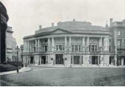
25 Kasım 1893'te açılan Queen's Hall'un besteci büstleriyle bezeli cephesi