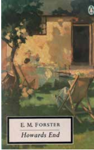
E. M. Forster'in Howards End romanı

Forster için bilhassa önemliydi; zira Aspects of the Novel adlı edebiyat kavramına dair incelemesinde şöyle yazmıştı: "Müzik, insan karakterleri kullanmasa ve karmaşık yasalara sahip olsa da yine de nihai ifadesinde, kurgunun kendi yöntemiyle elde edebileceği bir güzellik türü sunar. Genişleme. Romancının tutunması gereken fikir budur. Tamamlanma değil. Sonlandırma da değil, ama dışı açılma. Senfoni bittiğinde, onu oluşturan notaların ve ezgilerin özgürleştiğini hissederiz, bir bütünün ritiminde kendi bireysel özgürlüklerini bulmuşlardır." (agm, s.250) Romanda Helen'in duyduğu "panik ve boşluk" hissi de bu şekilde bu senfoniyle bir tür yanıt bulmuştur; senfoni bittiğinde sona değil, bilakis o duyulan hisler yeni bir ufka, hürriyete işaret eder. Tıpkı minör tonunda başlayan senfonisini majör tonunda bitiren Beethoven'ın "Pek