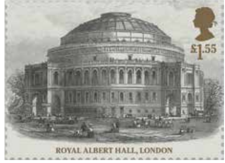
Kraliçe Viktorya'nın doğumunun 200. yılında basılan Royal Albert Hall hatıra pulu

Görüldüğü gibi, bu büyük riske rağmen Promenad konserleri Londra'da savaş yıllarında dahi devam etmiş. Ta ki dünya Covid-19 ile tanışmaya kadar; zira tesis edilmesinden 125 yıl sonra Promenad konserlerinin iptal edilmeyen son iki haftası ilk defa bu yıl dinleyici katılımı olmadan boş bir salonda düzenlendi. Bu sürreal manzara içerisinde Royal Albert Hall'daki spotların aydınlatıldığı Sir Henry Wood'un bronz büstü yine de her sene olduğu gibi Kraliyet Müzik Akademisi'nden getirilerek sahnedeki yerini aldı. Wood'a 1938'deki 70. yaş gününde hediye edilen büst Queen's Hall bombardı-