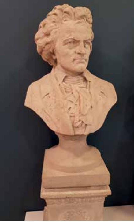
Queen's Hall'un cephesindeki Beethoven büstü