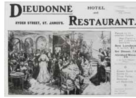
Dieudonné Otel'i'nin eski bir ilanı