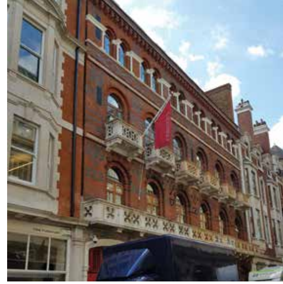
Ryder Street'te bir zamanlar Dieudonné Oteli'nin bulunduğu bina