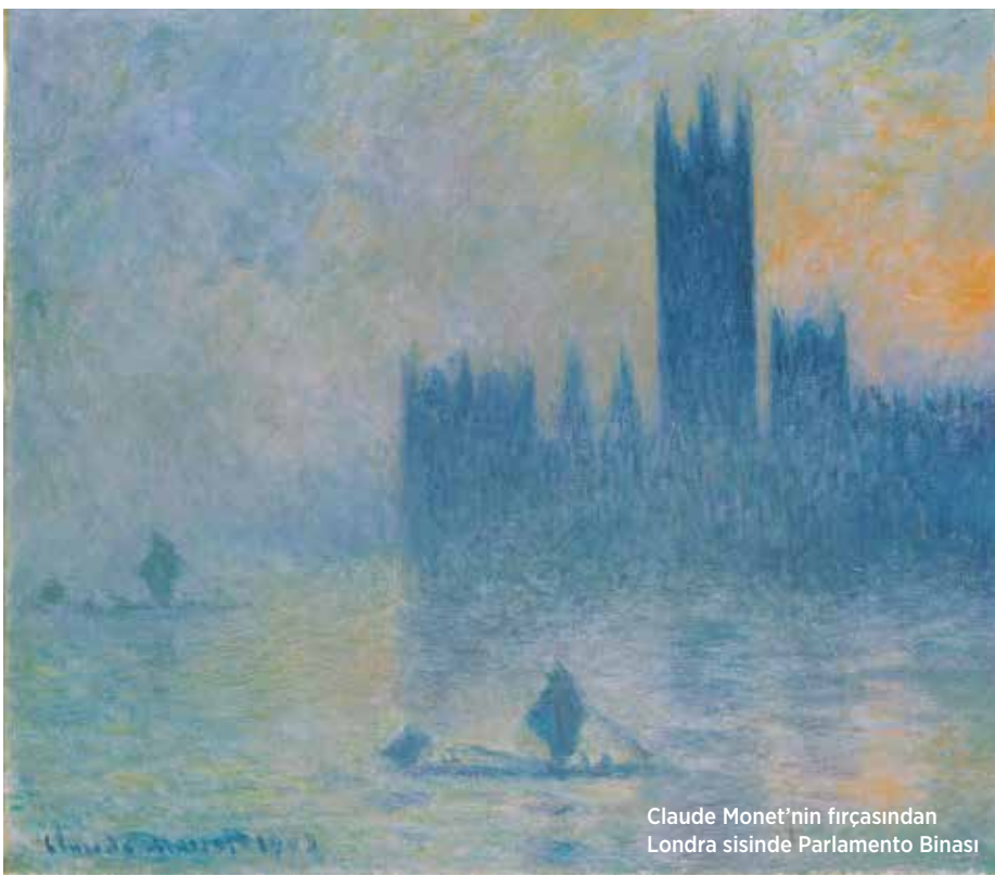
Claude Monet'nin fırçasından Londra sisinde Parlamento Binası

konser idare etmiş, Franz Liszt 1886'da dinleyicileriyle buluşmuş, Saint- Saëns 3. Senfoni'sinin prömiyerinde şef olarak yer almış, Clara Schumann Londra'ya veda konserini vermiş, Dvorak 4. Senfoni'sini yönetmiş ve Grieg La Minör Piyano Konçertosu'nda solist olarak yer almıştı. Ayrıca Hans Richter burada düzenli olarak Wagner konserleri verir, Çaykovski'nin de en sevdiği yazarlar arasında bulunan Charles Dickens kitaplarından okumalar yapardı. Ancak 1893'te açılan Queen's Hall'un yıldızı parlamaya başlayınca 1902'de Chappell & Co. bu yeni salonun idaresini devralmış ve St James's Salonu gözden çıkmıştı. Nitekim üç sene sonrasında da o kadar meşhur bestecinin kapısından girip çıktığı, artık kâr getirmeyen salon, yerine otel inşa edilmek üzere yıkılarak tarih olacaktı.