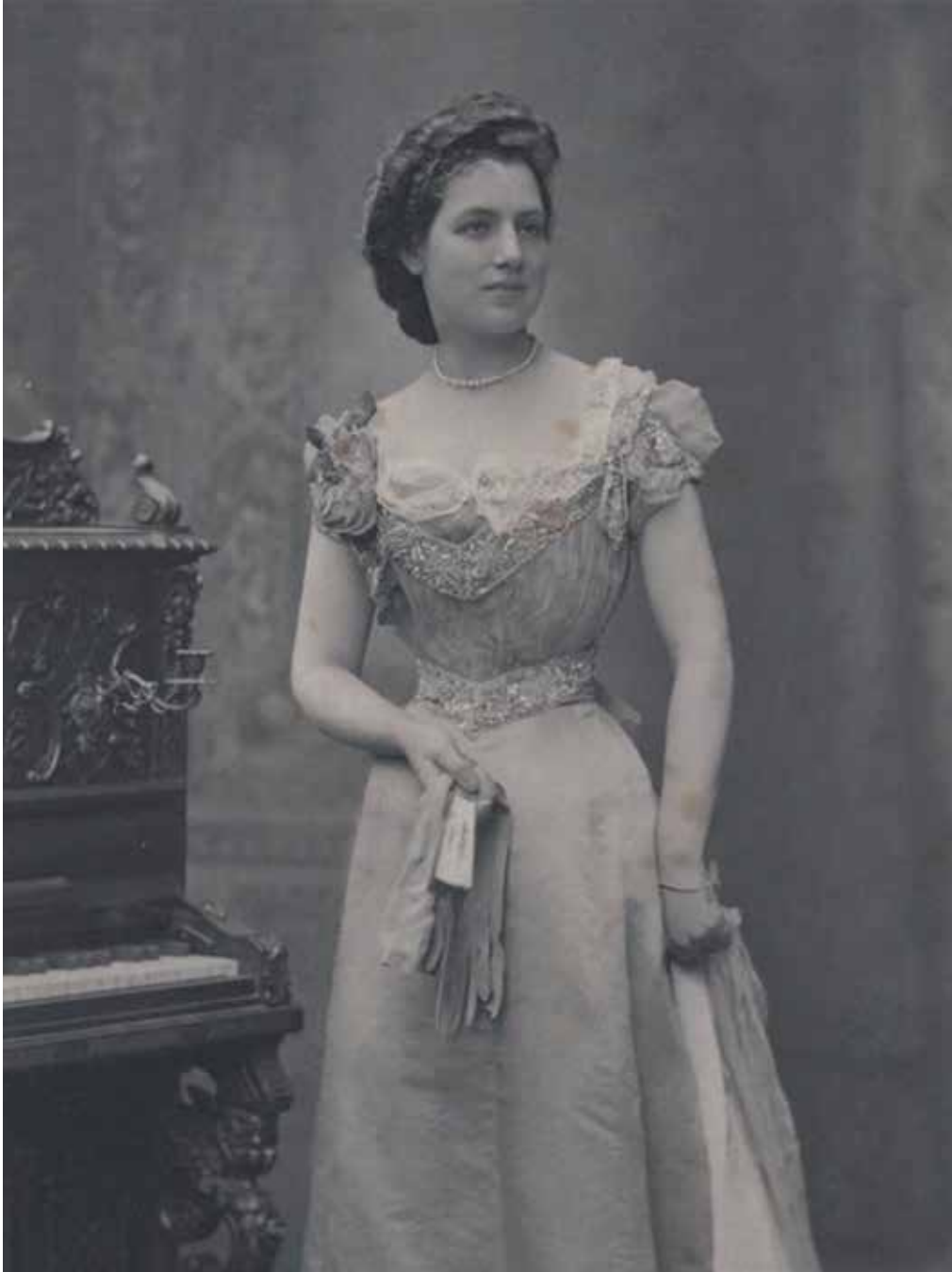
Dük Caddesi Düşesi'ne ilham veren Cavendish Otel'i'nin sahibi Rosa Lewis