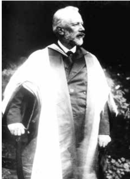
Çaykovski 1893'te Cambridge Üniversitesi'nden aldığı fahri doktora ünvanının cübbesiyle

yılında babasının arkadaşı Vasily Pisarev'e tercümanlık yapmak üzere turist olarak geldi. 21 yaşındaki genç Çaykovski o yıllar bestecilik kariyerine bile henüz atılmamıştı. 8 Ağustos'ta şehre varmışlar ve beş gün boyunca Westminster Abbey, Parlamento Binası ve Chelsea'deki