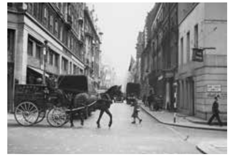
Eski bir fotoğrafta Cavendish Otel'i'nin bulunduğu Jermyn Street ve Duke Street

"Karanlıkta ve yağmurda yürüdüm" diye yazmıştı. Ama neşesi pek yoktu; orkestradaki müzisyenleri hem provada hem konser günü, soğuk bulmuştu. Konser yine de çok başarılıydı. Ve ertesi günü Çaykovski, Sapelnikov'u Londra'da bırakarak şehirden ayrıldı. Bu defa Dover ve Calais üzerinden Marsilya'ya ulaşarak 13 Nisan'da Messageries Maritimes Şirketi'nin Cambodge gemisi ile Batum'a doğru dönüş yolculuğuna geçti ve hatta Çaykovski İstanbul'da kitabımda da detaylıca anlattığım gibi rotası onu önce İzmir'e ve ardından da ikinci kez olarak İstanbul'a getirdi.