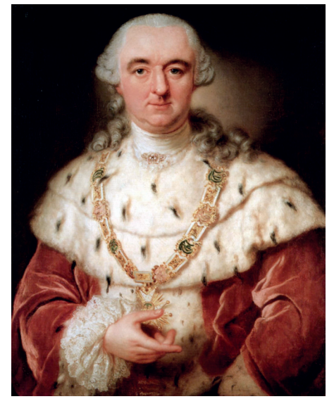
Prens Elektör Karl Theodor, (Anna Dorothea Therbusch, 1763)