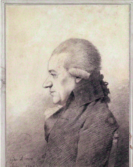
Dr Charles Burney, (George Dance, 1794, Milli Portre Galerisi, Londra)

orkestrada olduğundan daha fazla solo çalgıcı ve iyi besteci bulunmaktadır. Bu topluluk bir savaşı planlamak kadar onu savaşmak için