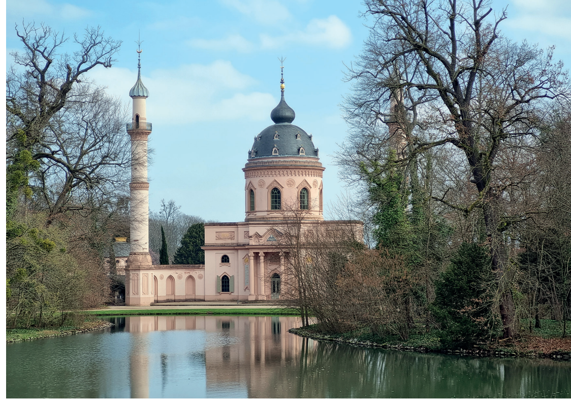
Schwetzingen Saraybahçe Camii, (fotoğraf Emre Aracı)

Fransız mimar Nicolas de Pigage'ın (1723-1796) planlarını çizdiği Schwetzingen Saray Tiyatrosu'nun içini belki görememiştim, ama aynı mimarın tezgâhında planları çizilmiş, daha önce eşi veya benzerini hiç görmemiş olduğum, 18. yüzyıldan kalma bir başka yapı beni o gün Schwetzingen'in bahçesinde ağaç dallarının arasında beliren çifte minareleriyle karşılamıştı. Elimde tuttuğum Türkçe kılavuz kitabında yazılı olduğu üzere burası "Schwetzingen Saraybahçe Camii" idi ve inşaat çalışmalarına müzik, sanat ve edebiyatın sarayından hiç eksik olmadığı Karl Theodor'un 1774 tarihli emriyle başlanmış, inşaatı 1779'dan 1795'e kadar sürmüştü. Kılavuz kitapçığım belirttiği üzere, Egzotik "Turquerie" modasının etkisiyle ve ibadet amacı güdülmeden tasarlanan "Schwetzingen Camii Avrupa'da 18.