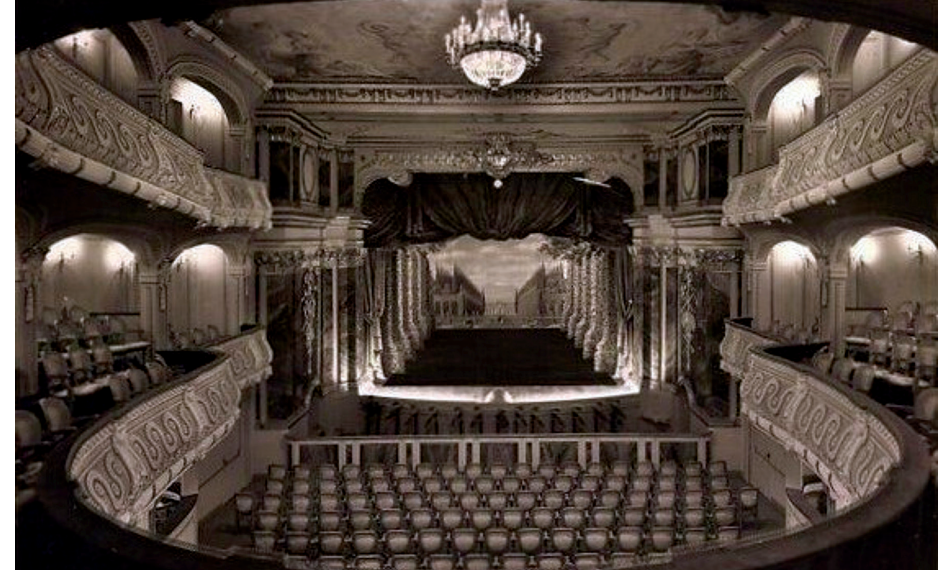
Bugün de temsillerin devam ettiği Schwetzingen Sarayı’nın Rokoko Tiyatrosu

de eşit derecede uygun olan bir tür generaller ordusudur” yazmıştı. Ayrıca Burney’nin günlüğünün satırlarında da belirttiği gibi Mannheim ve Schwetzingen “Stamitz’in dâhi dehasının ilk kez keşfiyle” performans kalitesine duygusallık ve dramatizm kazandıran “Crescendo” ve “Diminuendo” gibi dinamik efektlerin doğduğu yerlerdi. Burney bu olguyu şiirsel bir dille anlatırken, daha önceleri sadece yankı efekti gibi kullanılan “Forte” ve “Piano”nun “resim sanatındaki kırmızı veya mavi tonlar gibi müzikal renkler olduğu da keşfedildi” diye yazacaktı. Henüz ilkbaharın rengârenk tonlarının patlamadığı, kuru ağaçların yapraklara bürünmediği, değişen mevsimin müjdecisi olan beyaz ve sarı nergislerin uzaktan yaklaşan bir orkestranın habercisi havasında yalın başlarını salladıkları bu dev bahçede bir zamanlar Burney’nin de yürümüş olduğunu düşünmek bir müzik tarihçisi için elbette keşfe doyum olmayan bir heyecan idi. Schwetzingen’deki Fransız, İtalyan ve İngiliz karışımı bahçede elinde tuttuğu liriyle sütunlu tapınağının içinden yaklaşan ilkbaharı sabırsızlıkla bekleyen Apollo’yu sıcak bir Ağustos günü Burney