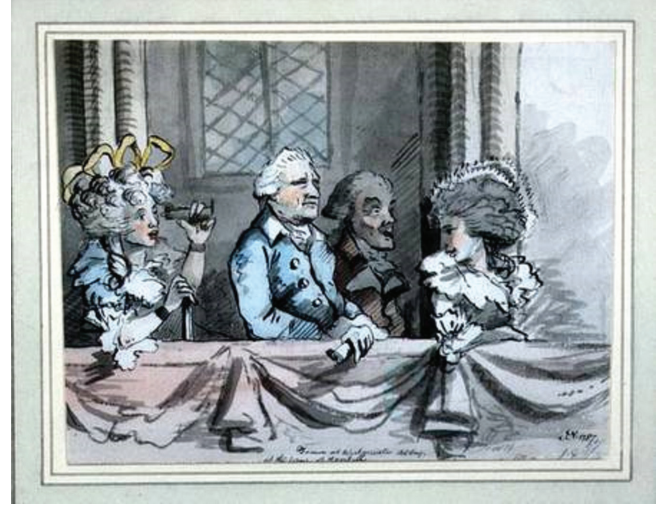
Handel Festivali'nde Kral III. George'u gösteren bir karikatür

taç giyme merasimi için bestelediği Zadok the Priest antemi o günden bu yana o manastırda gerçekleştirilen her taç giyme merasiminde milli bir marş gibi yer alır. Ancak Handel anısına düzenlenen ve Mesih Oratoryosu 'nun dev bir koro ve orkestra tarafından festivalin üçüncü gününde, kurulan kat kat tribünlere yerleşen binlerce kişinin huzurunda seslendirildiği bu konser dizisiyle bu festival daha önce Britanya topraklarında hiç gerçekleştirilmemiş boyutta bir etkinlik olarak da tarihe geçmiş ve bestecisini de milli bir kompozitör olarak şuurlara kazımıştır. Bu büyük çaptaki Mesih Oratoryosu konserleri, Hyde Park'ta inşa edilen Crystal Palace 1854'te Sydenham'a taşındıktan sonra burada da sürdürülecek ve hatta Sultan Abdülaziz 1867'de Londra'yı ziyaret ettiği zaman Luigi Arditi'nin bestelediği ve 1600 kişilik İngiliz korosunun Türkçe dilinde söylediği Inno Turco adlı Türk Kasidesi'nin o boyutlarda seslendirilmesine bile ilham kaynağı olacaktı.