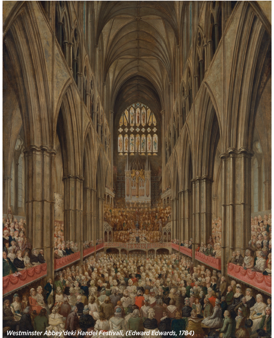
Westminster Abbey'deki Handel Festivali, (Edward Edwards, 1784)