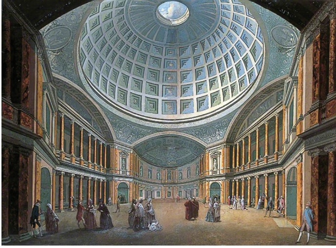
Oxford Street'teki Pantheon, (William Hodges ve William Pars)