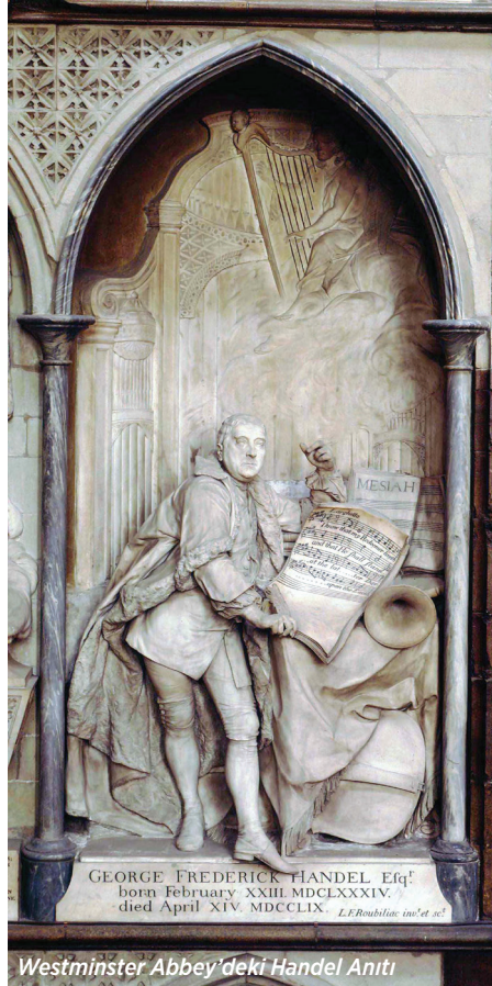
Westminster Abbey'deki Handel Anıtı

A dnan Saygun, Londra'da Westminster Abbey'i ziyaret ettiği 25 Ekim 1946 günü anı defterine yukarıdaki satırları yazmıştı. Normandiya Kralı William'ın İngiltere'yi fethinin ardından, 1066'dan beri İngiliz ve sonrasında da Büyük Britanya kral ve kraliçelerinin taç giydiği, pek çok görkemli kraliyet nikah törenine ev sahipliği yapan Westminster Abbey, aynı zamanda hükümdarların yanı sıra, aralarında şair, yazar, devlet adamı ve müzisyenlerin de gömülü olduğu bir tür milli mozoleler esasında. Dolayısıyla, geçmişi 1000 yılı aşan bu tarihi manastır Britanya'nın dini olduğu kadar politik ve kültürel belleğidir de aynı zamanda. Buranın gotik duvarları arasında geçirecek olan saatler ziyaretçiyi bir büyük insanın huzurundan bir diğerine taşır; Saygun da Londra'ya ilk olarak geldiğinde ziyaret ettiği bu manastırda kiminin adları sade bir şekilde yerde taşa yazılı olan ve tarih kitaplarından tanıdık bu isimlerin huzurunda, hele ki bir de müzisyen olunca, haklı olarak büyük bir heyecana kapılmıştır. Henry