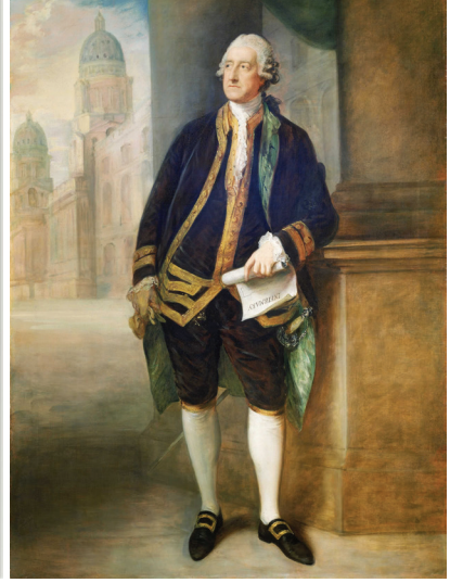
4. Sandwich Kontu John Montagu, (Thomas Gainsborough, 1783)