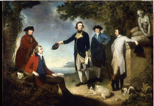
Kaptan James Cook (ortada) ve Lord Sandwich (sağda), (John Hamilton Mortimer)