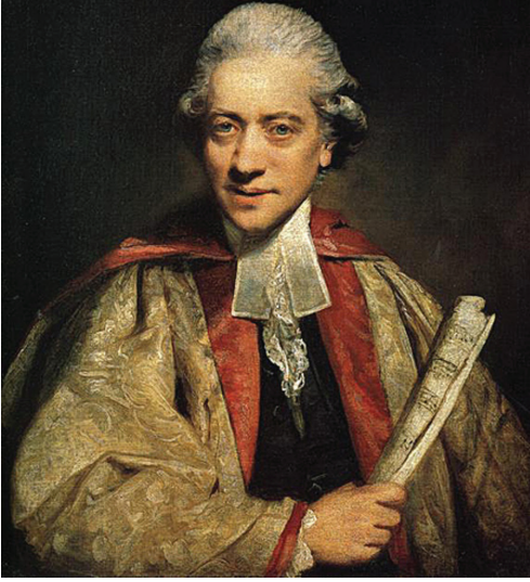
Dr Charles Burney'nin Handel Festivali hakkındaki kitabı

AN A C C O U N T OF THE MUSICAL PERFORMANCES IN WESTMINSTER-ABBEY, AND THE PANTHEON, May 26th, 27th, 29th; and June the 3d, and 5th, 1784. IN COMMEMORATION OF H A N D E L. By CHARLES BURNEY, Mus. D. F. R. S.