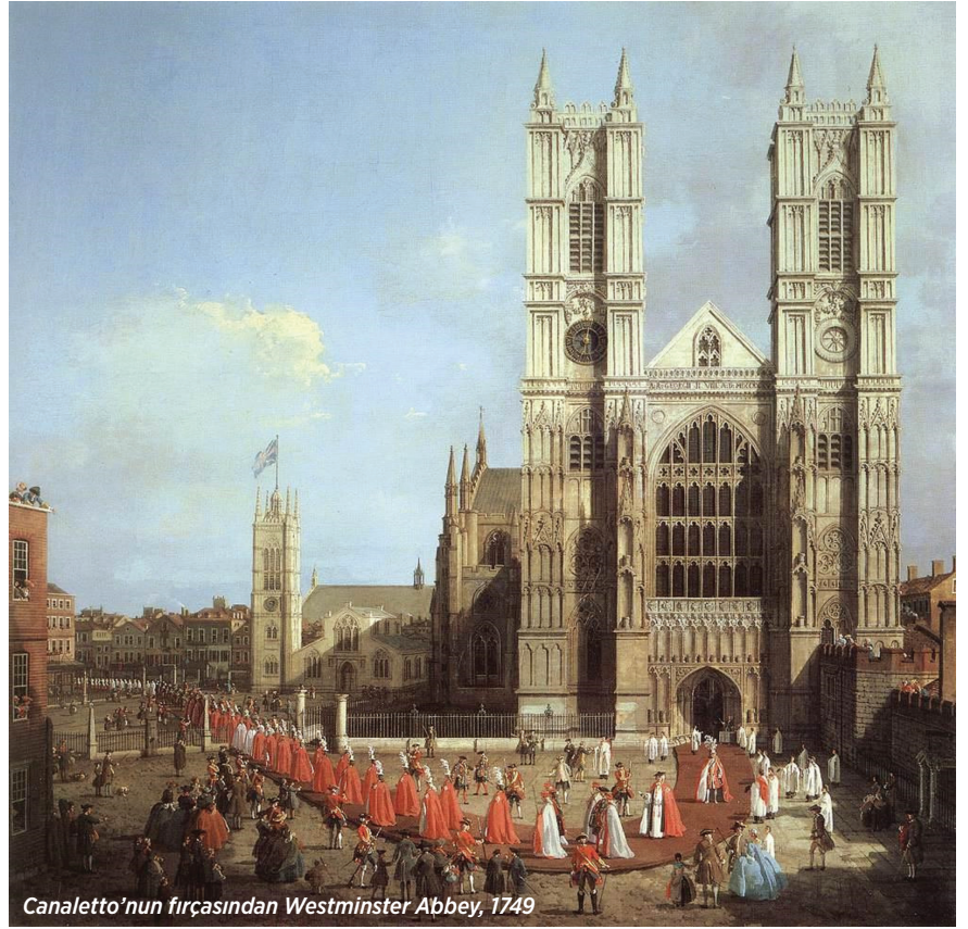
Canaletto'nun fırçasından Westminster Abbey, 1749