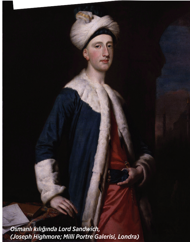
Osmanlı kıyafetinde Lord Sandwich, (Joseph Highmore; Milli Portre Galerisi, Londra)

Lord Sandwich'in Osmanlı kültürüne olan bu ilgisi Londra'ya dönüşünde de devam etmiş ve üyeliği sadece Türk topraklarına seyahat etmiş asilzadelere açık olan The Divan Club adında bir Türk Kulübü'nü 1744'te Londra'da kurmayı başarmıştı.