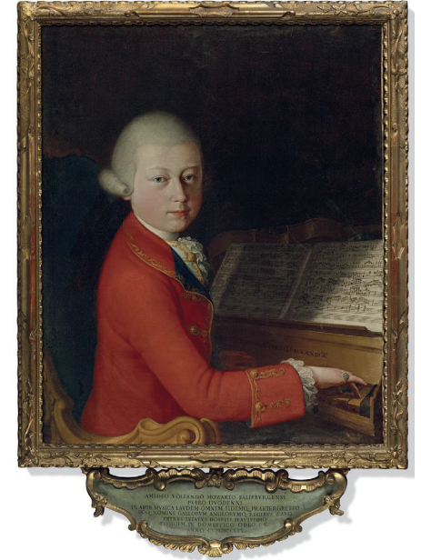
Uzun yıllar Cortot'nun koleksiyonunda bulunan Mozart portresi