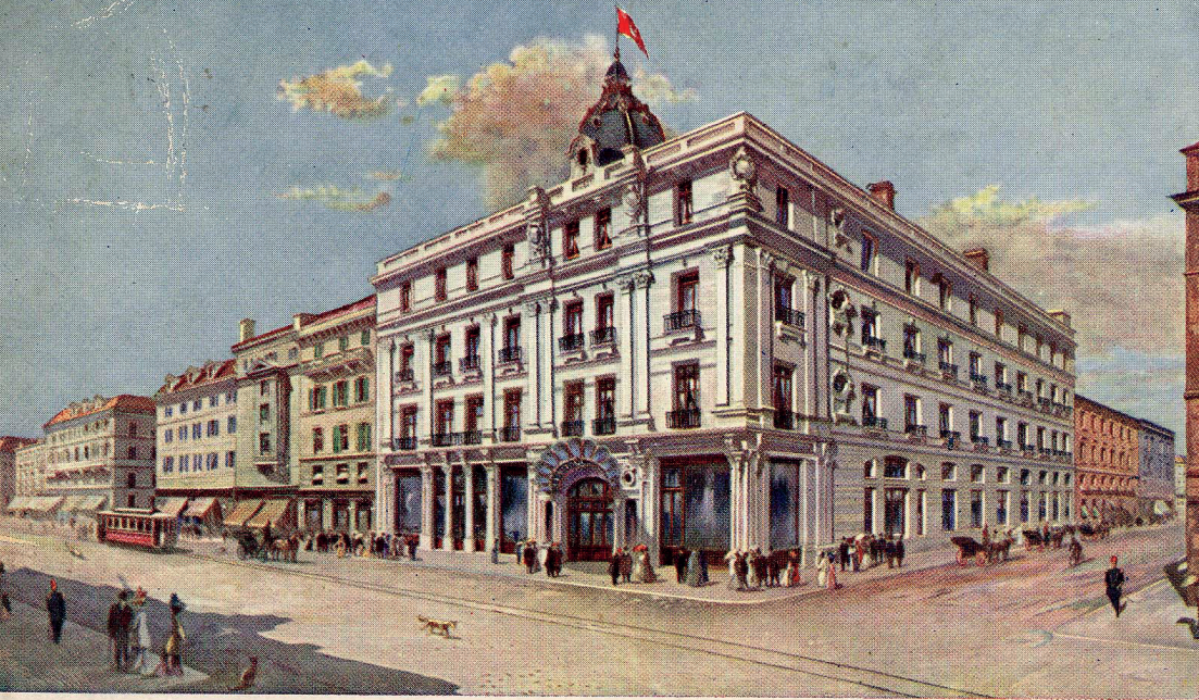
HOTEL RESTAURANT „MEGUERDITCH TOKATLIAN“