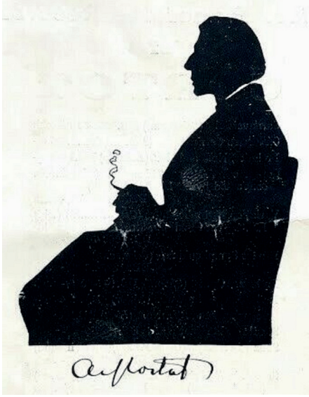
Silüeti Chopin'e benzeyen Alfred Cortot

Paris Konservatuarı'nda Chopin'in son öğrencilerinden Émile Decombes ve Louis Diémer'le çalışmış, Wagner'in müziğine olan tutkusuyla 1898-1901 yılları arasında Bayreuth Festivali'nde yardımcı şef olarak görev yapmıştı. Nitekim Götterdämmerung operasının 1902'deki Paris prömiyerini idare eden de Cortot olacaktı. 1905'te kemancı Jacques Thibaud ve çellist Pablo Casals'la birlikte bir trio kurdular. Birkaç yıl sonra Paris Konservatuarı'nda dersler vermeye başladı. 1919'da ise bizden de yıllar içerisinde pek çok müzisyenin yetiştiği Paris'teki École Normale de Musique adlı okulu kurdu. Cortot'nun solistlik kariyeri iki dünya savaşı arasındaki yıllarda zirveye çıktı. Dünyada gitmediği ülke neredeyse yok gibiydi ve bu kapsamlı turnelerde defalarca Türkiye'ye de geldi.