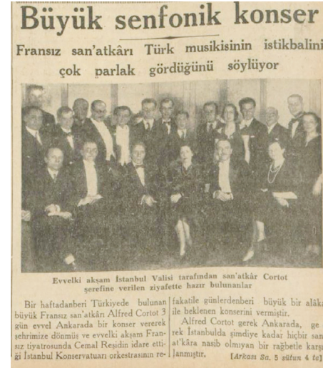
Cumhuriyet, 24 Nisan 1938