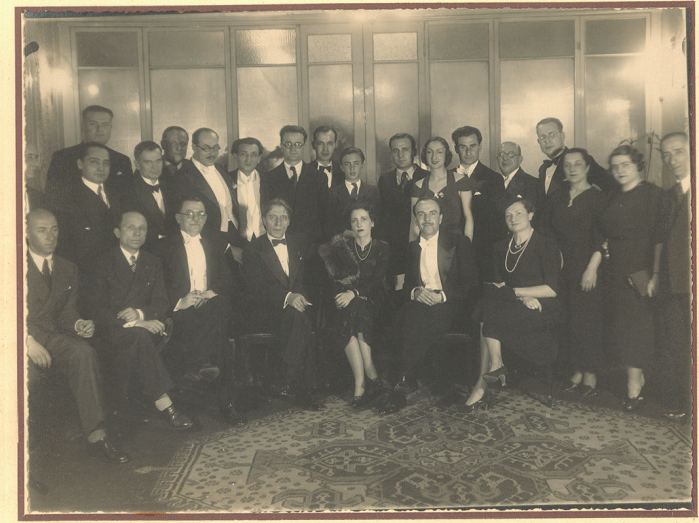
à Mademoiselle Rana Sadri - en souvenir bien sympathique Alfred Cortot 1938

Nisan 1938 tarihli Cumhuriyet gazetesinde Nadir Nadi bu konser hakkında da uzun bir yorum kaleme almıştı. Beethoven'ın Shakespeare'in değil de Heinrich Joseph von Collin'in aynı adlı trajedisi üzerine 1807'de bestelediği uvertürü için şu satırlar dökülmüştü kaleminden: “İnsanların zulüm ve istibdad karşısında gösterdikleri aczi sezen Beethoven bir kahraman tahayyül ediyor. Bu kahraman enerjisinin bütün kudretiyle çarpışıyor. Gayesi yalnız iyilik, yalnız güzellik, yalnız ahenk yaratmaktır. Ümidinin tahakkuka yaklaştığı anlar oluyor. Zaman zaman kafasında bir optimizm havası dolaştığını hissediyoruz. Netice muvaffakiyetsizlik ve yeistir. Fakat kalbinde taşıdığı ümidin zerresini kaybetmeyen acı bir yeis”. O akşam Beyoğlu'ndaki konserde uvertürün ardından Cortot sahnedeki yerini aldı; önce Schumann'ın Op. 54, La minör ve ardından da Chopin'in Op. 21, Fa minör piyano konçertolarını seslendirdi. Üstelik Chopin'in konçertosunun orkestrasyonunu Cortot'nun bizzat kendisi hazırlamıştı. Konçertonun bu versiyonunu Wilhelm