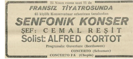
Cortot'nun konser ilanı, Akşam, 21 Nisan 1938