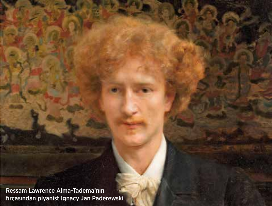
Ressam Lawrence Alma-Tadema’nın fırçasından piyanist Ignacy Jan Paderewski