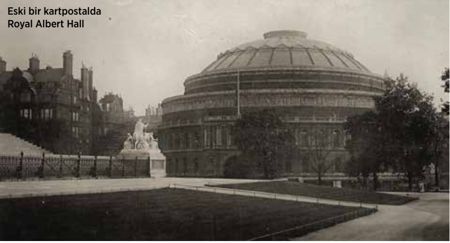
Eski bir kartpostalda Royal Albert Hall