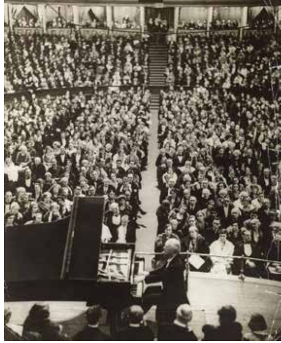
Paderewski'nin Royal Albert Hall'da 12 Ocak 1933'te verdiği resital