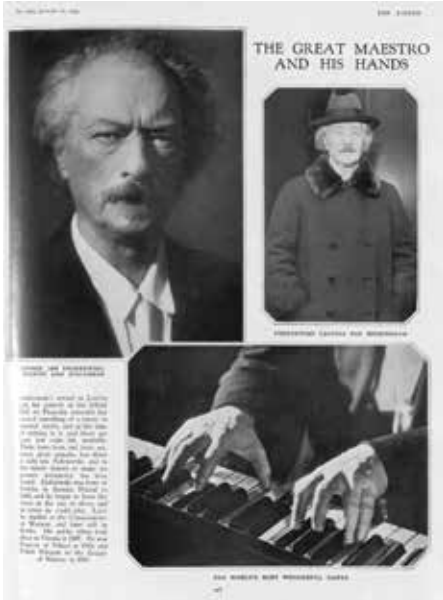
11 Ocak 1933 tarihli The Tatler dergisinde Paderewski

mektubuyla aynen örtüşüyordu. Bestecisini belirtmeden mektubunda “ Symphony in E minor'u ise beğendim” diye yazdığı eser Brahms'ın Mi minör 4. Senfonisi'ydi. Sibelius'un En Saga 'sı için “ Hakikaten sisli bir sabah içinde bir avı hatırlatıyor ” diye yazması ise bizzat yaşadığı ve mektuplarına da taşıdığı Londra sislerinden dolayı olmalıydı. Konserde ayrıca César Franck'ın Senfonik Varyasyonlar 'ı da çalınmıştı.