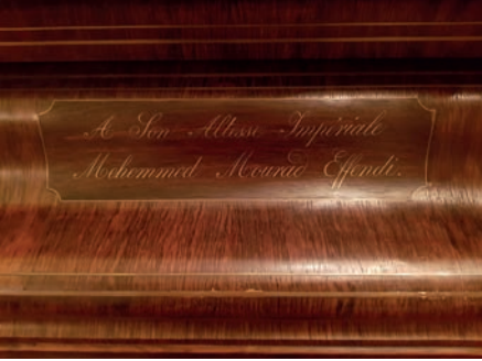
Piyanonun kapağında Şehzade Murad Efendi'ye takdim yazısı

Sultan, İstanbul 1998, s.17) Sultan V. Murad daha küçük yaşında piyanoyla tanışmış ve müziği hep sevmiştir. 1876'da amcası Sultan Abdülaziz'in yerine tahta çıkartılıp üç ay sonra indirilmesinin ardından bir daha hiç kapı dışarı çıkmamak üzere 28 yıl Çırağan Sarayı'nda sabık bir yaşam sürdüğü zaman da ömrünün büyük bir kısmını piyano başında vals, polka, galop ve kadril türünde yüzlerce Avrupalı dans parçaları besteleyerek geçirecekti.