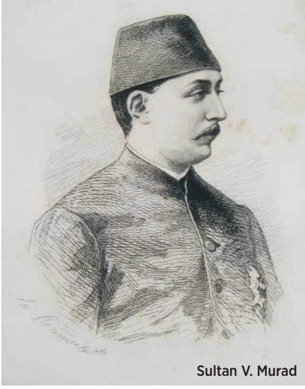
Sultan V. Murad