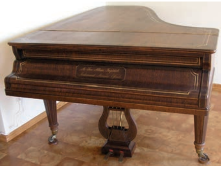
Sultan V. Murad'ın Érard piyanosu