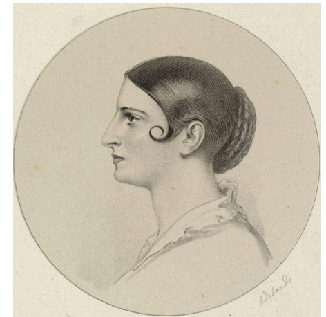
Adelaide Kemble Sartoris