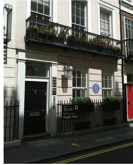
Chopin'in Londra'daki son adresi 4 St James's Place

toplannmıştı. İngiliz kraliyet ailesinden Kraliçe'nin kuzeni Prenses Alexandra'nın himayesinde gerçekleşen bu baloda piyanist Christian Blackshaw, Si bemol Minör, Opus 9, No. 1 Noktürn'ü ve Opus 28, 24 Prelüd'ü seslendirmiş ve Oliver Davies, Chopin'in o konserinde kullandığı ve günümüzde Hatchlands Park malikânesindeki Cobbe Koleksiyonu'nda muhafaza edilen 1847 yapımı Broadwood marka (17.047 seri numaralı) piyanoyu çalmıştı. Çalışır durumdaki o aynı piyanoyu Guildhall'a geri dönmüş bir hâlde görmek dahi inanılmaz bir tarihi rekonstrüksiyonun o gece gerçekleştirilmiş olduğunun ispatıydı. Ardından Guildhall'un Gotik salonunda verilen yemekte ise Chopin'in mektuplarında tasvir etmiş olduğu, sanki o kaybolmuş dünyanın esasında hiç de kaybolmamış olduğunu hissediyordu insan.