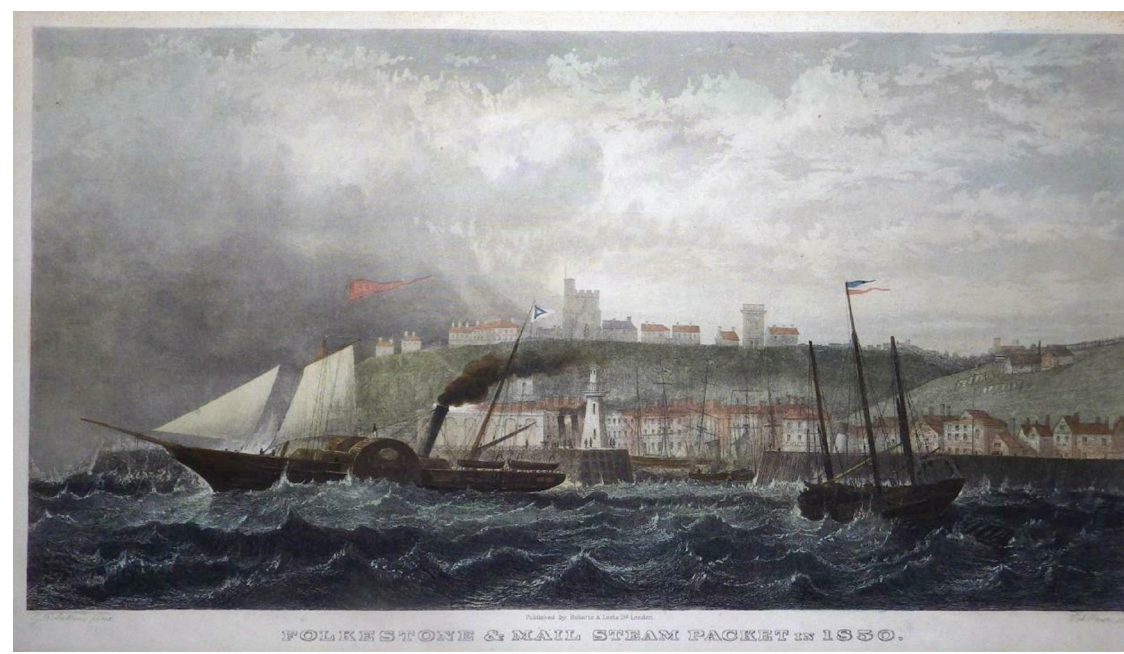
1850'lerde Folkestone Limanı; Chopin benzer bir buharlı gemiyle İngiltere'ye gelmişti

bakarken de Kierkegaard'ın bu sözlerini hatırlıyorum ve o zaman çağdaşı olup onun sözlerle yaptığım bizlere müziğiyle hissettiren, aynı duyguları notaya nakşedebilmiş olan ve her dinleyişimizde hayatın o paradokslarını hatırlatan, üstelik 1848 senesinde artık bu terk edilmiş limanda gemiden inip, biraz dinlendikten sonra trene binerek Kierkegaard gibi manzaraların avucundan uçup gittiği bir yolculuktan sonra Londra'ya varan Chopin'i düşünüyorum. 1837'de yapmış olduğu ilk İngiltere seyahatinin ardından Chopin, Boulogne'da bindiği vapurdan Folkestone'da inerken ikinci ve son olarak Britanya adasına adım atıyordu ve esasında Fransa'dan biraz da apar topar kalkıp gelmek zorunda kalmıştı. Avrupa'yı kasıp kavuran devrim ruhu Fransa'ya da ulaşmış, 1848 Şubat'ında Kral Louis Philippe tahtından feragat ederek İngiltere'ye sığınmak zorunda kalmış, bu karmaşık ortamda Chopin pek çok aristokrat öğrencisini kaybetmişti. Bu durum karşısında İskoç asıllı öğrencisi Jane Stirling ve dul ablası Katherine Erskine, Chopin'e Londra'ya gelmesini tavsiye etmiş ve kendilerinin ona yeni öğrenci bulmak konusunda yardımcı olacaklarının da teminatını vermişlerdi. Polonyalı piyanistin vefatından bir yıl önce,