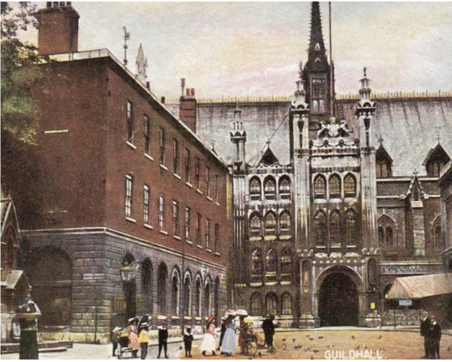
Chopin'in son konserini verdiği Londra'daki Guildhall