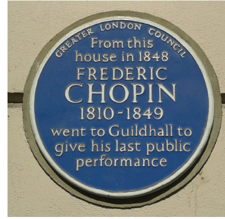
4 St James's Place adresindeki anı plaketi