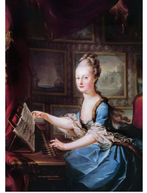
Marie Antoinette piyanosu başında (Ressam: Franz Xaver Wagenschön)

Aynı odada Kraliçe Charlotte'un da bir portresi asılı, çünkü İngiltere Kralı III. George'un karısı olan Alman asıllı Charlotte, Bach'ın 18 çocuğundan en küçük oğlu olan ve Londra'ya taşınmasının ardından müzik tarihine adı "İngiliz Bach"