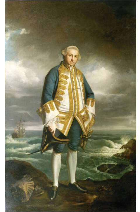
Hatchlands Park'ı inşa ettiren Amiral Boscawen (Ressam: Sir Joshua Reynolds)

Şirin Clandon İstasyonu'nda güneşli bir günde trenden indiğim zaman seyahat ettiğim South Western Demiryolları'nın penceresi hâlâ açılabilen eski vagonları sayesinde Surrey'nin o güzel mayıs havasını zaten ciğerlerimde soluyordum. Bahçe kapısından girdikten sonra kavis