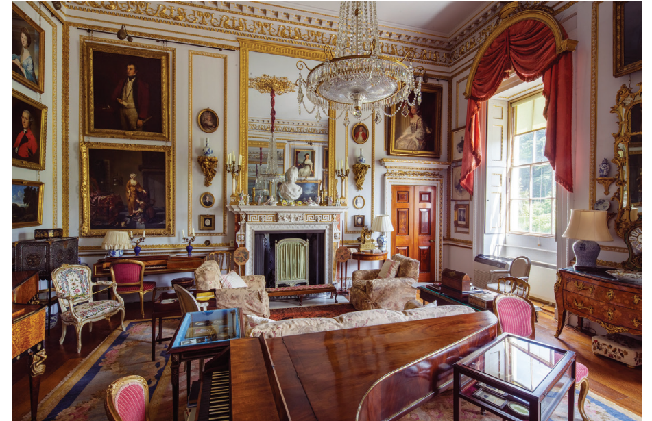
Hatchlands'ın Kabul Salonu'nda Marie Antoinette'in büstü ve duvara dayalı piyanosu