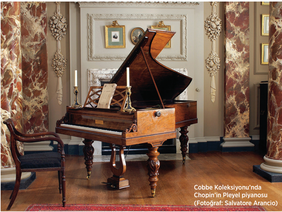
Cobbe Koleksiyonu'nda Chopin'in Pleyel piyanosu