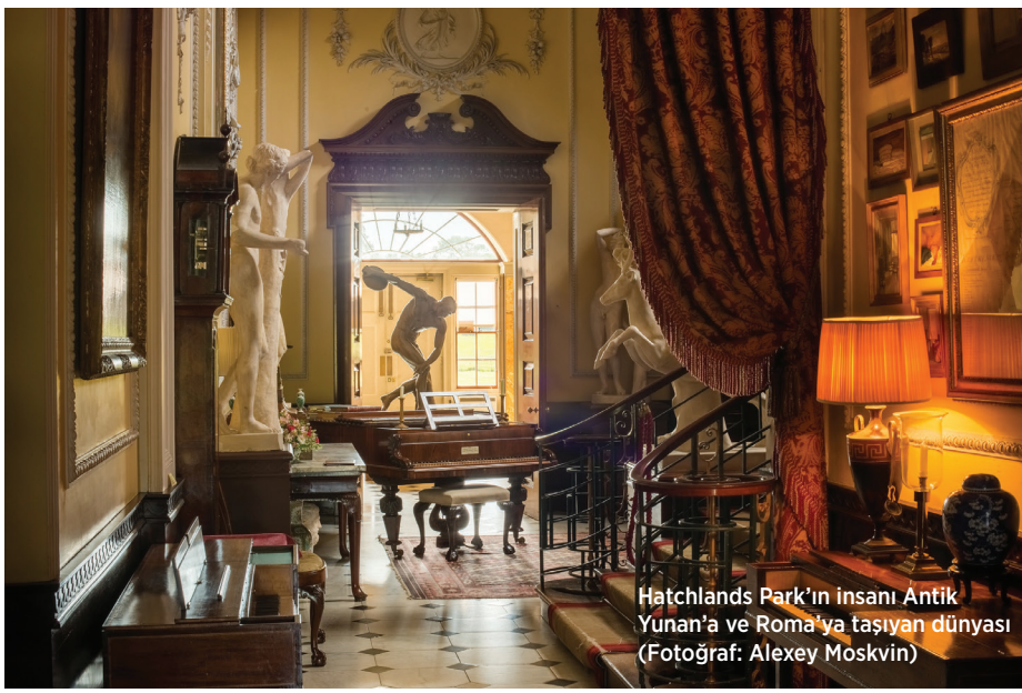
Hatchlands Park'ın insanı Antik Yunan'a ve Roma'ya taşıyan dünyası

çizen patika yolu yürüyerek ulaştığım parkın ortasındaki ev ise çoktan farklı bir zaman dilimine adım atmış olduğumun müjdecisiydi. Cetvelle çizilmiş çimen bordürleri arasında bahçıvanlar huzurla çalışıyordu; öğleden sonra 14.00'te kapılarını açan Hatchlands o günkü ziyaretçilerine ve yaklaşan yaz mevsimine belli ki hazırlık yapıyordu. Garden Hall olarak bilinen Bonomi'nin tasarladığı eski ana giriş kapısından içeri girdiğim zaman karşıma çıkan ve beni sanki Grand Tour'a çıkmış bir 18. yüzyıl centilmeni gibi Roma'ya, antik Yunan'a, Olympia'ya götüren Napoliten bronzlardan, o öğleden sonra, sadece müzik estetiği açısından değil, içimizde güzel sanatların tamamına karşı hissettiğimiz bütün estetik duyguların Adam'ın görkemli salonundaki mermer şöminenin üzerinde yer alan frizde betimlenmiş, kanatlı bir tanrıçanın sürdüğü o iki tekerli yarış arabasını çeken ve elimde tuttuğum kılavuz kitabın kapağını da süsleyen dinamik atlar havasında şahlanacağından emindim.