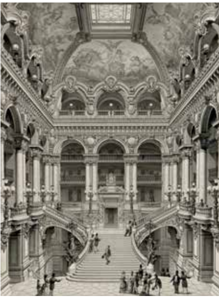
Paris Operası'nın anıtsal merdivenleri

kapanış ise Gounod'ya aitti. O akşam İstanbul için 60.000 Fransız frangı toplanmıştı. Stilleri o kadar farklı olan dört besteciyi tek bir tema altında buluşturmuş olmak ise ayrı bir başarı olmalıydı.