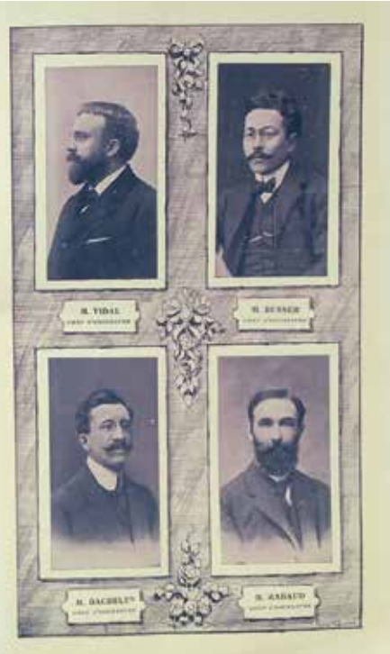
Konserin organizasyon komitesi ve orkestra şefleri, (Emre Aracı koleksiyonu)