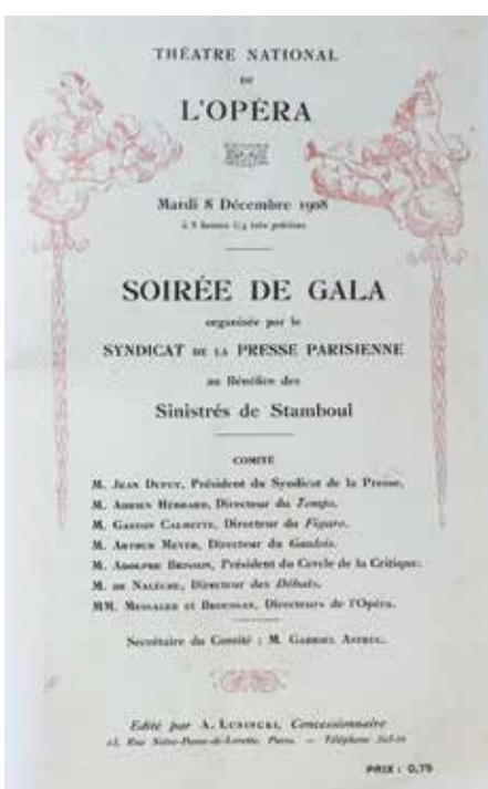
Paris Operası'nda 8 Aralık 1908'de verilen konser, (Emre Aracı koleksiyonu)