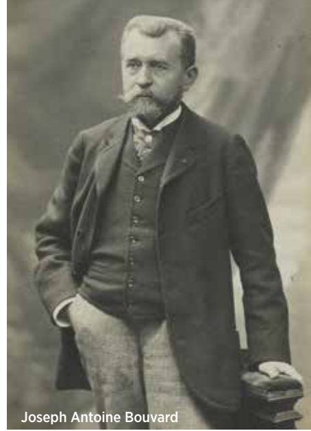
Joseph Antoine Bouvard

Hiç beklenmedik bir şekilde bir internet sitesinde karşıma çıkarak satın aldığım bu orijinal programın bir zamanlar mimar Joseph Antoine Bouvard'a (1840-1920) ait olduğunu öğreniyorum. 1900 Paris Evrensel Sergisi'nin