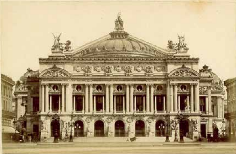
Paris'in tarihi operası Palais Garnier

Bugün adı meşhur bir orkestra ve konser serisinde yaşayan Edouard Colonne (1838-1910) o akşam eserleri seslendirilen bütün bestecileri zaten yakından tanımıştı. Bir Berlioz hayranı olduğu gibi Fransız bestecinin en fazla yapıtını seslendiren şef olarak biliniyordu. Paul Antonin Vidal (1863-1931) ise Jules Massenet'nin öğrencisi olmuş, Prix de Rome'ü kazanmış, Debussy'nin yakın arkadaşı olan kıymetli bir şef olduğu kadar önemli bir besteciydi. Hatta Roma'da Liszt'in Faust Senfonisi 'nin iki piyano düzenlemesini