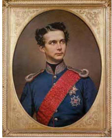
Bavyera kralı II. Ludwig (Wilhelm Tauber, 1864)