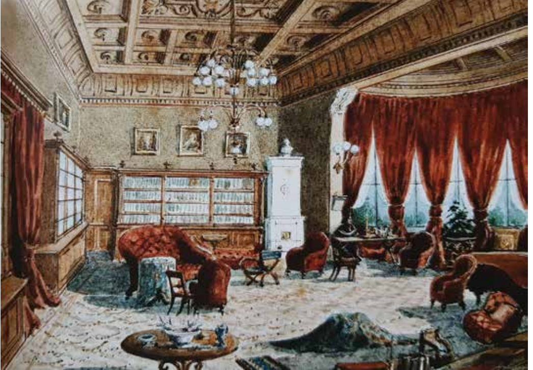
Wahnfried'in salonu (Susanne Schinkel, suluboya 1876)