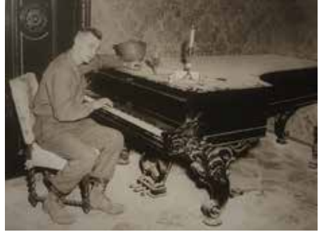
II. Dünya Savaşı sonrasında bir Amerikan askeri Wagner'in Steinway piyanosunu çalarken

gibi Wahnfried'de yerli yerinde duruyor. Filozof Arthur Schopenhauer'in portresi de Wagner'in dünyasının kahramanları arasında bu Valhalla'da yerini almış durumda. Ama bazı eşyaların ve tabloların üzerinin örtülü olması yine de beni şaşırtıyor. " Acaba müze evde kış temizliği mi yapıyor? " diye düşünüyorum. Dayalı döşeli bu salonun eski gravürlerinden gördüğüm mobilyaların yokluğunu da yadırgıyorum. Sanki Wagner ailesi yine bir İtalya seyahatine çıkmış da, kapattıkları evlerine daha henüz geri dönmemiş gibi bir mizansen yaratılmış olduğunu öğreniyorum. Esasında bu mizansenin