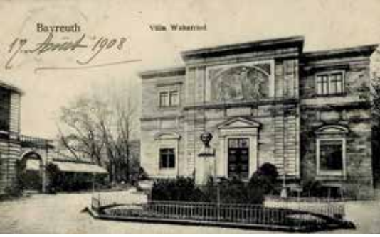
Eski bir kartpostalda Wahnfried

çıkılan ana giriş kapısının sağ ve soluna yerleştirilmiş iki kitabe yer alan "Hier wo mein Wähnen Frieden fand - Wahnfried - sei dieses Haus von mir benannt" ( "Bütün hezeyanlarım burada huzura kavuştu, burasının adı Wahnfried olsun." ) cümlesinde aktarıldığı gibi Wagner'in fırtınalı yaşamından sonra ulaştığı dingin bir barınak olarak tasarlanmış ve yaratılmıştı. Oysa Wagner'in her zaman olduğu gibi çelişkilerle dolu dünyasında bu villanın ortaya çıkışı hiç de cephesindeki o masum ifade kadar dingin değildi. Hatta inşaat safhasındaki zorluklardan dolayı besteci buraya "Ärgersheim" (sinir bozan ev) adını dahi takmıştı.