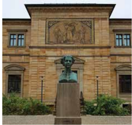
Haus Wahnfried'in ön cephesi

Wagner'in Schopenhauer etkisi altındaki felsefi sembolizminin ifade bulduğu bu yapının hiç de gelişigüzel bir şekilde inşa edilmemiş olduğu, daha içerisine henüz adım atmadan, cephesinde okuduğum ve bestecinin kendisinin düşünüp bularak 4 Mayıs 1874 tarihinde ilan ettiği "Wahnfried" adından bile derhâl belli oluyordu. "Wahnfried" Almandaca çılgınlık, hayal veya hezeyan anlamına gelen "Wahnen" kelimesi ile hürriyet veya huzur anlamındaki "Frieden" kelimesinin birleşiminden oluşmaktaydı ve ağaçlıklı yolun sonundaki birkaç basamakla