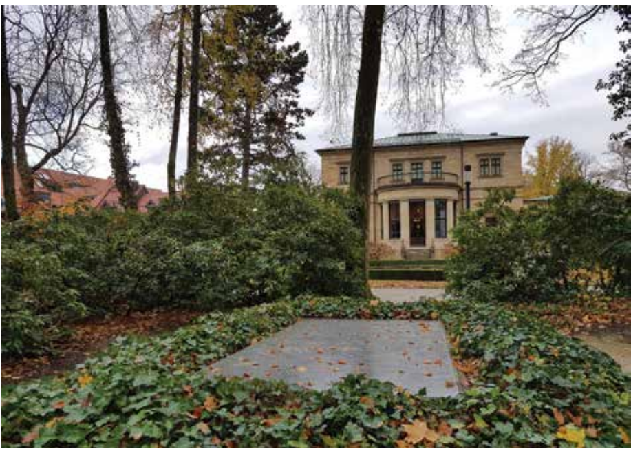
Wahnfried'in bahçesinde Richard ve Cosima Wagner'in mezarı