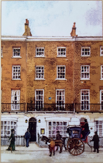
221 b Baker Street, London