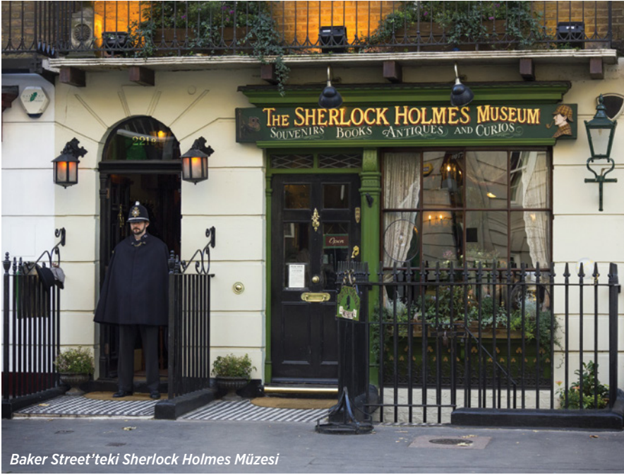
Baker Street'teki Sherlock Holmes Müzesi

Sherlock Holmes Müzesinde, Holmes'un çizim odasından bir kare. Oda da keman, birçok bilimsel deney ekipmanı ve duvarda Sudan Valisi Gordon Paşa'nın portresi bulunmaktadır.