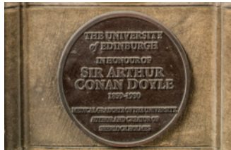
Üstte; Edinburgh'daki Sherlock Holmes heykeli Altta; Edinburgh Üniversitesi'nde Sir Arthur Conan Doyle plaketi