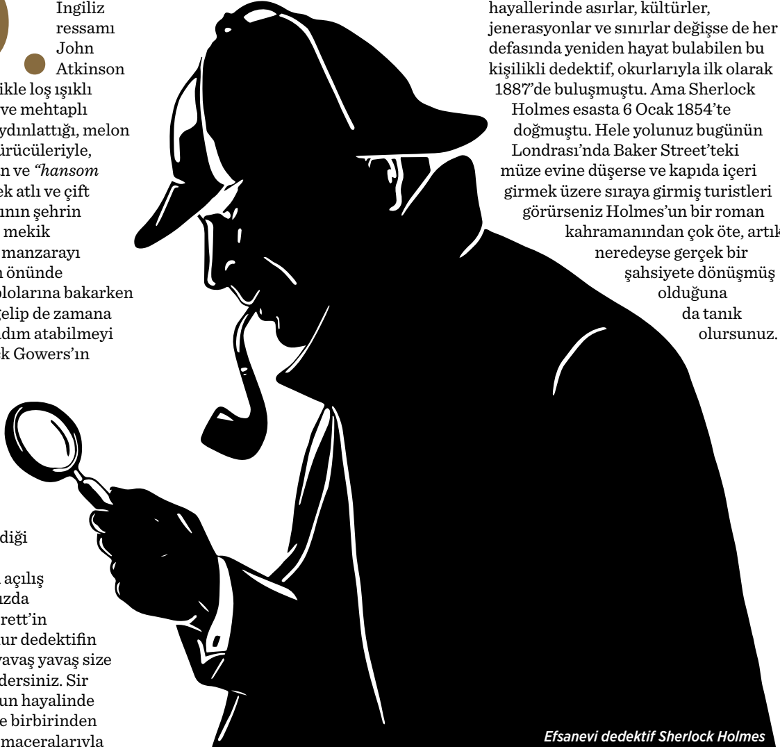
Efsanevi dedektif Sherlock Holmes

beraberinde sürüklediği okurlarının hayallerinde asırlar, kültürler, jenerasyonlar ve sınırlar değişse de her defasında yeniden hayat bulabilen bu kişilikli dedektif, okurlarıyla ilk olarak 1887'de buluşmuştu. Ama Sherlock Holmes esasta 6 Ocak 1854'te doğmuştu. Hele yolunuz bugünün Londrası'nda Baker Street'teki müze evine düşerse ve kapıda içeri girmek üzere sıraya girmiş turistleri görürseniz Holmes'un bir roman kahramanından çok öte, artık neredeyse gerçek bir şahsiyete dönüşmüş olduğuna da tanık olursunuz.