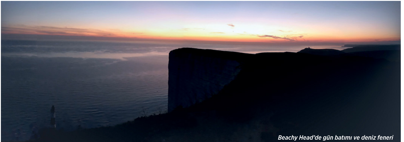
Beachy Head'de gün batımı ve deniz feneri

Emre Aracı'nın Andante 'deki geçmiş yazılarının tamamına www.emrearaci.weebly.com adresinden ulaşabilirsiniz.