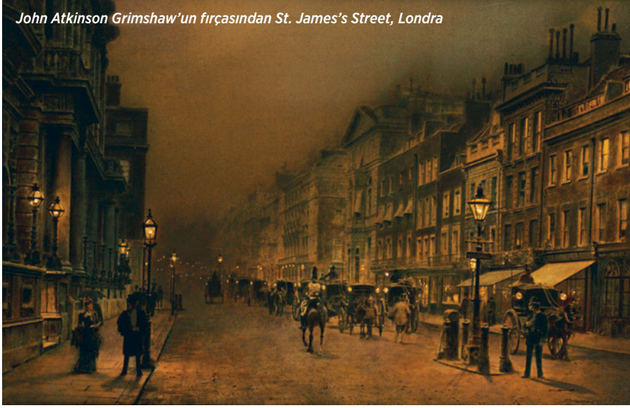
John Atkinson Grimshaw'un fırçasından St. James's Street, Londra

Ortaokul yıllarımda Sherlock Holmes'u ilk olarak yukarıda bahsettiğim televizyon dizisinden tanımıştım. 221b Baker Street adresindeki Mrs. Hudson'ın evinde Holmes'un yaşadığı dairenin havası, dekorasyonu, duvarındaki resimleri ve Dr. Watson'la olan sıradışı arkadaşlığı beni her hafta Viktorya devri Londra'sının sokaklarına götürüyor ve garip bir şekilde o döneme, hayata ve diyarlara cezbediyordu. Gün gelip de o sokaklarda dolaşacağım tabii ki o yıllarda aklımın ucundan dahi geçemezdi. Holmes'un odasına girildiğinde kapının hemen yanında, duvardaki çerçevesi içerisinde göze çarpan fesli, madalyalı ve sırma süslü üniformalı bir Osmanlı paşasının resmini her gördüğümde ise bunun neden orada asılı durduğunu ve kim olduğunu merak ederdim. Hatta yanlış görüp görmediğimden de bir türlü emin olamazdım. Sonradan o gravürün Mısır Hıdivi İsmail Paşa'nın hizmetine girmiş olan İngiliz generali ve Sudan Valisi