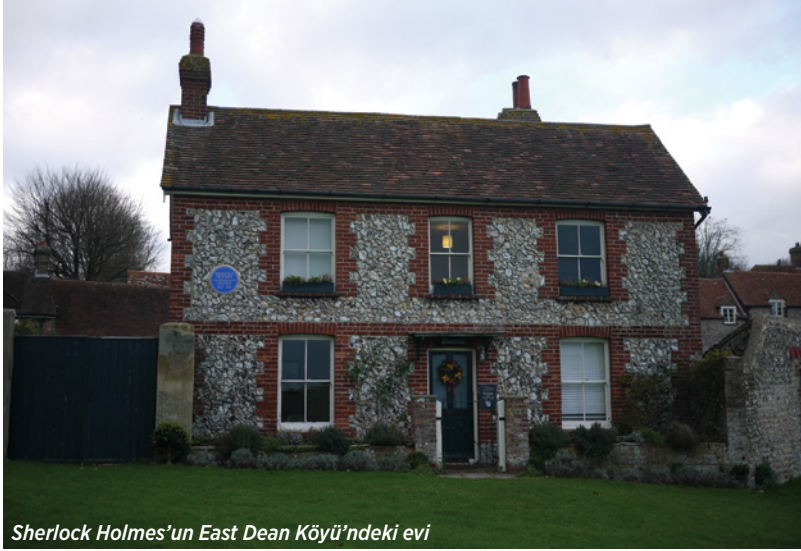
Sherlock Holmes'un East Dean Köyü'ndeki evi