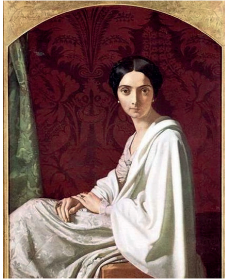
Prenses Cristina Trivulzio Belgiojoso (Henri Lehmann, 1843)