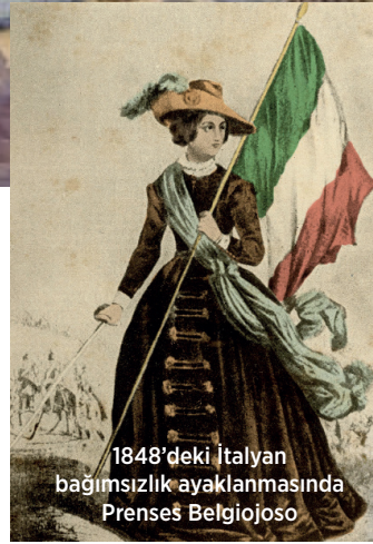
1848'deki İtalyan bağımsızlık ayaklanmasında Prensess Belgiojoso

Çiftliği'ne yerleşti. Burada tarım ve hayvancılıkla uğraşırken bir yandan da Türkiye intibalarını kaleme aldığı kitaplar yazdı. Hatta nadir bir kopyasını Paris'ten satın aldığı kapağı taçlı ve aile armalarıyla bezeli Souvenirs dans l'exil de (Sürgün Hatıratı) böyle bir dönemin eseri olarak kaleme alınmıştı. Bestecilerle bu kadar yakın ilişki kurmuş olan Cristina Belgiojoso'nun İstanbul müzisyenleriyle de irtibat kurmamış olması hâliyle beklenemezdi. Nitekim Paris'in Le Nouvelliste gazetesine Ortaköy'den yazarak yolladığı ve gazetenin 14 Ekim 1850 tarihli sayısında yayımlanan mektubunda İstanbul'da Giuseppe Donizetti'yle tanıştığını ve onun idaresinde bir orkestra provasına katıldığını anlatıyordu.