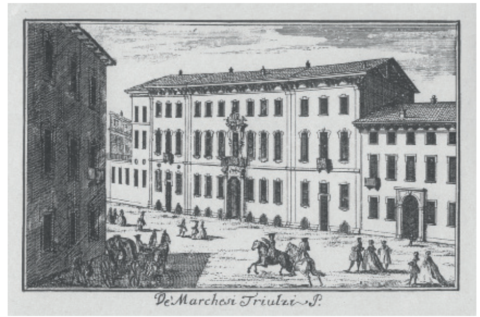
Milano'daki Palazzo Trivulzio

Cristina Trivulzio 1808'de Milano'nun Sant' Alessandro Meydanı'nda bulunan ve bugün de hâlâ ayakta duran Barok üsluptaki aile sarayı Palazzo Trivulzio'da dünyaya geldi. Hem baba hem de anne tarafından İtalya'nın en köklü, soylu ve varlıklı ailelerine mensup-