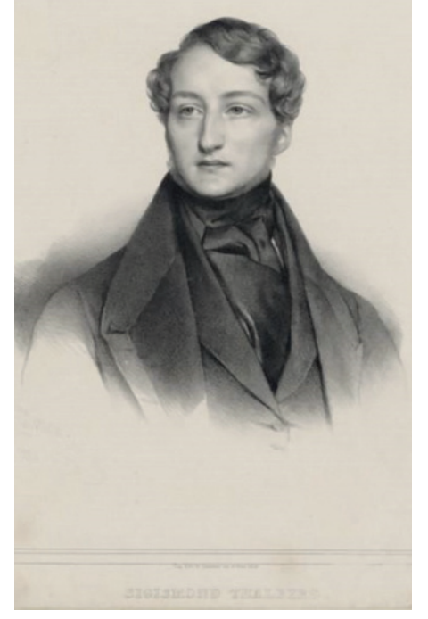
Sigismund Thalberg, (Henri Grevedon, 1836)

Paris'te böylesine yoğun bir kültür hayatından sonra Prens Belgiojoso 1838'de kızı Maria'nın dünyaya gelmesinin ardından İtalya'ya geri döndü. 1848'de İtalya'daki isyanlarda Napoli'de bir araya getirdiği 160 direnişçiyi birlikte Milano'ya yürüdü. Ancak Avusturya idaresinin isyanı bastırmasıyla yaşadığı hayal kırıklığının ardından İngiltere'ye kaçmayı düşündüyse de ona kucak açan bir başka ülkeye sığınmayı tercih etti ve kızı Maria'yı da yanına alarak Malta üzerinden Atina ve ardından İstanbul'un yolunu tuttu. 1850'de Osmanlı İmparatorluğu'na siyasi bir mülteci olarak gelen bu İtalyan prenses beş yıl boyunca Türkiye'den hiç ayrılmadı. Üstelik