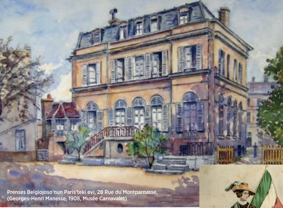
Prensess Belgiojoso'nun Paris'teki evi, 28 Rue du Montparnasse, (Georges-Henri Manesse, 1908, Musée Carnavalet)