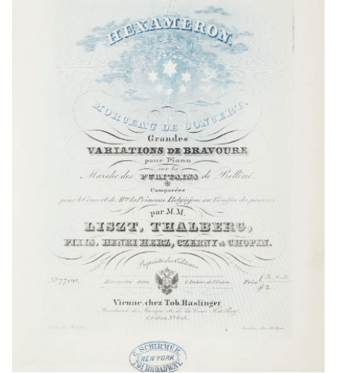
Prens Belgiojoso'nun yaratılmasına vesile olduğu 'Hexameron'

İstanbul'da bir süre kaldıktan sonra Safranbolu, Karabük yakınlarında mektuplarında adını "Cıaq Maq Oglü" olarak yazdığı Çakmakoglu