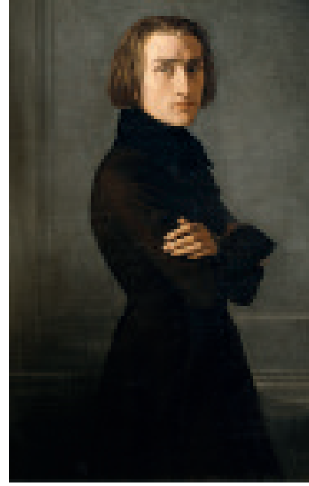
Franz Liszt, (Henri Lehmann, 1839)

rarına düzenlenen o günkü salon konserinde piyanodaki hünelerini bir düello havasında birbirleriyle rekabet ederek sergilemişlerdi. Seslendirilen eserler arasında Liszt, Meyerbeer'in operası üzerine kendi fantezisi Reminiscences de Roberts le Diable 'i, Thalberg ise Rossini'nin Moise operasından Op.33 fantezisini çalmıştı. Hakemlik yapan Prens Belgiojoso'nun kazanan hakkındaki yorumu ise bir hayli diplomatik olmuştü: "Thalberg dünyadaki birinci piyanist, ama Liszt eşsiz" idi. Liszt 1830'larda Kontes Marie d'Agoult ile birlikte İsviçre'ye sürgüne gidince, Thalberg kısa sürede Paris'in yolunu tutmuş ve devrin en meşhur piyanisti olarak nam salmaya başlamıştı. 1836'da Liszt'in Paris'e geri dönmesiyle aralarında büyük bir rekabet başlamış ve halk iki piyanistin hesaplaşacağı ortak bir konserde buluşmalarında ısrar eder olmuştü. İşte o gün bu tarihi hesaplaşmaya Prens Belgiojoso ev sahipliği yapmış oluyordu. Bu konser vesilesiyle prenses Liszt, Thalberg, Johann Peter Pixis, Henri Herz, Carl Czerny ve Chopin gibi devrin en parlak piyanistlerini ortak bir bestede bir araya