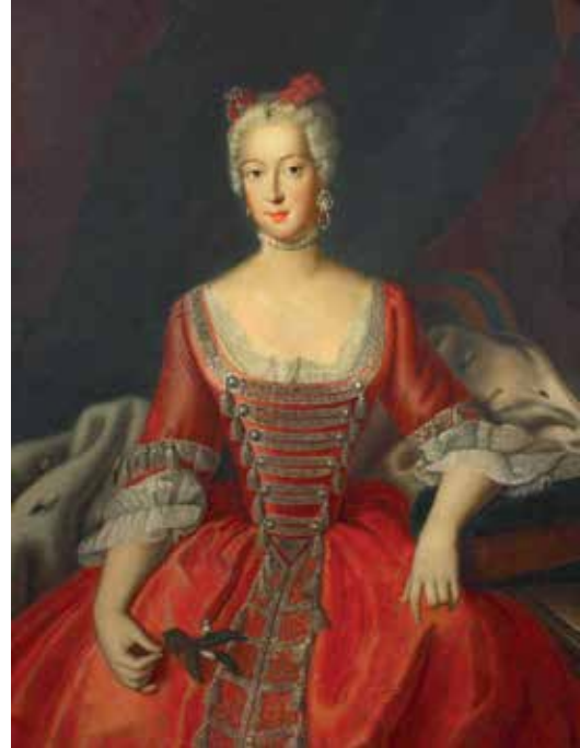
Markgravin Wilhelmine (Ressam: Antoine Pesne)

Aşırı süslü ve yaldızlı bir yazmanın sayfalarını çevirircesine, kanatlı meleklerin taçlı armaları göğe yükselttiği bu hayalhânedede insan Markgraf Frederick ve Markgravin Wilhelmine'in hükümdarlığını ölümsüzleştiren, tiyatro duvarlarında bezeli heykellerin oyunlarından nasıl fırsat bulur da sahnedeki aksiyona konsantre olabilir diye merak ediyorum. Zaten sahnesinde kısıtlı sezonda verilen temsillerin dışında kalan uzun dönemlerde hiçbir eserin oynanmadığı 500 kişi kapasiteli bu boş