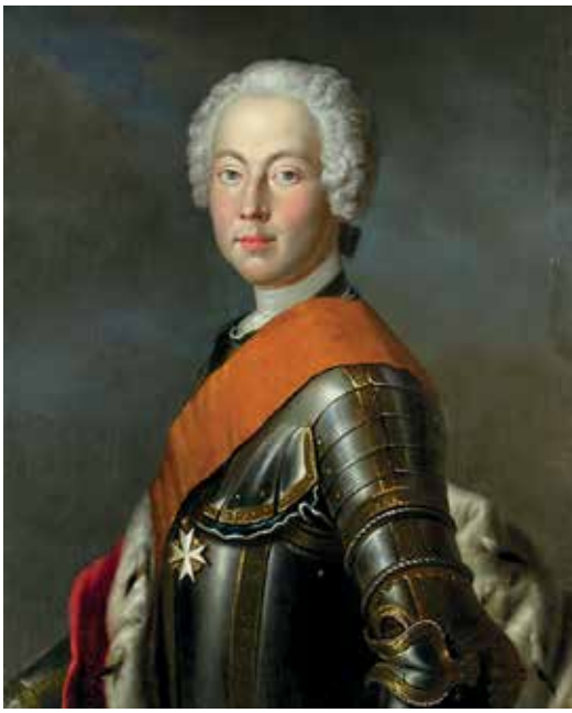
Markgraf Frederick (Ressam: Georg Lisiewski'ye atfen)

tiyatro oditoryumunun günlük turlarla ve belirli saat aralıklarında gezdiriliyor olmasının sebebinin, zamanında pek çok başrole ev sahipliği yapmış olan bu yapının esasta başrolü kendi mevcudiyetiyle oynuyor olmasından ötürü olduğuna inanıyorum. Oditoryumun bir kapısından yeni bir tur grubu girip, diğer kapıdan turu tamamlamış olan grup çıkarken içeride geçen o 45 dakika içerisinde sahnede kurulu gerçek bir Barok dekorun cephesine yansıtılan ve tiyatro tarihçesinden kesitlerin gösterildiği görüntü ve ses kaydının bu tapınağa çok özel bir ruh verdiğine tanık oluyorum. Farinelli (1994) filminin sahnelerinin çekildiği, eşine nadir rastlanır bu Barok tiyatronun II. Dünya Savaşı sırasında bombardıman ve tahribattan kurtulmuş olmasına ise insan doğrusu şükrediyor.