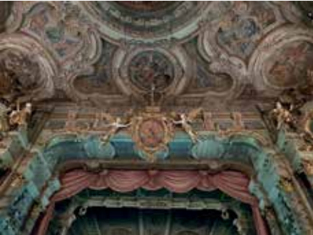
Margravial Operası'ndan detay

seferine çıkarken tiyatronun sahne perdesini de beraberlerinde götürmüşlerdi. Ancak 1810'da Bayreuth ve bölgesi Bavyera Krallığı'nın idaresi altına girince tiyatronun yıldızı da yeniden parlamaya başladı. 25 sene sonra ise 1835'te Karlsbad'dan Nürnberg'e seyahat ederken Wagner ilk olarak Bayreuth'tan geçti. Ring operalarını sahneleyebileceği uygun bir tiyatro arayışı içerisinde Hans Richter'den buradaki tiyatronun 27 metre derinliğinde büyük bir sahnesi olduğunu duyunca da 1871'de Cosima'yla birlikte sahneyi görmek için Bayreuth'a geri döndü. Tannhäuser 1860 yılında burada sahneye konmuştu, ancak besteci Rokoko süslemeleri, locaları ve kısıtlı sahnesiyle Ring operalarının sahnelenmesi için burasının hiç de uygun olmayacağını derhâl anladı. Ama yine de Margravial Opera Binası, Festspielhaus'un 22 Mayıs 1872'deki temel atma töreninde önemli bir rol oynadı. Wagner'in 59. yaş gününe denk düşen bu özel törenin ardından besteci tiyatronun sahnesinde Beethoven'ın 9. Senfoni'sini idare etti. Dolayısıyla Wagner'i Bayreuth'a getiren bu tarihi Barok tiyatro, Markgravin Wilhelmine'in hayallerini yaşatırcasına Aydınlanma Çağı'nın ruhunu taşımaya ve yansıtmaya, sanatçıları, yaratıcı insanları benliğine cezbetmeye devam ediyordu. Doğrusu kelimelerle ifadenin yetersiz kaldığı binanın bu sihri ise ancak kapısından içeri adım atanların hissedebileceğine inanıyorum.