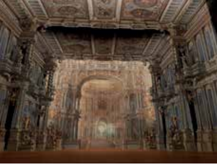
Margravial Operası'nın sahnesi