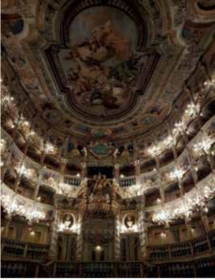
Margravial Operası'nın içi