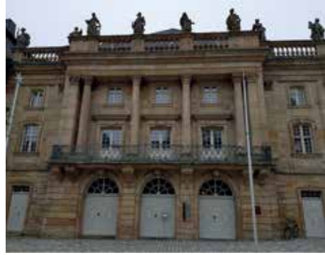
Bayreuth'un Margravia Operası'nın ön cephesi

Bahsettiğim tiyatro Bayreuth'u karşımdaki o haritaya koyan Wagner'in, üstü kapalı antik Yunan amfiteyatroları havasında tasarlayarak şehre hediye ettiği Festspielhaus (Festival Tiyatrosu) değil, bilâkis besteciye o şehre çekerek buraya yerleşmesine vesile