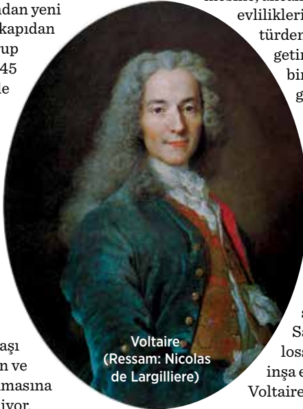
Voltaire (Ressam: Nicolas de Largilliere)

tiyatro oditoryumunun günlük turlarla ve belirli saat aralıklarında gezdiriliyor olmasının sebebinin, zamanında pek çok başrole ev sahipliği yapmış olan bu yapının esasta başrolü kendi mevcudiyetiyle oynuyor olmasından ötürü olduğuna inanıyorum. Oditoryumun bir kapısından yeni bir tur grubu girip, diğer kapıdan turu tamamlamış olan grup çıkarken içeride geçen o 45 dakika içerisinde sahnede kurulu gerçek bir Barok dekorun cephesine yansıtılan ve tiyatro tarihçesinden kesitlerin gösterildiği görüntü ve ses kaydının bu tapınağa çok özel bir ruh verdiğine tanık oluyorum. Farinelli (1994) filminin sahnelerinin çekildiği, eşine nadir rastlanır bu Barok tiyatronun II. Dünya Savaşı sırasında bombardıman ve tahribattan kurtulmuş olmasına ise insan doğrusu şükrediyor.