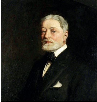
Sir Paolo Tosti (John Lavery, 1903, Kraliyet Müzik Koleji)

Roma gerçekten de Tosti'nin kaderini değiştirecekti; zira burada Liszt'in desteğini almış olan piyanist ve besteci Giovanni Sgambati ile tanıştı. Sgambati Roma'nın önde gelen sanatçı ve aristokratlarıyla yakın bir temas içerisindeydi ve kısa zamanda Tosti'nin bu ortamda tanınmasını sağladı. Bu meteorik yükseliş o kadar süratli oldu ki Tosti kısa bir süre içerisinde, kendisini bir konserde dinleyen, Savoy hanedanından Piedmont Prensesi, yani istikbâlin İtalya Kraliçesi Margherita'nın şan hocası olarak buldu. Tosti artık o salon şarkılarının nüvesini oluşturacak