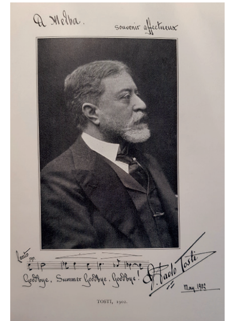
Tosti’nin Nellie Melba’ya 1902’de imzaladığı fotoğrafı, (Emre Aracı koleksiyonu)

demisi’ne yürüme mesafesinde, oturduğu 12 Mandeville Place’in duvarına yerleştirilmiş olan yeşil bir anı plaketi gelip geçenlere o binada bir zamanlar besteci Sir Paolo Tosti’nin dairesinin olduğunu duyuruyor. Gerçi bugün bu daire Mandeville Otelinin lokantası olmuş olsa da Tosti’nin anısı yine de yaşıyor. Ancak Tosti I. Dünya Savaşı yaklaşırken 1913’te buradan ayrılıp İtalya’ya döndüğünde İngiltere yılları da kapanmış oluyordu. Esasında bestecinin sadece üç yıllık ömrü kalmıştı; Roma’da Excelsior Otelinde bir daireye yerleşti ve I. Dünya Savaşı devam ederken burada 2 Aralık 1916’da hayata gözlerini yumdu. Tosti’nin hayatında tarihi otellerin özel bir yeri olsa gerek ki İngiltere’nin güneydoğu sahilindeki Folkestone kasabasının, bir dairesinde bu makaleyi kaleme aldığım, eski Grand Otelinde de de besteci 1900’lü yılların ilk on yılında yazlarını geçirmiş ve şarkılar kaleme almıştı. Sybil Seligman da burada kalmış olmalıydı ki Puccini ona 1911 yılının Aralık ayında İtalya’dan bu otele postaladığı bir mektup yollamıştı. Seneler sonra o mektubu Puccini’nin el yazısıyla Washington’daki Kongre