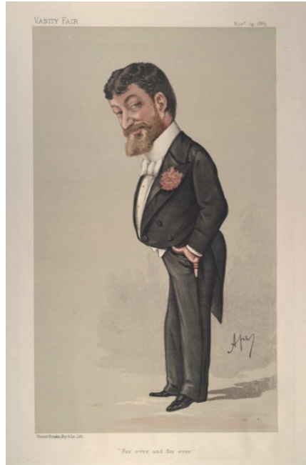
Tosti’nin 14 Kasım 1885 tarihli Vanity Fair dergisinde yayımlanan karikatürü

Bana stili hep, kendisine bir eserini de ithaf etmiş olduğu, Reynaldo Hahn’ın o duygusal