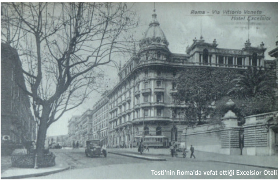
Tosti'nin Roma'da vefat ettiği Excelsior Oteli