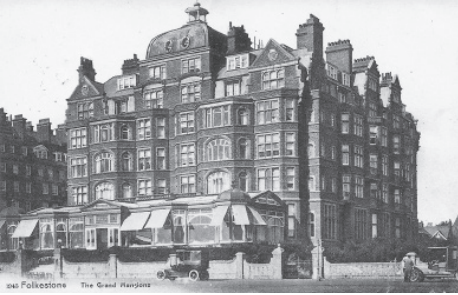
Tosti'nin yazlarını geçirdiği Folkestone'daki Grand Otel

Kütüphanesi'nin arşivinde keşfedecektim. Ne de olsa Sarah Bernhardt'ın sahneye çıktığı, Oscar Wilde'ın bir buket zambakla Fransız tiyatro sanatçısını rıhtımında karşıladığı o devrin Folkestone'ı tam da Tosti'nin şarkılarının betimlediği bir manzaranın ve sosyal yaşantının canlı bir tablosu gibiydi. Üstelik geçenlerde pencereden gördüğüm suya aksetmiş hilal ayın loş ışığında onları görmemek imkânsızdı.