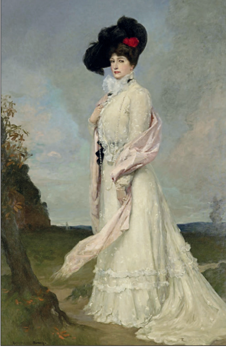
Avusturyalı soprano Dame Nellie Melba, (Rupert Bunny, 1902, Victoria Milli Galerisi)

Auguste Escoffier tarafından özel olarak yaratılmış ve Covent Garden’da rol aldığı bir Lohengrin temsilinden sonra buzdan yapılmış bir kuğu içerisinde, o ara kendisiyle gizli bir aşk ilişkisi içerisinde bulunduğu, Fransa tahının varisi Orleans Dükü Philippe’in onuruna verdiği akşam yemeği esnasında ilk olarak davetlilere sunulmuştu.