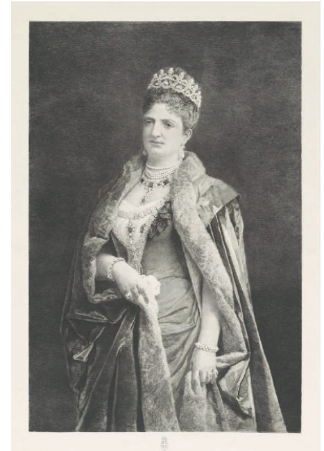
Tosti'nin öğrencisi Savoy Hanedanı'ndan İtalya Kraliçesi Margherita

soprano Nellie Melba (1861-1931) ile tanıştı. Asıl adı Helen Porter Mitchell olan ünlü soprano doğduğu Melbourne şehrini onurlandırmak için Melba soyadını almıştı. Adı çoğumuzun hiç de farkında olmadan yediği "Peşmelba" tatlısıyla günümüzde hâlâ yaşmaya devam eden Melba için şefitali bu tatlı Londra'daki Savoy Oteli'nin Fransız aşçısı