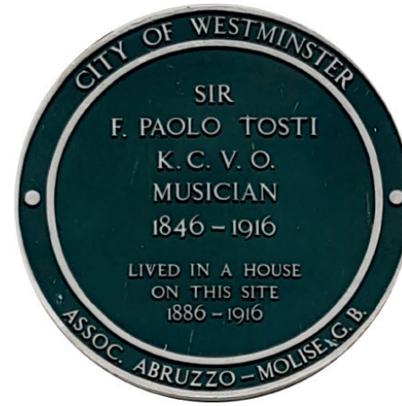
12 Mandeville Place’in duvarında Tosti’nin anı plaketi