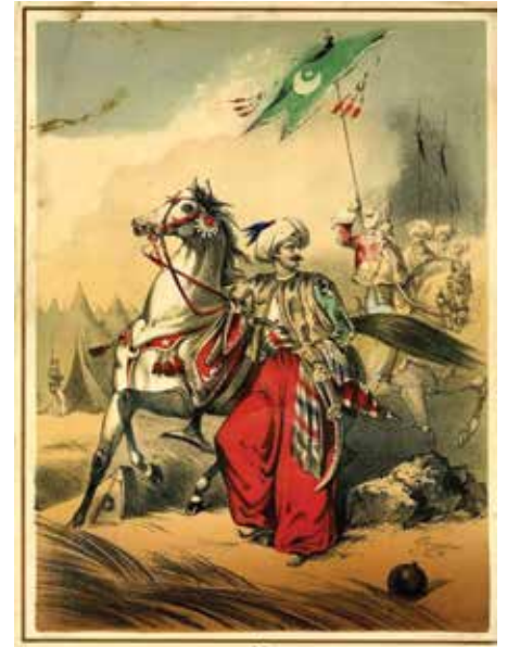
Eugen d'Albert'in babası Charles d'Albert'in bestesi Sultan'ın Polkası