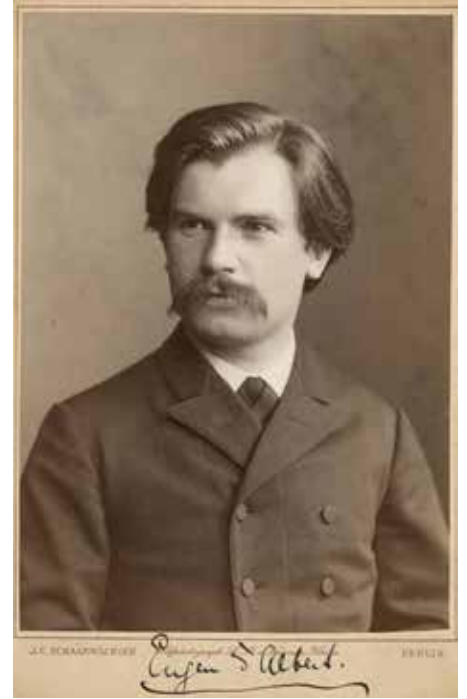
Besteci ve piyanist Eugen d'Albert