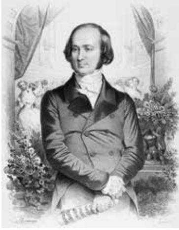
Fransız Strauss olarak da bilinen Isaac Strauss (Antoine Maurin'in çizimi)

III. Napolyon, kaplıcaların şifalı sularından faydalanmak için Vichy'e ilk olarak 1861'de geldiğinde kendisini ağırlamak için bulunan en uygun yegâne evin bir müzisyene ait olması ise son derece enteresan. Bu müzisyen tarihte Fransız Strauss olarak bilinen, valsler ve polkalar bestecisi ve orkestra şefi Isaac Strauss (1806-1888) idi. Ömer Eğecioğlu'nun Müzisyen Strausslar ve Osmanlı Hanedanı kitabında titizlikle anlattığı gibi Sultan Abdülmecid'e Constantinople