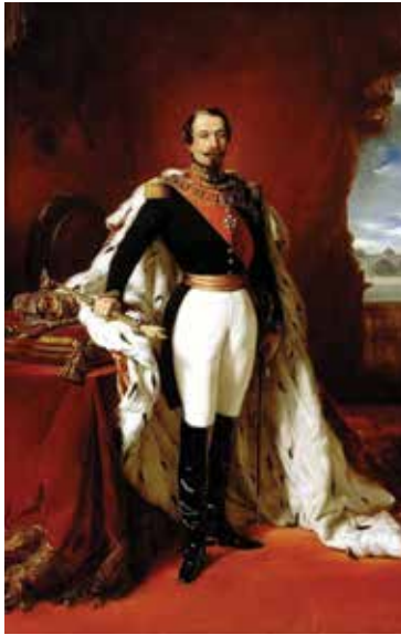
Vichy'nin imarını gerçekleştiren III. Napolyon (Ressam: Franz Xaver Winterhalter)

polkasını ithaf eden ve notalarını Padişah'a hitaben yazdığı bir takdim mektubuyla birlikte Sadrazam Mustafa Reşit Paşa aracılığıyla 1849'da İstanbul'a ileten Strauss'un, altı sene öncesinde Sardunya'ya gitmek için tesadüfen 1843'te geçtiği Vichy'den ayrılmak üzereyken, onun şehirde kalarak konser ve baloları idare etmesini isteyen bir grup hanımın bavullarını saklaması üzerine kaplıcalar şehrinde kalmaya karar vererek, 20 sene boyunca her yaz burada düzenli bir şekilde konserler vermesine ve Vichy'i bir eğlence merkezi olarak Avrupa haritasına yerleştirmesine sebebiyet vermişti.