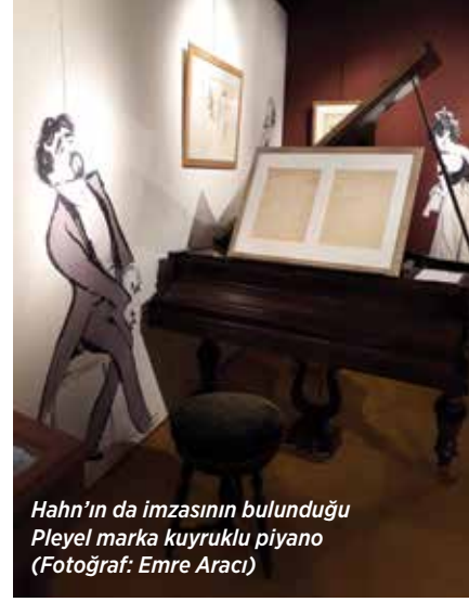
Hahn'ın da imzasının bulunduğu Pleyel marka kuyruklu piyano