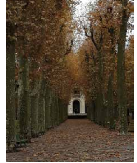
Parc des Sources'da sonbahar

resepsiyon salonlarından geçilerek ulaşılan yüksek tavanlı süit odalarıyla bu tarihi otelin ambiyansı, Reynaldo Hahn'ın davetine icabet için ziyaretçisine bundan daha anlamlı bir mekân sunamazdı. Üstelik yerleştirdiğim 501 numaralı odanın balkon kapısı tam da Vichy Operası'nın ve Parc des