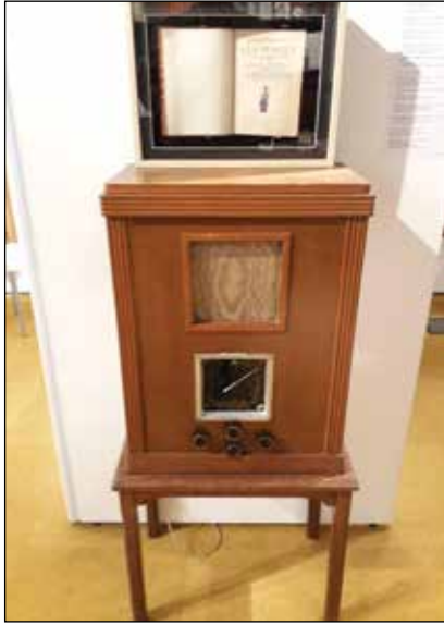
Reynaldo Hahn'ın radyosu

Massenet, Charles Gounod ve Camille Saint-Saëns'in da öğrencisi olacaktı. Konservatuvar arkadaşları arasında ise Alfred Cortot ve Maurice Ravel gibi isimler göze çarpıyordu. 1888'de Victor Hugo'nun şiiri üzerine bestelediği "Si mes vers avaient des ailes" şarkısı Le Figaro tarafından yayımlanıp büyük beğeni kazanınca Hahn'ın bir şarkı bestecisi olarak kariyerini ortaya koyacağı da anlaşılabilir oluyordu. Dalgalı piyano akompanyeleri,