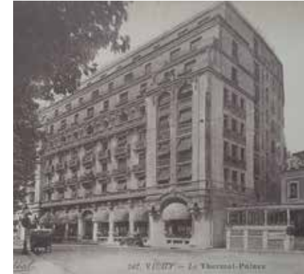
Eski bir kartpostalda Aletti Palace Oteli (sağda Isaac Strauss'un evi)

Seneler sonra Strauss'un villası olduğu gibi korunarak Aletti Palace Oteli'ne bağlanmış, önündeki veranda ise otelin lokantası olmuştu. Vichy'de müzik, tarih ve gastronomi gerçekten de iç içe geçmişti.