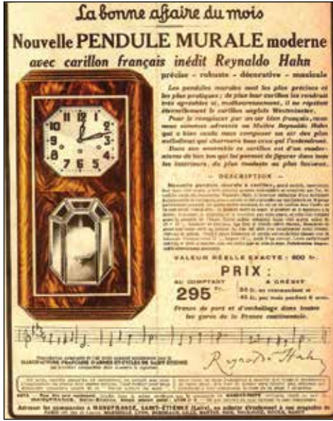
Hahn'ın müziğini bestelediği saat (Musée de l'Opéra de Vichy)

edilen matbu ve el yazması nota, mektup, kitap ve fotoğraf kadar besteciye ait ve bugün yeğeni Eva de Vengohechea'nın koleksiyonunda bulunan orijinal mobilyaların da burada yer alıyor oluşu idi. Unutulup giden, kaybolan bir yaşam, Jean-Yves Patte'in küratörlüğünde, belgelerle olduğu kadar, objelerle de bu sergide yeniden bir araya getirilerek hayata geri döndürülmüş oluyordu. Nitekim Hahn'ın siyah beyaz fotoğraflarında gördüğüm, Paris'teki dairesinin bir köşesinde duran o eski yazı masası, müzede yeniden canlandırılan mizansende karşımda aynen duruyordu.