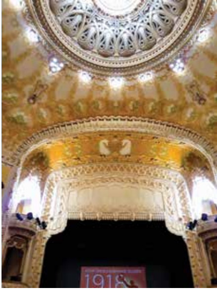
Vichy Operası'nın içi