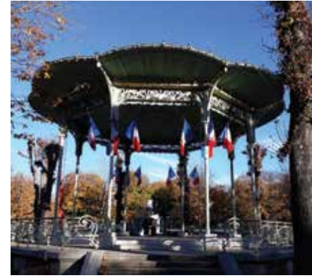
Vichy Parkı'nda Art Nouveau bando sahnesi

İstanbul'a da 1906'da gelmiş olan ve hatta Andante'de çıkan önceki birkaç yazımda bu seyahatine de değinmiş olduğum Hahn, 1909'da Fransız vatandaşlığına geçmişti. I. Dünya Savaşı patlak verdiğinde aslen Venezuela doğumlu olmasına rağmen Fransa için çarpışmaktan kaçınmamış ve Fransız ordusuna yazılarak rütbesiz er olarak cephede savaşmıştı. Hatta bu zaman içerisinde Robert Louis Stevenson'un şiirleri üzerine bir dizi şarkı dahi bestelemeyi başarmıştı. Ancak savaş bitiminde hayat normale dönmüş gibi gözükse de Hahn'ın eserlerinde ruh