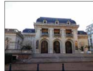
Vichy'nin 1901'de açılan Art Nouveau operası

1907'de inşa edilmişti. 1901'de Vichy'nin uzun süredir kapasitesi yetersiz bulunan Casino Tiyatrosu'na kardeş olarak, 1400 kişi kapasiteli Art Nouveau mimarisinde, eski binaya yapışık, yepyeni bir opera binası daha eklendi. Günümüzün Vichy Operası işte mimar Charles le Coeur'un inşa etmiş olduğu bu Belle Époque devri yapısından oluşmakta; III. Napolyon'un eski tiyatrosu ise artık kongre salonu olarak hizmet vermekte.