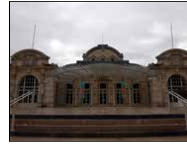
Napolyon devrinde inşa edilen Vichy'nin Casino Tiyatrosu

Tauzin'in resmettiği Casino Tiyatrosu da III. Napolyon'un Vichy'i Avrupa'nın kaplıcalar merkezi hâline getirme arzusunun bir uzantısı olarak, Casino de Vichy adı altında İngiliz mimar Charles Badger tarafından inşa edilmiş ve kapılarını 2 Temmuz 1865'te açmıştı. Zira çoğunluğu aristokrat ve soylu ziyaretçilerden oluşan bu şifalı suların müdavimleri akşam olunca da ruhlarını eğlenceye teslim etmek arzusundaydılar. Burada düzenli olarak konserler ve balolar verilmeye başlanmış ve aynı zamanda Parc de Sources olarak bilinen ve tiyatronun kuzeyinde yer alan simetrik park da tanzim edilmişti. Casino Tiyatrosu'nun parka bakan cephesinin girişini bugün de yerli yerlerinde durduğu gibi dört mevsimi anlatan dört karyatit süslemekteydi; buradaki verandanın Art Nouveau camekân tentesi ise