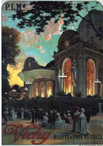
Louis Tauzin'in fırçasından eski bir afişte Vichy'nin Casino Tiyatrosu

güneşin, belki de kendi devirlerinin güneşi olduğundan habersiz bir hâlde betimlenmiş oldukları ve sadece bir afiş için tasarlanmış olan o harikulâde tablo