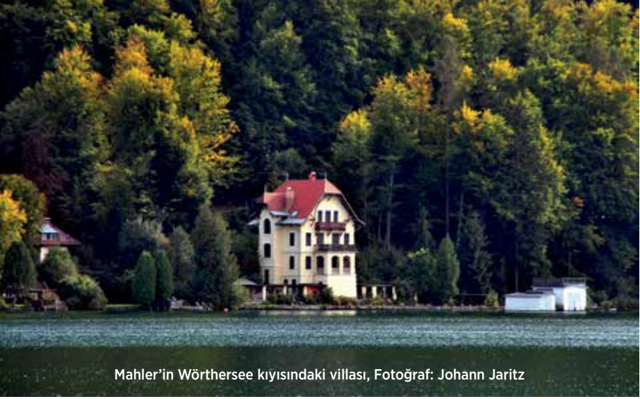
Mahler'in Wörthersee kıyısındaki villası, Fotoğraf: Johann Jaritz

cek nesiller için kaleme almış ve bildiği insanlar kendisini dışlarken görmediği kuşaklar onu seneler sonra içselleştirmiştir. Bu görüş, kendine gerçekten güvenen ve ruhunun derinliklerinde dünyaya gelmeyi bekleyen orijinal bir ses taşıdığına inanan her besteciye veya besteci adayına ilham kaynağı olmalıdır.