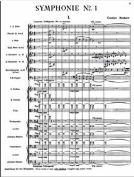
Mahler'in 1. Senfonisi'nin açılışı

sırada iki kısımdan oluşan beş bölümlü bir senfonik şiir olarak besteledi. Sonradan ikinci bölüm olan Blumine başlıklı Andante'yi çıkartacak ve eser bugün bilindiği hâliyle dört bölümlü bir senfoniye dönüşecekti. Senfonik şiirin ilk seslendirilişi Mahler'in kendi idaresinde 20 Kasım 1889'da Budapeşte'deki Vigado Konser Salonu'nda gerçekleştiğinde eser dinleyici tarafından pek de sıcak karşı-