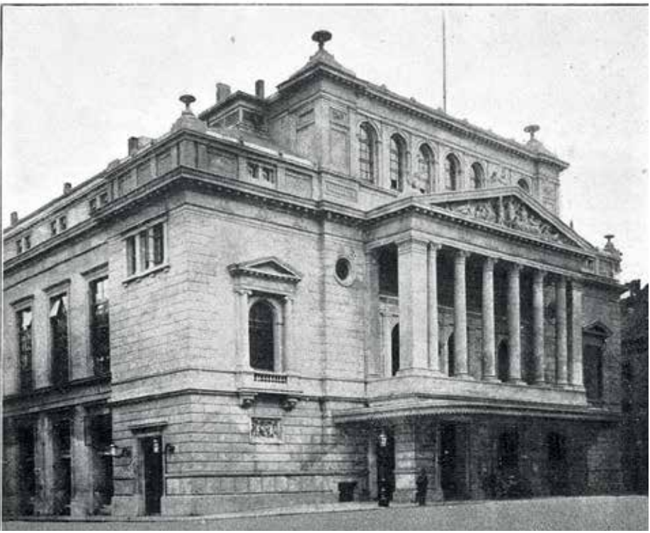
Mahler'in Eugene Onegin 'i idare ettiği Hamburg Operası

ve şefin adını da parantez içinde vermişti: “ Mahler ” Ancak Mahler’in en çok hayranlık beslediği Çaykovski operası 1902’de Viyana prömiyerini idare ettiği Maça Kızı idi ve hatta Inna Barsova’nın The Mahler Companion ’da tematik örnekleriyle gösterdiği gibi Maça Kızı ’ndan Herman’ın birinci perde sonundaki “ Prosti, nyebesnoye sozdanye ” ariasında duyulan aşk temasının yankıları 4. Senfoni’nin üçüncü bölümünde ve 5. Senfoni’nin Adagietto ’sunda duyuluyordu.