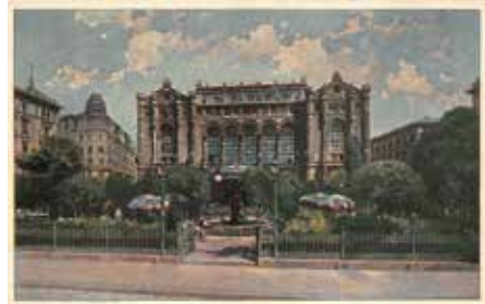
Titan Senfonisi 'nin prömierinin gerçekleştiği Budapeşte'deki Vigado Konser Salonu

sırada iki kısımdan oluşan beş bölümlü bir senfonik şiir olarak besteledi. Sonradan ikinci bölüm olan Blumine başlıklı Andante'yi çıkartacak ve eser bugün bilindiği hâliyle dört bölümlü bir senfoniye dönüşecekti. Senfonik şiirin ilk seslendirilişi Mahler'in kendi idaresinde 20 Kasım 1889'da Budapeşte'deki Vigado Konser Salonu'nda gerçekleştiğinde eser dinleyici tarafından pek de sıcak karşı-