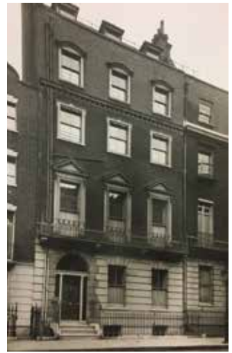
Eski bir fotoğrafta Berlioz'un Londra adreslerinden 27 (58) Queen Anne Street

dahil, bir dizi konser idare etti. 1831'de kapılarını ilk olarak açan Exeter Hall ne yazık ki 1907'de yıkılarak yerine bugün de hâlâ ayakta duran Strand Palace Otelini inşa edilecekti. 1853'te ise Berlioz, Covent Garden'da 25 Haziran akşamı Benvenuto Cellini operasını idare etti. Kraliçe Viktorya ve Prenses Albert'in de katıldığı temsilde bir grup rakip İtalyan müzisyenin ışıklarla yaptıkları protestolar Berlioz'un neşesini kaçırmış ve operasının Londra prömiyerini tam anlamıyla bir fiyaskoya dönüştürmüştü. Berlioz Londra'ya son olarak 1855'te geldiğinde, 13 Haziran akşamı, yine her zaman olduğu gibi Exeter Hall'da orkestra karşısında podyuma çıktığında bu defa dinleyiciler arasında salonda Richard Wagner de vardı. Programda ise Roméo et Juliette senfonisi ve Mozart'ın Sol Minör, 40. Senfoni'si yer almıştı. Birkaç gün sonra ise Wagner'in 25 Haziran'daki konserine bu defa Berlioz dinleyici olarak katıldı. Bu iki adamın Londra buluşmalarının başlı başına bir makale konusu olması gerektiğini düşünerek David Cairns'in İngilizceye tercüme ettiği ve takdim yazısında " Her şeyin üstünde bu eser yaratıcı dürtüleriyle saygın bir yalnızlığa ulaşan, karmaşık ve