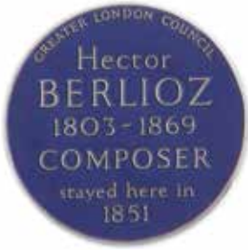
Berlioz için Queen Anne Street'teki anı plaketi