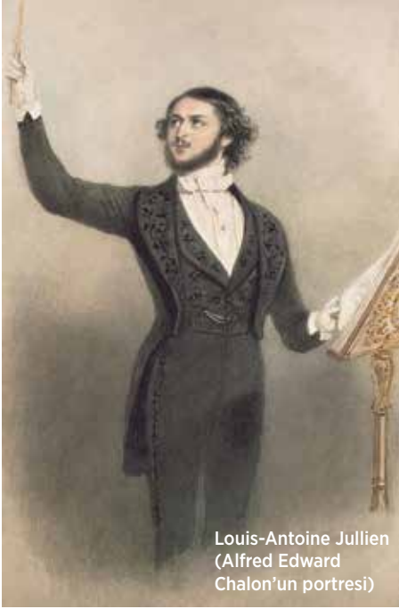
Louis-Antoine Jullien (Alfred Edward Chalon'un portresi)

Bu şarkı ironik bir şekilde bizleri her sayfasında tebessümle sürükleyen Mémoires 'a dönüşecekti. Berlioz her gerçek sanatçının yaptığı gibi şartlar ne olursa olsun dehasını kullanarak kendisine yaratıcı anlamda yine de bir çıkış yolu bulmuştu. Üstelik Londralı müzisyenler kendisinden hiçbir maddi talepte bulunmadan 29 Haziran'da Haydn'ın da konserlerini verdiği Hanover Square Rooms'da kendi bestelerinden oluşan bir program sunmuşlar ve Berlioz dört defa yapmak üzere sahneye tekrar tekrar geri çağrılmıştı. Hatıralarının dört bölümünü kaleme aldıktan sonra temmuz ayında besteci Fransa'ya geri döndü.