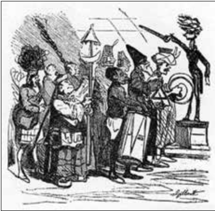
Cham'ın karikatüründe Berlioz idaresindeki orkestra (Le Charivari, 25 Kasım 1855)

Fransız besteci Londra'ya 1852, 1853 ve 1855 yıllarında üç defa daha geri döndü. 1852'de Londra'nın konser salonlarından Exeter Hall'da, Beethoven'ın 9. Senfoni'si