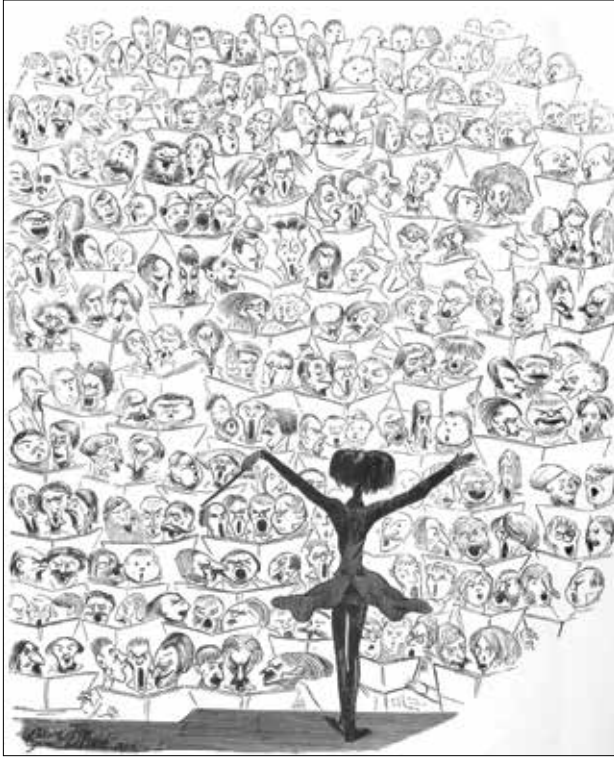
Gustave Doré'nin Te Deum 'unu idare eden Berlioz karikatürü, (Journal pour rire, 27 Haziran 1850)

olarak vardığında, ününe rağmen ciddi anlamda maddi sıkıntılar çekmekteydi ve o aralar Londra'da konserler düzenleyen Fransız emprezaryo, besteci ve orkestra şefi Louis-Antoine Jullien'in Drury Lane Tiyatrosu'ndaki opera ve konser sezonunda altı yıl boyunca şeflik yapma teklifini bu yüzden cazip bularak kabul etmişti. Berlioz'un Londra'da ilk idare ettiği eser Donizetti'nin Lucia di Lammermoor operası oldu.