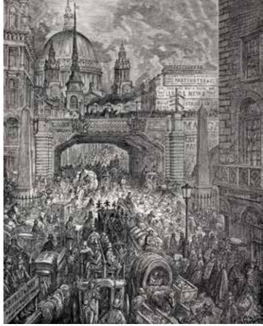
Gustave Doré'nin Ludgate Hill gravürü, Londra, 1872

hayatıyla önemli bir metropolisti; hatta 1851'de Journal des Débats 'daki bir yazısında "Dünyada Londra kadar müziğin tüketildiği bir başka şehir daha olduğuna inanmıyorum" diye yazmıştı. Ama onun için İngiltere'yi cazıp kılan bir başka özellik de burasının oyunlarını 1827'de keşfederek kendisine büyük bir hayranlık beslediği Shakespeare'in ülkesi ve Londra'nın da onun yaşamış olduğu şehir olmasından ötürüydü. Hatta meşhur İngiliz oyun yazarının adı Berlioz'un hatıralarında 73 defa geçtiği gibi 1828'de İngilizce dersleri almaya başlamasında da sebep olmuştu. Le roi Lear uvertürü (1831), Roméo et Juliette senfonisi (1839) ve son operası olan Béatrice et Bénédict (1862) hep bestecinin Shakespeare karşısında duyduğu hayranlık sonucunda hayat bulmuş olan eserleriydi. Berlioz Londra'ya ilk olarak 4 Kasım 1847'de Symphonie fantastique (1830) ve Harold en Italie (1834) gibi eserleriyle çoktan ünlenmiş bir besteci