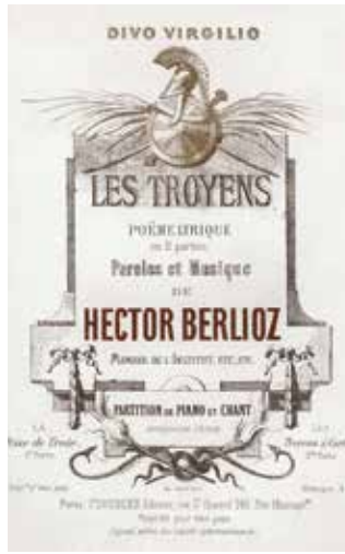
Les Troyens operasının partisiyonu