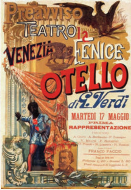
La Fenice'de Othello afişı