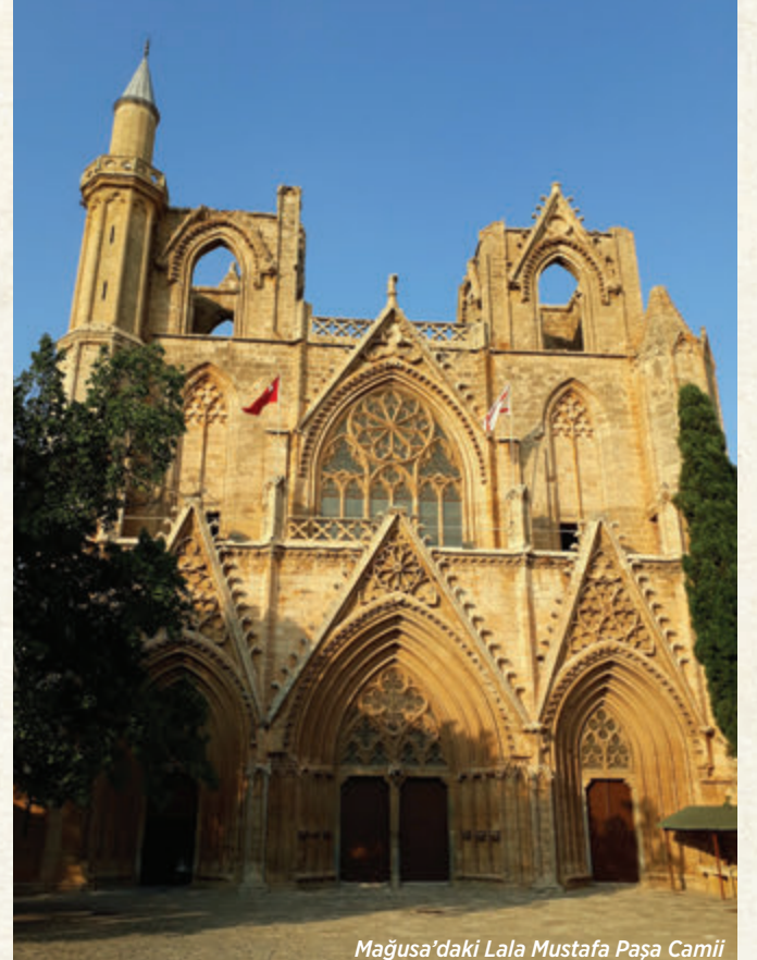
Mağusa'daki Lala Mustafa Paşa Camii