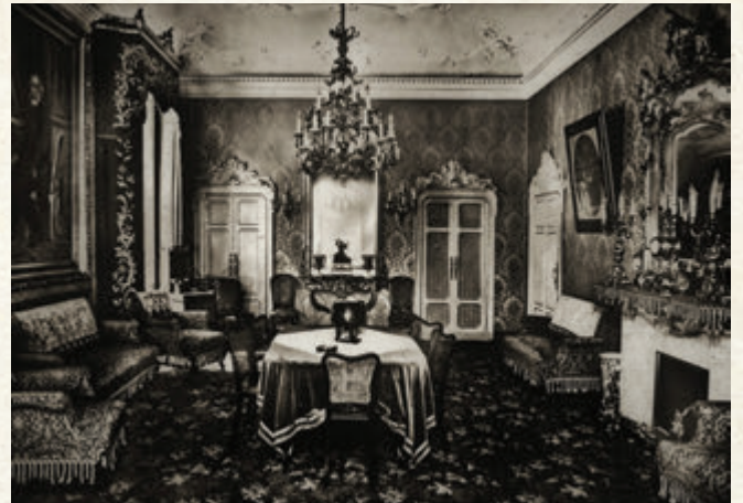
Grand Hotel de Milan'da Verdi'nin odası