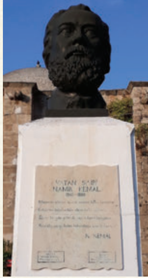
Mağusa'da Namık Kemal'in büstü

başka bir dünya arayışıyla buraları seçerler; ya da unutulmak için buralara yollanırlar; tıpkı, eski adıyla Famagusta olan, Mağusa'daki Venedik Sarayı'nın karanlık zindanında 1873-76 yılları arasında 38 ay sürgün ve hapis hayatı yaşamasının ardından Sultan V. Murad'ın iradesiyle serbest bırakılan Namık Kemal gibi. Seneler sonra anılarına dikilen büstlerin kaidelerindeki kendi mısraları yaşatmaya devam eder çekmiş oldukları kalp acılarının boyutlarını: