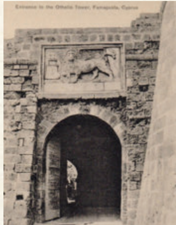
Eski bir karpostalda Otello Kalesi'nin kapısı ve kanatlı Venedik aslanı