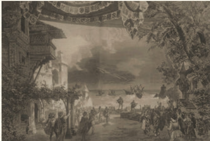
Otello'dan I. Perde; Mağusa Limanı

bestelememişti. Ancak besteci 1881'de Arrigo Boito'nun o yıllar üzerinde çalıştığı Otello librettosunu görmeye razı olmuş ve üç sene sonra Shakespeare'in trajedisini 71 yaşında bestelemeye başlamıştı. Opera 1885'te tamamlanıp, 5 Şubat 1887'de Milano'daki Teatro alla Scala'da ilk olarak