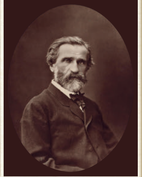
Verdi Othello operasını 1885'te tamamladı

İtalyan şair Giovanni Boccaccio'nun izinden giden ve Cinthio takma adıyla bilinen Giovanni Battista Giraldi'nin kaleme aldığı Un Capitano Moro (Kaptan Moro) hikâyesinden esinlenmişti. Belki de bu hikâyedeki kahramanın adının "Moro" (Moor) olması Shakespeare'i Venedik birliklerinin komutanı olan Otello'yu Mağrip kökenli bir Afrikalı olarak kurgulamasına sebebiyet vermişti. Oyunda işlenen ve her devir için geçerli olan kıskançlık, ırkçılık, aşk ve ihanet temalarıyla, Mina Urgan'ın da ifadesiyle, Shakespeare "aslında metelik etmeyen bir İtalyan öyküsünü bir başyapıtı" dönüştürmüştü. İngiliz şairin konusunu işlediği dönemde Kıbrıs henüz Osmanlı hegemonyasına girmemişti. Zaten oyunun başkahramanı Otello da bu yüzden bütün protestolara rağmen evleneceği sevgilisi Desdemona'yı yanına alarak aday