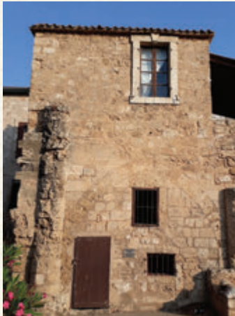
Mağusa'da Namık Kemal zindanı

O kelimelere şekil veren insanoğlu gibi o acıyı çektiren de insanoğludur esasında ve fotosentez döngüsü gibi bu süreç asırlar geçse de, oynanan oyunların kahramanları, boyutları, replikleri değişse de, retorik farklı farklı tonlarda dönüp durur ve dönmeye de devam edecektir. O hisler kimi zaman bir şiire konu olur, kimi zaman bir tiyatro eserine ve oradan da bir operaya dönüşür. Kimi zaman hiç beklenmedik bir