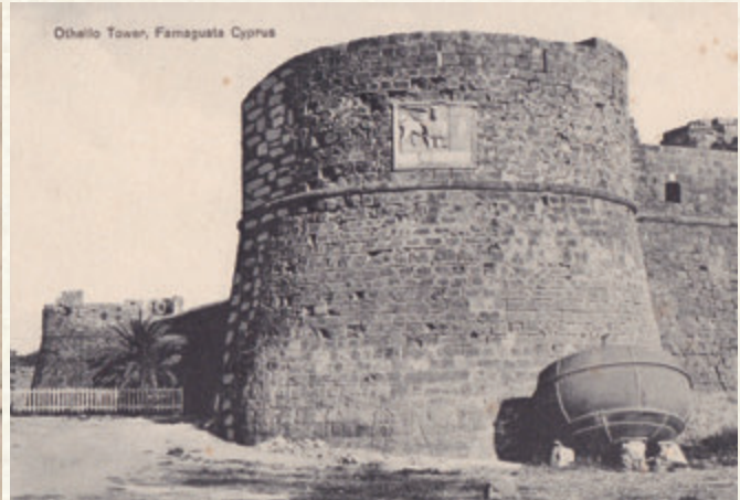
Eski bir karpostalda Otello Kalesi, Mağusa