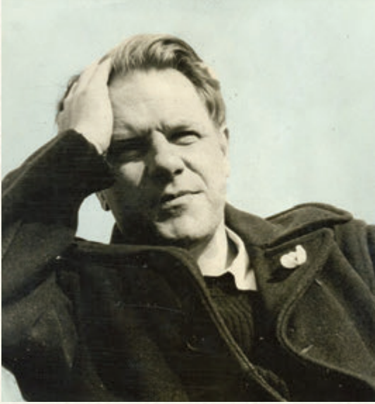
İngiliz yazar Lawrence Durrell