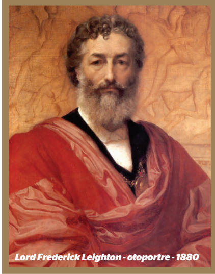
Lord Frederick Leighton - otoportre - 1880

devamındaki bir başka haber ise 114 sene sonra bu makalemin konusunu huzurlarınızda açarken esasında Londra'da zaman değişse de ne kadar çok şeyin yerli yerinde durduğunu bizlere gösteriyor. Daily News Sir Hubert Parry, Joseph Joachim ve Otto Goldschmidt'in merhum ressam Lord Frederick Leighton'un (1830-1896) evindeki stüdyosunda oda müziği konserleri düzenlenmesi için başlatılan proje girişimine destek vermeye karar vermiş bulunmakta olduklarını ve en kısa sürede Holland Park'taki bu evde oda müziği konserlerinin hayata geçirilmesinin beklendiğini bildiriyor. 31 Mart 2014 akşamı Lord Leighton'un stüdyosunda Cihat Aşkın'ı dinlerken Parry, Joachim ve Goldschmidt'in desteklerinin olumlu sonuç verdiğini ve dahası bu kuvvetli geleniğin Leighton House'un ruhu besleyen ortamında hâlâ devam ettiğini mutlulukla yaşıyor, duyuyor ve hissediyorum.