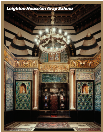
Leighton House'un Arap Salonu

Zamanında Royal Academy'nin de başkanlığını yapan Lord Leighton'un hayatı Puccini'nin Rodolfo'sundan çok farklı bir ressam portresi ortaya koyuyor. Evi ise unvanına yakışır bir şekilde görkemli ve refah içerisinde üretirek yaratan bir sanatçının kimliğini, kişiliğini ve sanatsal değerlerini, bugün dahi onun bıraktığı şe-