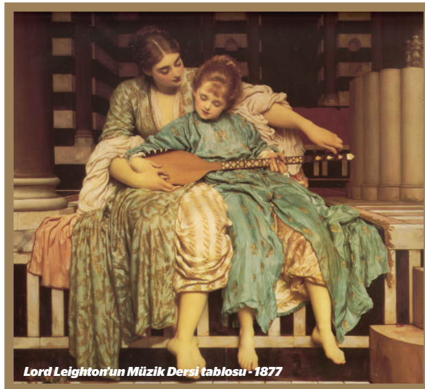
Lord Leighton'un Müzik Dersi tablosu - 1877

Talent Unlimited Vakfı hakkında daha fazla bilgi için: http://www.talent-unlimited.com/