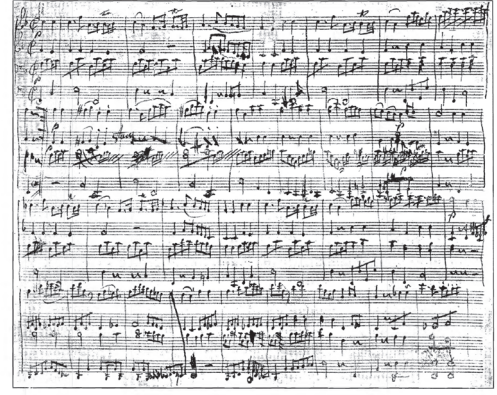
Facsimile of first page of an unpublished Gavotte for four hands by Beethoven

The present edition of an unpublished gavotte by Beethoven is due to investigations made in 1908 by Messrs. Georges de St. Foix and Théodore de Wyzewa with the object of establishing the authenticity of certain autograph manuscripts heretofore attributed to Mozart.