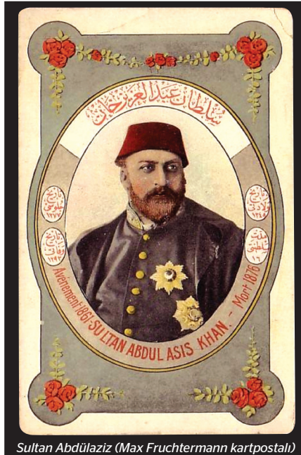
Sultan Abdülaziz (Max Fruchtermann kartpostalı)