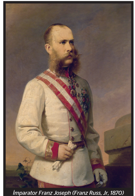
İmparator Franz Joseph (Franz Russ, Jr, 1870)