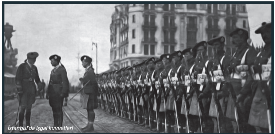
İstanbul'da işgal kuvvetleri