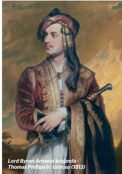
Lord Byron Arnavut kılığında - Thomas Phillips'in tablosu (1813)