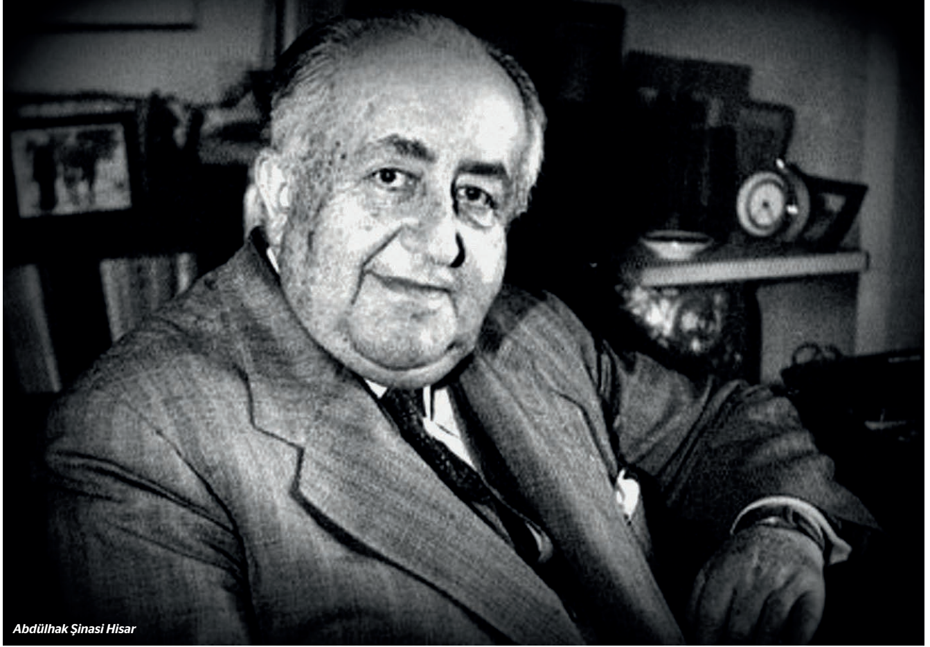
Abdülhak Şinasi Hisar