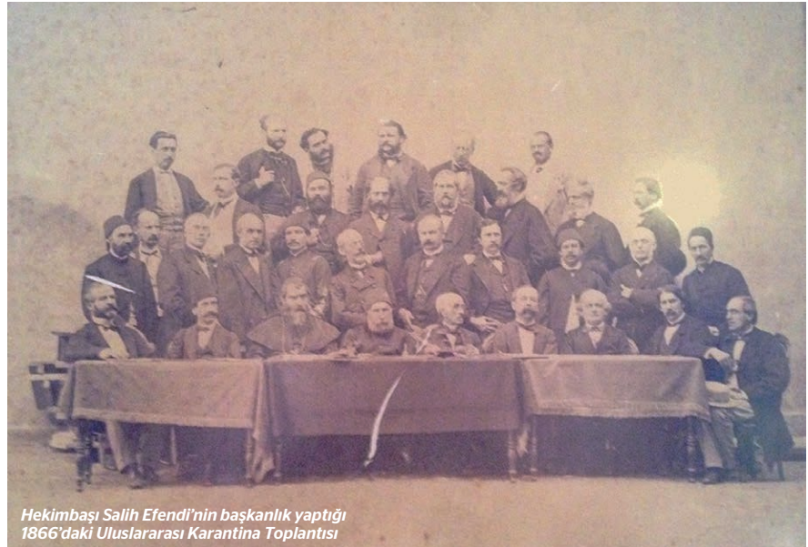
Hekimbaşı Salih Efendi'nin başkanlık yaptığı 1866'daki Uluslararası Karantina Toplantısı

diriyor. Konser, İstanbul doğumlu Berti Pisani'nin Una notte sul Bosforo (Boğaz'da bir gece) aryası ile devam ediyor. Guatelli'nin serenadına kıyasla, notası yine Londra'da ortaya çıkan Pisani'nin mehtap bestesi oldukça Verdi havasında bir aya olarak dikkat çekiyor. "Guarda guarda che bianca luna" (Bak bak beyaz aya) sözleriyle açılan eser bana Hisar'dan bu defa Boğaziçi Mehtapları 'ndan çok sevdiğim bir pasajı hatırlatıyor: "Aynı bir gümüş fanestan sızıyor gibi dökülen donuk ışığı güneşin maddiyatçı ziyası yerine bir mânevîyat âleminin nuru olur. Faaliyet ve hakikat ışığı güneş aydınlığı yerine, mehtap bir füsün ve hayal ve aşk ışığı döker ve gönülünden taşan bu ışıqla aydınlattığı herşeye biraz kendi huyunu aşılar". Bir zamanlar Dolmabahçe Sarayı Operası'nın müdürlüğünü yapmış olan Berti Pisani'nin bestelediği Rebecca operası La Scala'da 1865'te sahnelenmiş; ama ne yazık ki o da bu füsün ve hayal ışığı içerisinde bambaşka alemlerde yaşasa da