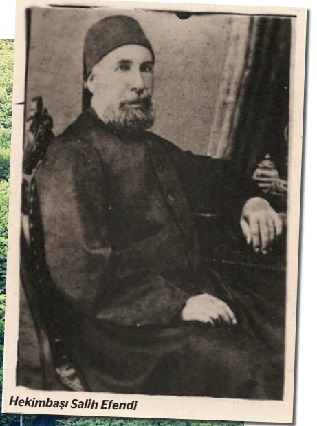
Hekimbaşı Salih Efendi