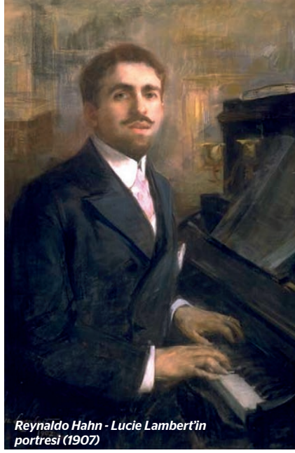
Reynaldo Hahn - Lucie Lambert'in portresi (1907)

Reynaldo Hahn'ın İstanbul'u ziyaret etmekte olduğunun haberi - Le Moniteur Oriental - 2 Mayıs 1906