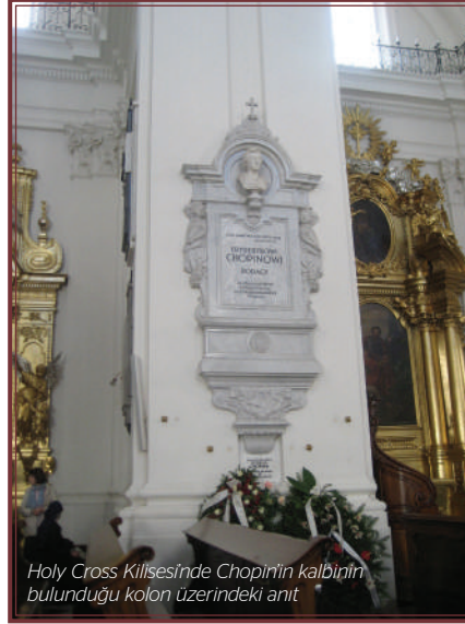
Holy Cross Kilisesinde Chopin'in kalbinin bulunduğu kolon üzerindeki anıt

olacaktır. II. Dünya Savaşı'ndaki tahribatın ardından orijinaline sadık olarak yeniden restore edilen bu mütevazı daireye ulaşmak için kara kalem eskiz çizen pek çok genç öğrencinin arasından geçip merdivenleri ikinci kata kadar çıkıyorsunuz. 1960'larda düzenlenen bu oda, Antoni Kolberg'in 1832'de yapmış olduğu orijinal bir resme sadık kalınarak döşenmiş, ancak Chopin'in yaşadığı daireden hiçbir mobilya ne yazık ki bugüne ulaşamamış. Yine de ziyaretçiye bestecinin dünyasına adım atma imkânı sağlıyor; örneğin pencereden dışarı bakarken, Chopin'in iki piyano konçertosunu bestelediği bu daireden kim bilir ne hülyalarla dışarı baktığını düşünüyorsunuz. Onu burada Tytus'a 27 Aralık 1828'de mektubunu kaleme aldığı anda aklından geçen düşüncelerle hayal ediyorsunuz: "Yukarıda benim için bir oda ayrıldı; gardrop odasından basamaklarla