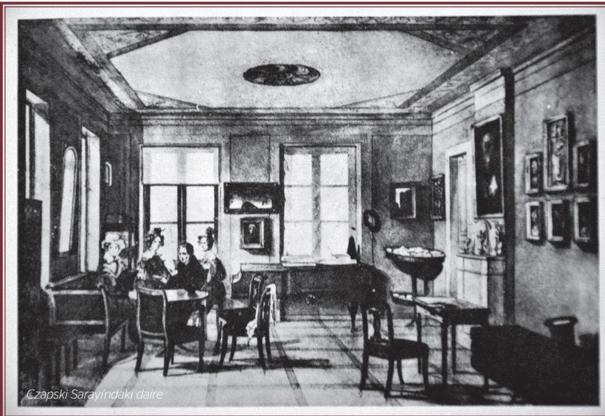
Czapski Sarayındaki daire

Okul Saxon Sarayı'ndan Kazimierowski Sarayı'na geçince Nicolas Chopin ve ailesi de bu saraya taşındılar. 1827'de ise bugün Güzel Sanatlar Akademisi olan Czapski Sarayı'ndaki daireye yerleştiler. Burası Chopin'in bir daha Varşova'ya geri dönmek üzere Polonya'dan ayrılmadan önce 3 yıl boyunca yaşadığı son adres