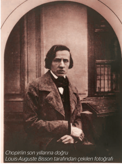
Chopin'in son yıllarına doğru Louis-Auguste Bisson tarafından çekilen fotoğrafı