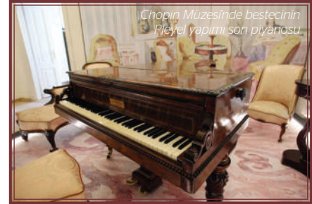
Chopin Müzesinde bestecinin Pleyel yapımı son piyanosu

Milletler böylesine asil bir şekilde bestecilerinin anılarını yaşatmaya devam ettikçe, bizler de böylesine heyecan veren mekânların mevcudiyetine adım atarak onların yaşamından kendimize tadlar bulabiliyoruz.