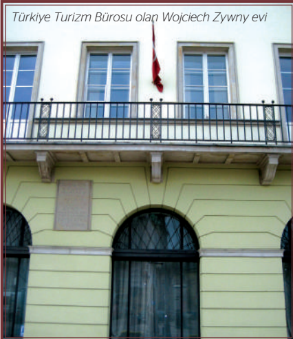
Türkiye Turizm Bürosu olan Wojciech Zywny evi

Müzik Üniversitesi'nin hemen yanındaki Varşova'nın tarihi Ostrogski Sarayı ise Chopin Müzesi'ne evsahipliği yapıyor. Burası bir bestecinin hayatı ve eserlerine ithaf edilmiş Avrupa'nın en yeni ve modern müzelerinden. Binanın beş katında Chopin'in hayatından kesitler interaktif bir şekilde ziyaretçilere anlatılırken, Paris'te yaşadığı son dairesinin canlandırıldığı ve orijinal Pleyel piyanosunun sergilendiği katta ise insan ayrı bir heyecan duyuyor. Chopin Müzik Üniversitesi ve TC Varşova Büyükelçiliği'nin davetiyle geldiğim Polonya'da Chopin'in izini sürerken belki de en heyecanla beklediğim an onun doğduğu köy olan Zelazowa Wola'ya yapacağım ziyaret. Chopin'in Edinburgh'da kaldığı 10 Warriston Crescent'teki dairede öğrencilik yıllarımda bir resital dinlemiş, 1848'de