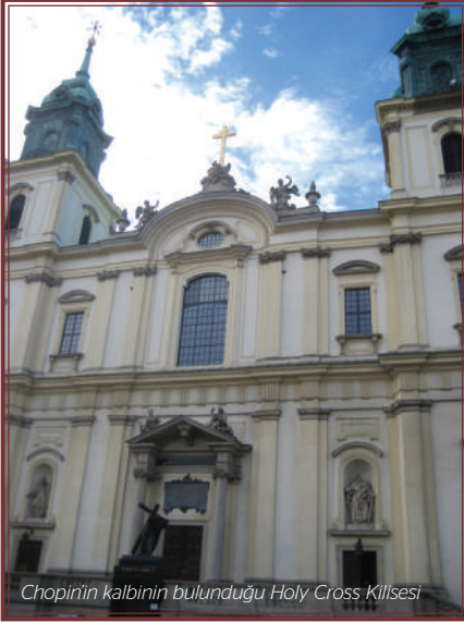
Chopin'in kalbinin bulunduğu Holy Cross Kilisesi