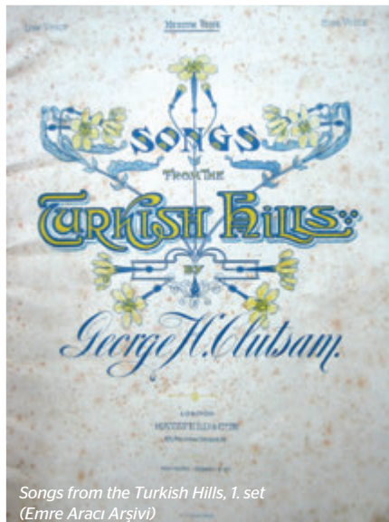
Songs from the Turkish Hills, 1. set (Emre Aracı Arşivi)