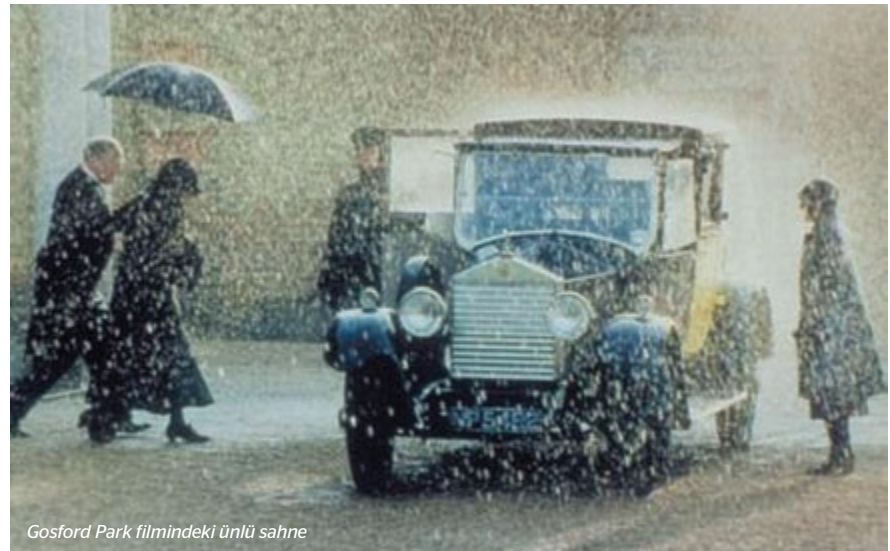
Gosford Park filmindeki ünlü sahne