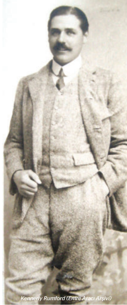
Kennerly Rumford

bu Şark albümünün içeriği suni katkı maddeleriyle renklendirilmiş bon bon şekerlemelerini andırır da Clutsam'ın "Abd-ul-Mejid" in sözlerine atfen yaptığı bu bestelerini bir kalemde silmemek gerekli. Zira bilhassa dördüncü sıradaki I know of two bright eyes (Myrra) şarkısı lirik melodik yapısıyla son derece dokunaklı. Hele bir de hoşrutlu eski bir taş plakta İrlandalı meşhur tenor John McCormack'ın sesinden insan bu şarkıyı dinleyince Clutsam'ın bilhassa bu beste-