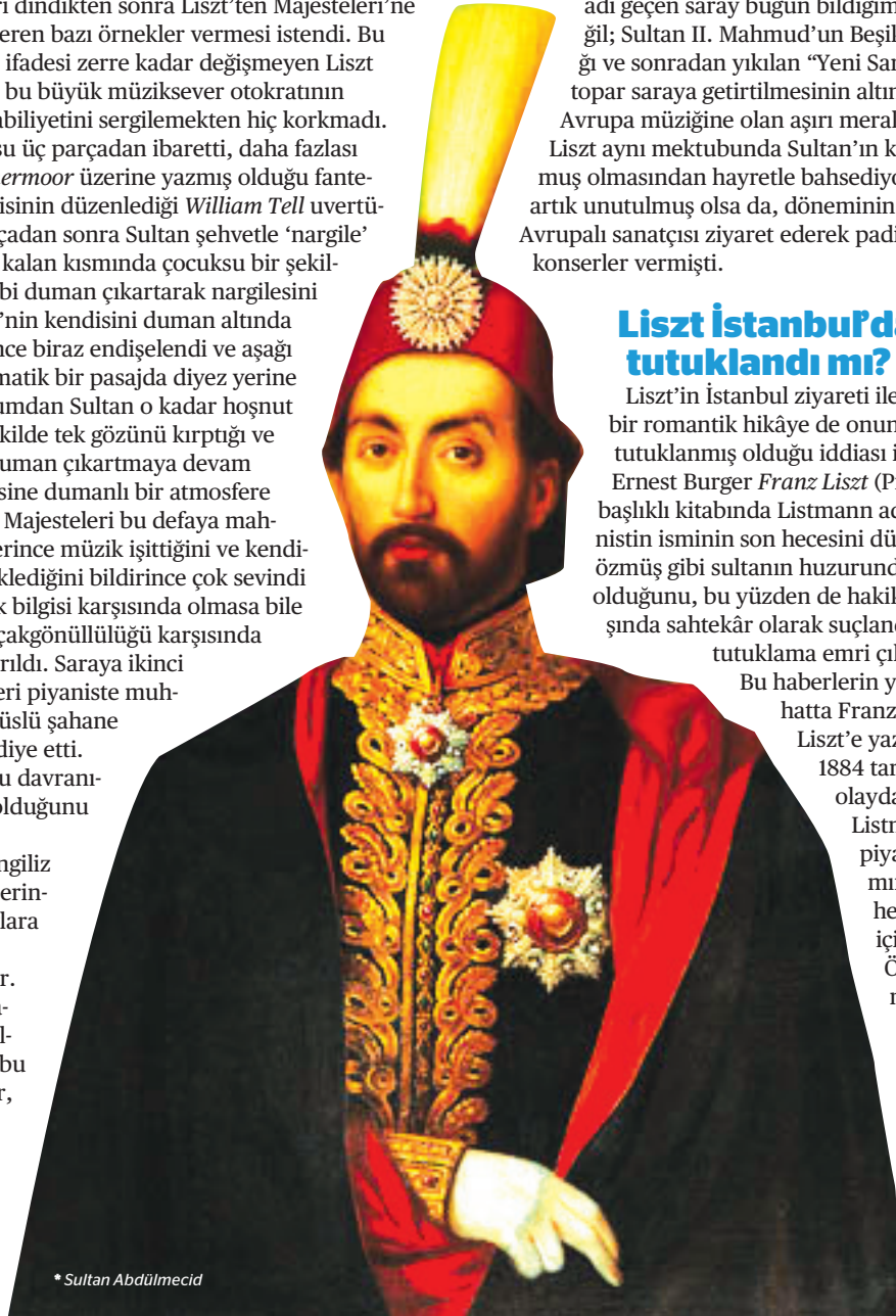
* Sultan Abdülmecid

Bu haberlerin yayıldığı doğrudur; hatta Franz Liszt, Henriette von Liszt'e yazmış olduğu 8 Şubat 1884 tarihli mektubunda bu olaydan "İstanbul'dayken Listmann adında bir piyanist konser programından isminin ikinci hecesini düşürdüğü için benden af diledi. Ödül olarak da o zamanki padişahın kendisine kıymetli bir hediye verilmişti" demektedir. Ayrıca 21 Şubat 1847 tarihli La Revue et Gazette Musicale de Paris dergisi de Listmann adında bir piyanistin sultan huzurunda beş saatlik bir