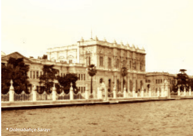
* Dolmabahçe Sarayı