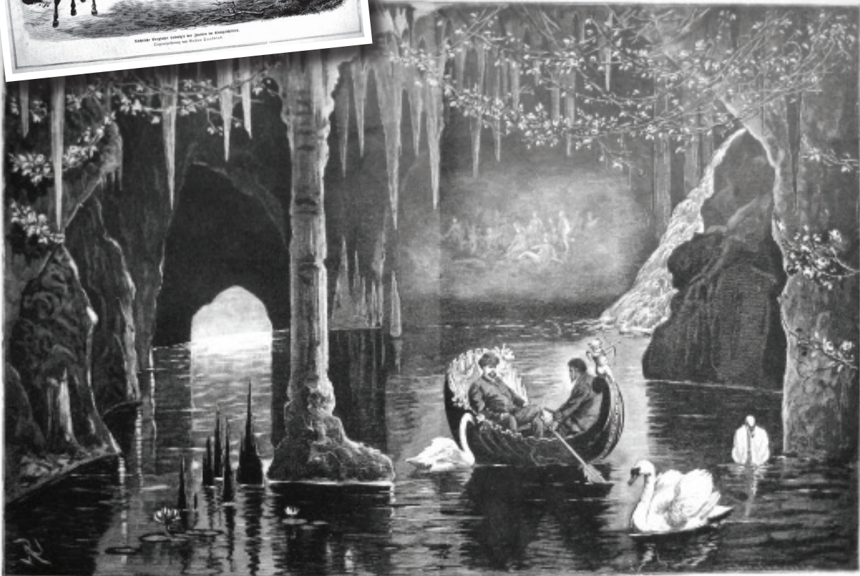
Die weiße Grotte im Linderhof.