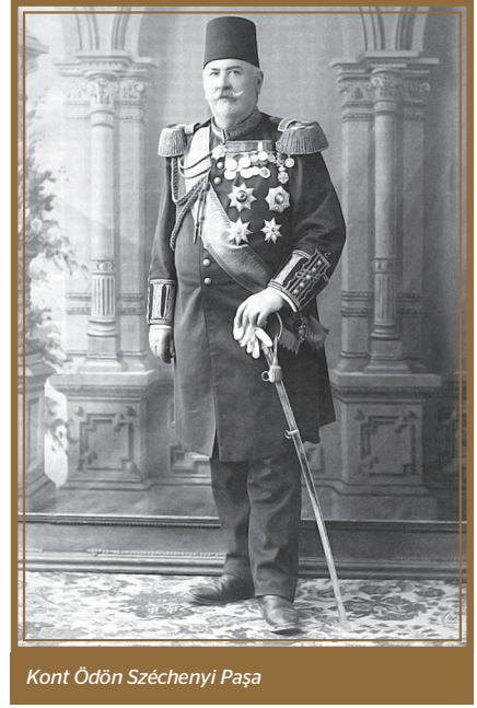
Kont Ödön Széchényi Paşa

korosunun bu unutulmuş konserleri, karşıma bu bağlantıları ortaya koyarken, Széchényi Paşa'nın babasının adını taşıyan Budapeşte'deki o meşhur zincirli köprüden bir sonbahar günü 'İmre' olarak geçtiğim günü hatırlıyorum.