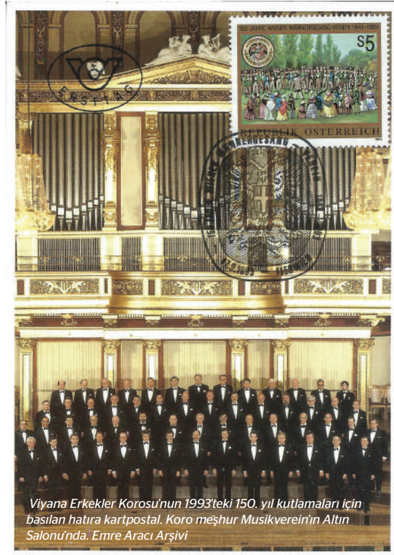
Viyana Erkekler Korosu'nun 1993'teki 150. yıl kutlamaları için basılan hatıra kartpostal. Koro meşhur Musikverein'in Altın Salonu'nda.

A nton Bruckner'in tamamlamış olduğu son bestesi Helgoland kantatını 50. kuruluş yılında kendilerine hediye ederek onurlandırdığı, Wagner'in Tänhauser 'indeki Hacılar Korosu'ndan bir kadansı ithaf ettiği, Johann Strauss'un Op. 333 Wein, Weib und Gesang Valsini 1869'da onlar için yazdığı meşhur Wiener Männergesangverein, yani Viyana Erkekler Korosu kırksekizinci yıllarında, 1891 senesinin Mayıs ayında İstanbul'a gelerek Sultan II. Abdülhamid'in Cuma selamlığında yabancı misafirlerin arasına katılarak, tören bitiminde padişaha Yıldız Sarayı'nda bir "serenad konser" sunmuşlardı. Şu kurmuş olduğum uzun giriş cümlesinde ilk bakışta çelişkilerle dolu gibi gözükse, inanılması güç o kadar ince detaylar var ki birbirinden ilginç belgeleri büyük bir tarih bilinci ve vasi heyecanı ile toparlayarak müze konağındaki özel arşivinde koruyan Hüseyin Hulki Birol'un