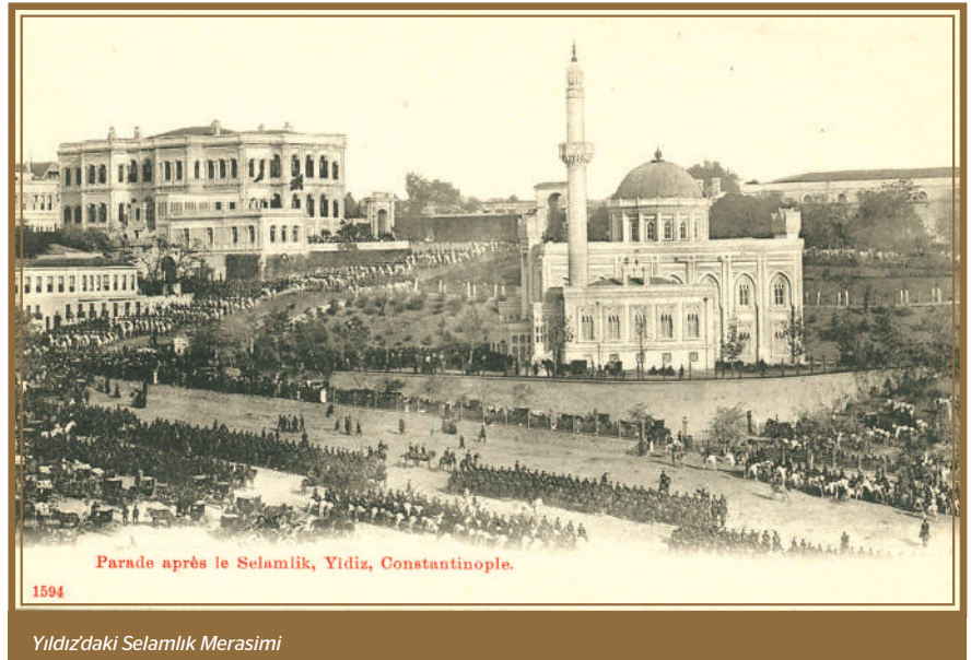
Parade après le Selamlık, Yıldız, Constantinople.

Not: Viyana Erkekler Korosu hakkında detaylı bilgi için: http://www.wienermaennergesangverein.at/home/ A