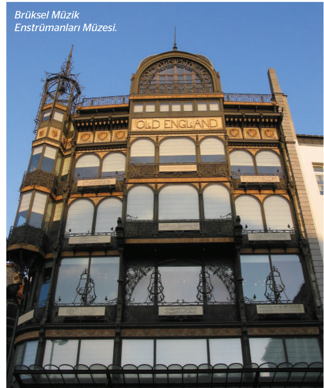
Brüksel Müzik Enstrümanları Müzesi.