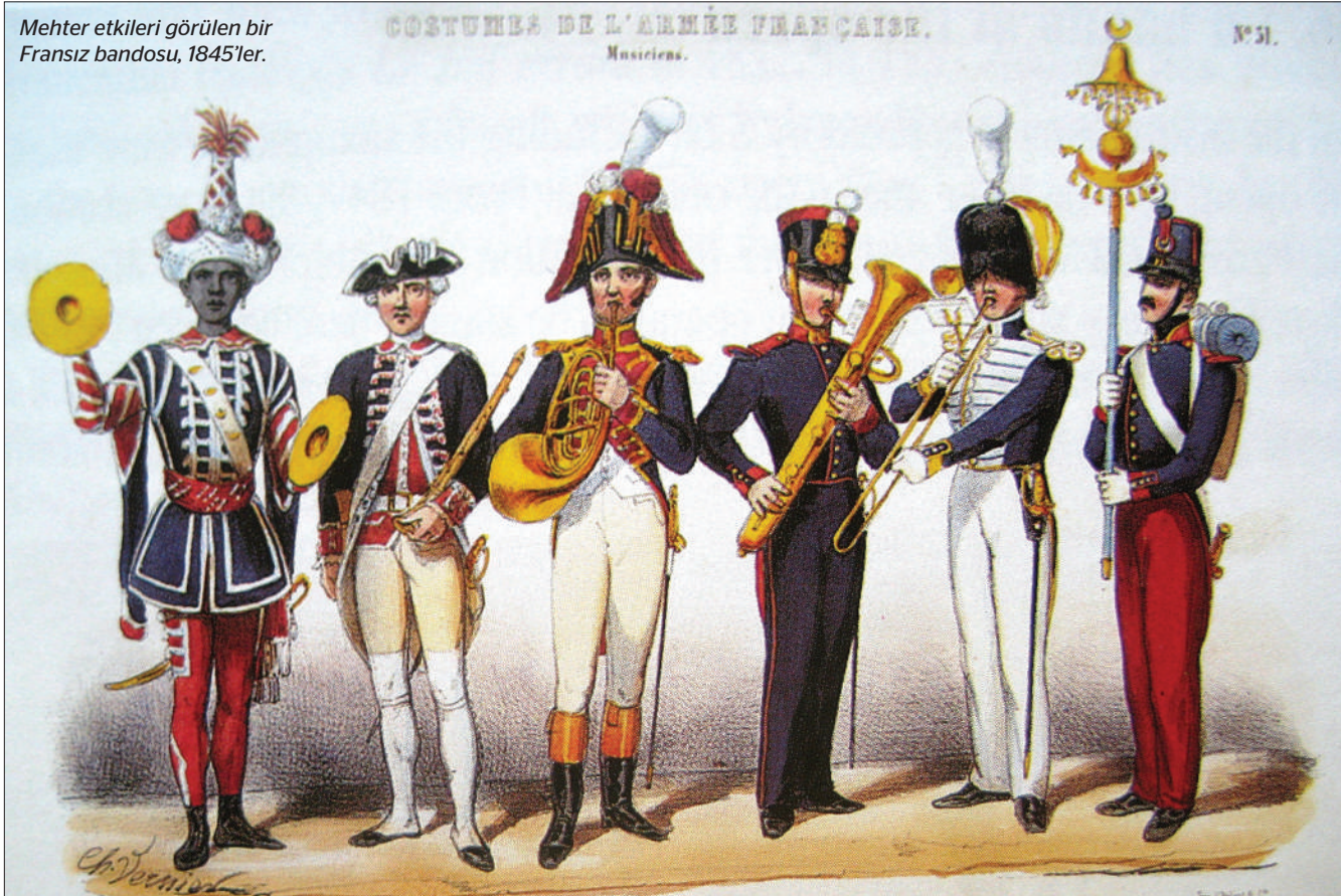
Mehter etkileri görülen bir Fransız bandosu, 1845'ler.

gücün yaratıcı kudretini o kadar hissettiriyor ki insana... Bir an sanki o trende koltuğuma mihlanmış bir halde gitmiyorum da, bir sanat galerisini süratle geziyormuş hissine kapılıyorum. O zaman eski bir kitapçıda bularak satın aldığım 1929 yılından kalma, 12 santime 10 santim ebadında, kenarı altın varaklı, sararmış küçük bir not defterine beğendikleri güzel şiir ve özlü sözleri kaydetmiş olan bir ailenin buraya düşmüş olduğu notları arasında okuduğum Edward Grey'in (Viscount