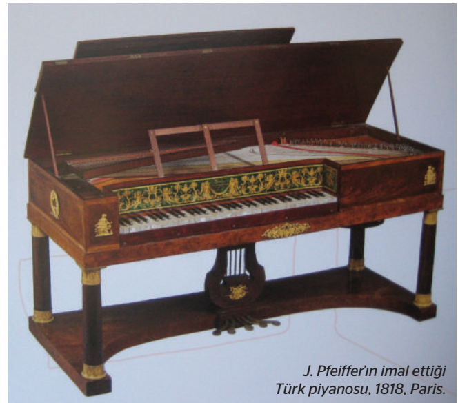
J. Pfeiffer’in imal ettiği Türk piyanosu, 1818, Paris.