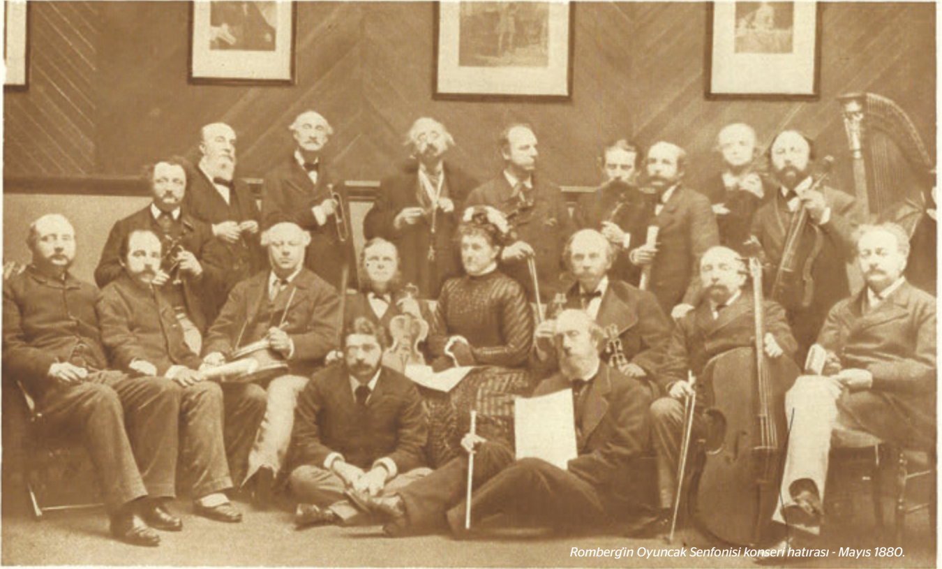
Romberg'in Oyuncak Senfonisi konseri hatırası - Mayıs 1880.