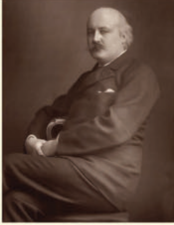
Sir Hubert Parry