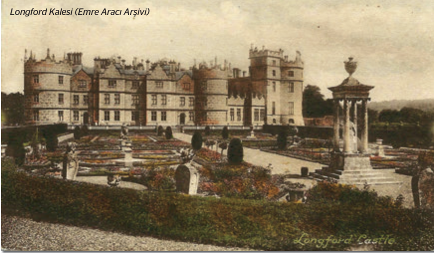
Longford Kalesi

gelen bir hanım orkestrasından bir hayli etkilenmiştir. Kendisi de böyle bir topluluk oluşturmaya karar vererek 1881'deki hayır konseri için 24 kişilik bir yaylı orkestra ve 24 kişilik bir koro bir araya getirir. St James's Hall'da verilen konseri, 15 sene Londra ve dışında üst üste verdiği konserler gibi kendisi idare eder. Bu konserler o kadar başarılı olur ki 1896'da son konserini idare ettiğinde toplulukta yer alan amatör sanatçıların sayısı 200'e ulaşmıştır.