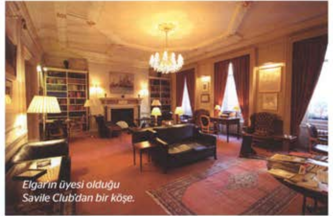
Elgar'ın üyesi olduğu Savile Club'dan bir köşe.

Giydiği üç parça tweed takımlar, beyaz kolalı gömlekler, kravat ve papyonlar, saçının kesimi, bıyığı ve duruşuyla bir kompozitörden ziyade Kral VII. Edward devri generallerini andıran Elgar'a çocukluğumdan beri belki müziğinden önce ilk olarak dış görünümünden ötürü ilgi duymuştum. O zamanlar İstanbul'da BBC Dünya Servisi'nin ara ara gidip gelen uzun dalga radyo yayınlarında onun müziğini işitirdim; hatta daha çocuk yaşında BBC'ye bir istek mektubu yazmış ve programda "İstanbullu bir dinleyici" şeklinde adım da okunarak onun birinci Pomp and Circumstance marşını çaldırtmıştım. O çocuk yaşında seneler sonra hayatımın büyük bir bölümünün onun ülkesinde yerleşik olarak geçeceğinden, Londra Okulları Senfoni Orkestrası üyesi olarak Meredith Davies'in idaresinde onun Frank Schuster'a ithaf ettiği In the South Uvertürü 'nü çalarken duyacağım mutluluktan, ya da şef olarak Londra'da idare ettiğim hayatımın ilk konserinin ilk eseri olarak onun Op. 20 Yaylı Çalgılar Serenadı'nı seslendireceğimden habersizdim. Savile Club'da işte bütün bu hisler bir anda üzerime gelmiş ve kendimi Malvern Tepeleri'nin eteklerinde bulmuştum.