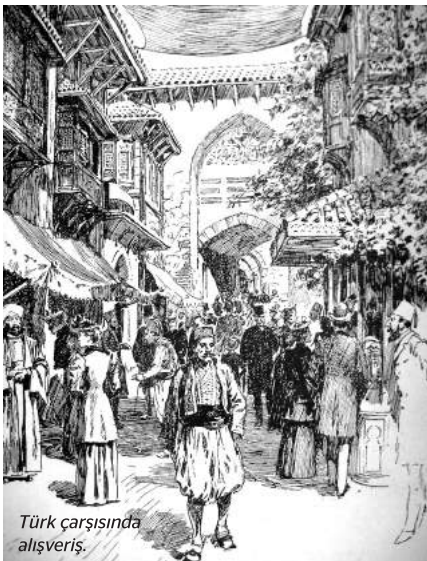
Türk çarşısında alışveriş.

Olympia'daki bu fantastik İstanbul canlandırmasının en çekici eğlencesi ise öğlen 13.30 ve akşamüzeri 18.00 olmak üzere günde iki defa tekrarlanan ve sayıları 2000'i bulan dev bir sanatçı kadrosunun rol aldığı inanılmaz boyutlarda büyük bir gösteriydi. Bir sene önce Olympia'da Venedik şehrinin benzer bir canlandırmasını gerçekleştiren Macar asıllı Imre Kiralfy'nin bu defa kardeşi Bolossy Kiralfy İstanbul gösterisinin yaratıcılığını üstlenmişti. Hayal ürünü bir hikâyenin ana hatları üzerinden tablolar halinde anlatılan bu bale, dans ve konser karışımı revüde zaman zaman "melodik", zaman zaman "dramatik" müzik çeşitlerine kuvvetli sesler de eşlik etmekteydi. Konu genç bir İngiliz asilzadesi olan Orleigh Dükü Harold'ın, her aristokratın eğitiminin bir parçası olduğu gibi, Avrupa'yı "Grand Tour" havasında dolaşarak Londra'dan İstanbul'a yaptığı bir yolculuk üzerine kurgulanmıştı. Böylelikle genç lordun seyahatinin her safhası yeni tablolar yaratıl-