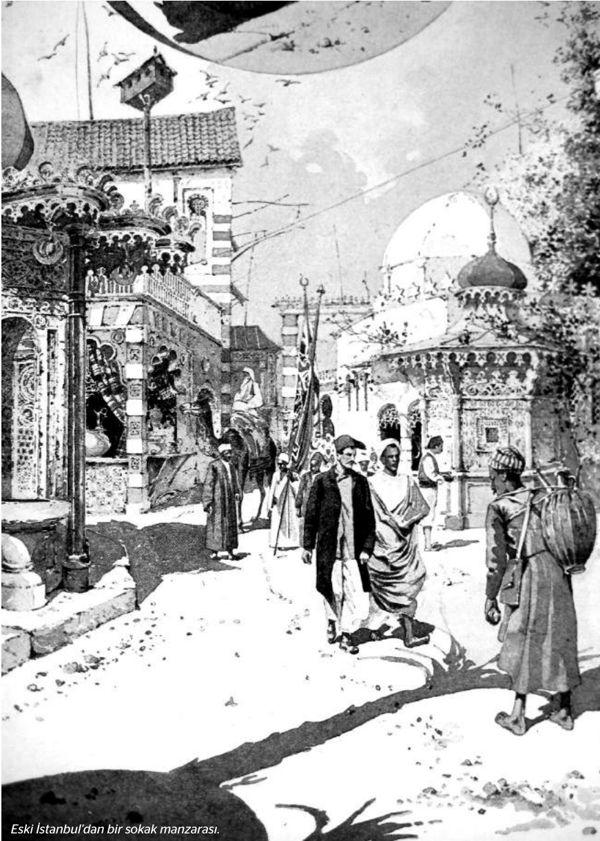
Eski İstanbul'dan bir sokak manzarası.

Londra, 1893 Noel'inde yabancı bir şehri yeniden inşa ederek insanlarını o şehrin sokaklarında gezdirmeye, yerel tatlarını tattırmaya, insanlarıyla tanıştırmaya hazırlanıyordu. Sararmış gazete sayfalarındaki haberler ve gravürlerde kalan bu devasa İstanbul canlandırmasının öyküsünü yazarımızdan dinleyelim.