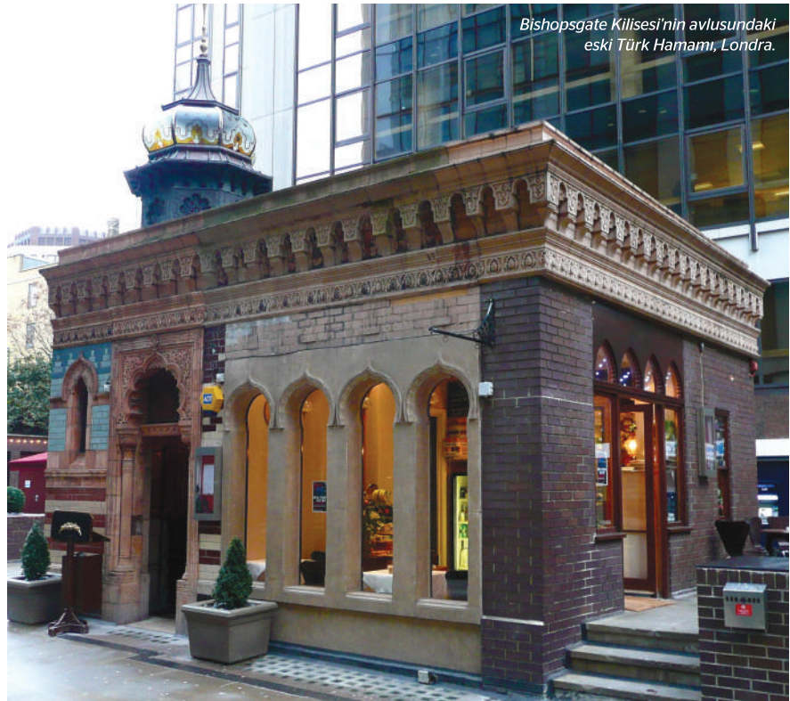
Bishopsgate Kilisesi'nin avlusundaki eski Türk Hamamı, Londra.