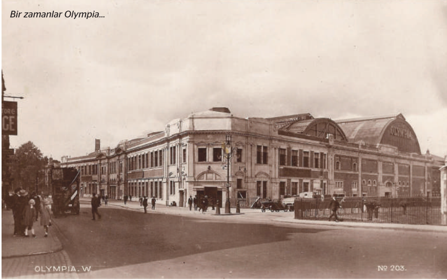
Bir zamanlar Olympia...