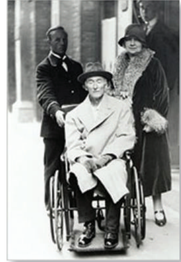
Frederick Delius, 1929.

İşte tarihin keyifli bağlantıları; dünyanın bir bütün olduğuna inanan insanların ortak paydayı evrenselliğin güzelliğinde, geçmişin unutulmadığı bir şuurla, tesadüflerin kattığı olumlulukla yaşama gayretlerinin bir uzantısı. Zaman zaman The Grand'in kapısında tekerlekli sandalyede Cennet Bahçesi 'ne doğru giden saç gümüş renkli, gri fötr şapkalı ve paltolu bir beyefendiyi görür gibi oluyorum, yürüyüşe çıktığım sabahlarımda; onların belleklerindeki mevcudiyeti işte huzur veriyor bizlere bu dünyada... A