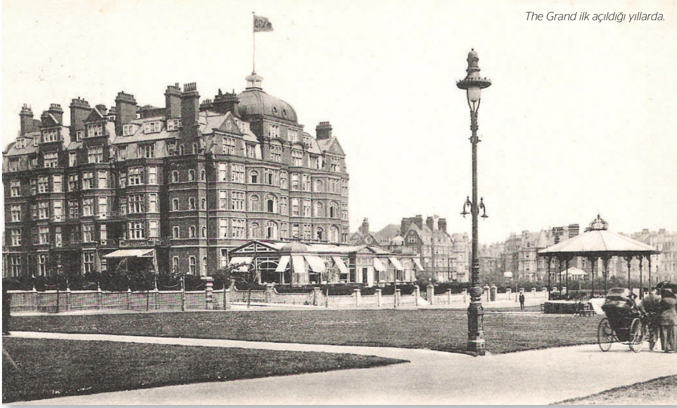
The Grand ilk açıldığı yıllarda.