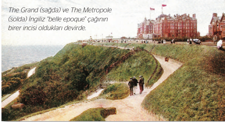
The Grand (sağda) ve The Metropole (solda) İngiliz "belle époque" çağının birencisi oldukları devirde.

bütün önde gelenleri tarafından rağbet edilir bir kurum haline gelmekte gecikmemiş. Cemekân "palm court" lokantasında sık sık yemek yiyen Kralı halk dışarıdan merakla takip ettiği için de otelin bu restoranı zamanla "Monkey House" yani "Maymun Evi" olarak anılmaya başlanmış. Önündeki tenteli platformda bandoların konser verdiği, geçmiş devir kibar sosyetesinin pazar yürüyüşlerine fon oluşturan bu iki zarif kardeş bina esasında "Edwardian" olarak anılan İngiliz "belle époque" çağının birer incisi gibi.