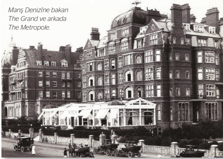
Manş Denizine bakan The Grand ve arkada The Metropole.