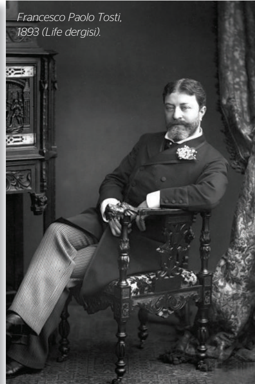
Francesco Paolo Tosti, 1893 (Life dergisi).