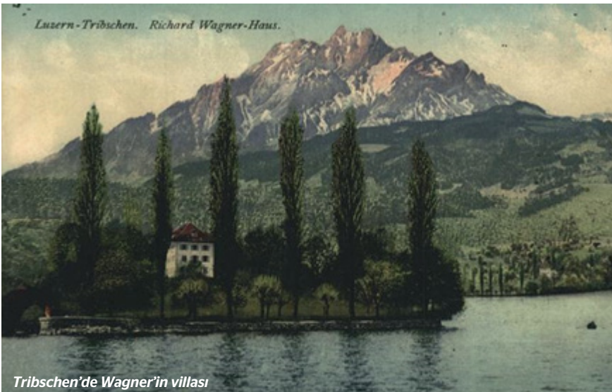
Tribschen'de Wagner'in villası

anlar geçirdiğim Prag'daki ilk senfonimin kaydı üzerinden daha henüz günler geçmişken, yaratılan besteler yoluyla hisleri ebedileştirerek, duygulara yeni bir formatta taze ömürler biçmenin ne demek olduğunu, kaydın bittiği gün olan 14 Şubat'ta, Vltava kıyısındaki Smetana heykelinin yanbaşımda uzakta şehre hakim duran kalenin silüetine karşı heykelli Charles Köprüsü'ne bakarak düşündüğümü çok iyi hatırlayıp Siegfried Idyll 'i kulaklarımda duyuyordum. Pera Palas'a ömrüm boyu defalarca girip çıktım ve hatta iki defa İstanbul'un bu müze otelinde konakladım; ancak o sabah bu tarihi binaya çok farklı bir amaçla giriyordum. Çantamdaki notalar ve notlar Pera Palas'ın hiç bilinmeyen bir dokusunu ortaya çıkartmak üzere biraraya getirilmişlerdi ve az sonra kalabalık bir topluluğa bu oteli seslerin