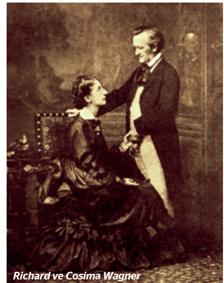
Richard ve Cosima Wagner