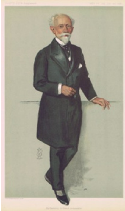
Fransız Büyükelçisi Paul Cambon (Vanity Fair, 2 Ekim 1912)