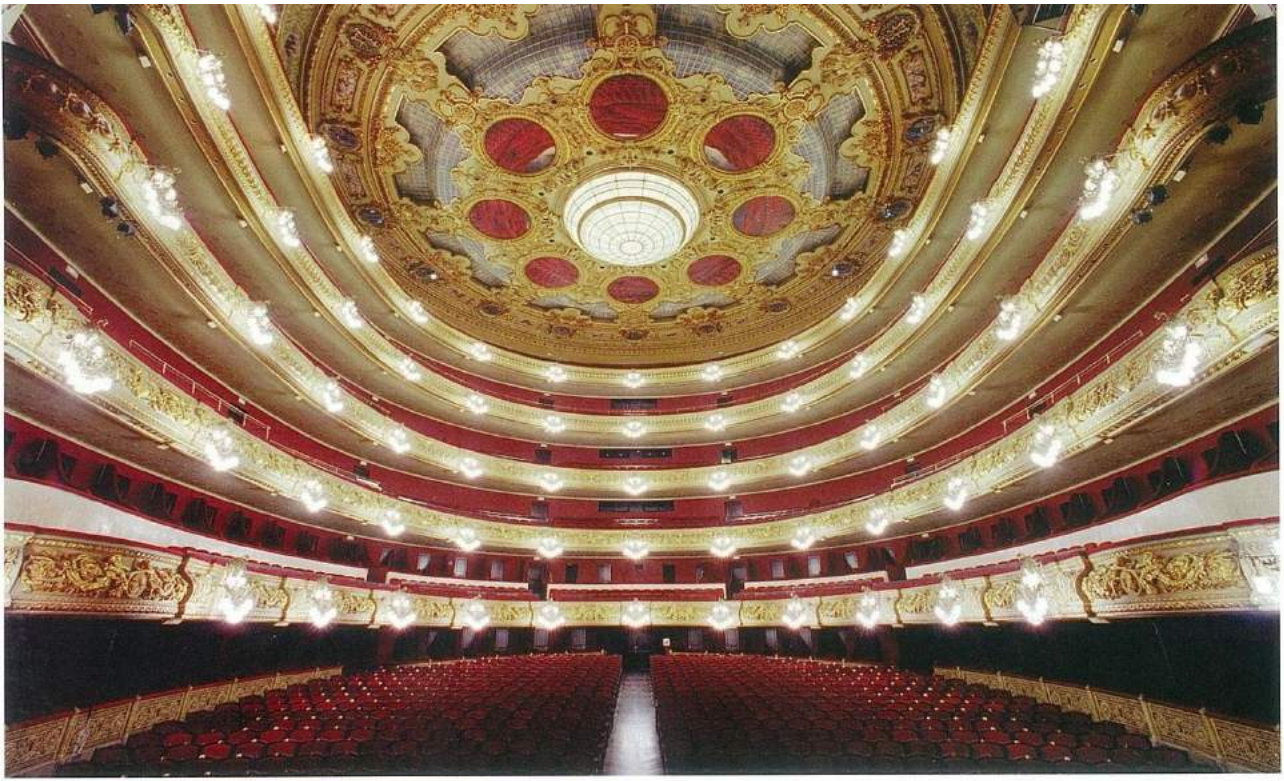
Gran Teatro del Liceu konser salonu, (© Antoni Bofill).