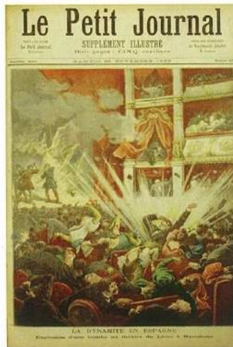
Gran Teatro del Liceu'nun bombalanması ile ilgili Le Petit Journal'ın kapağında çıkan haber.

Bütün ihtişam ve güzelliğine rağmen Liceu'da ziyaretçiyi hayal kırıklığına uğratan en