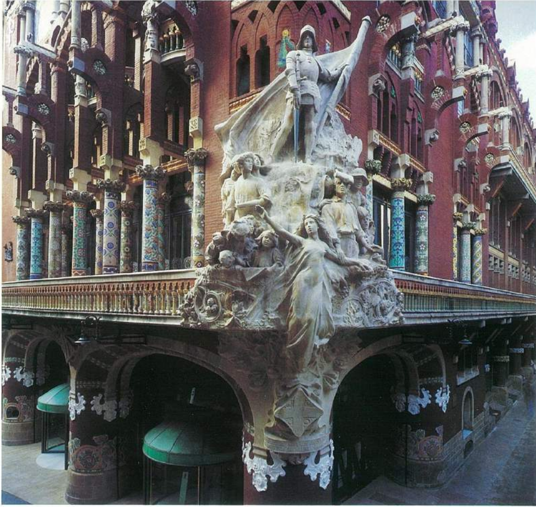
Palau de la Música Catalana'nın cephesi.