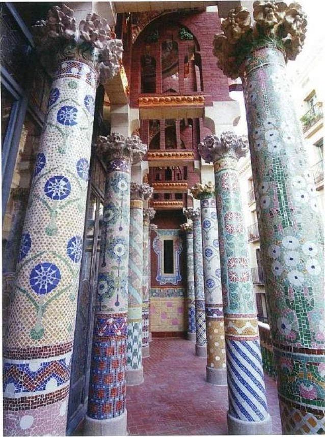
Palau de la Música Catalana'nın dış cephesinden kolonlar, (© Antoni Gaudí).