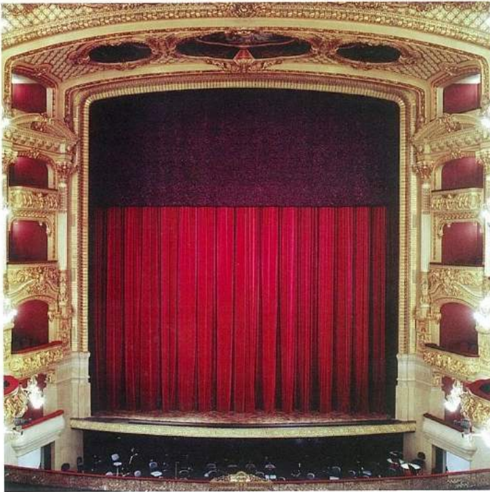
Gran Teatro del Liceu konser salonu sahnesi, (© Antoni Bofill).

büyük unsur burasının orijinal haline sadık kalınarak da olsa tamamen yeniden inşa edilmiş olması. Dolayısıyla tarihin soldurduğu o zarif yaşlı hanımların asaletinin yerine mecburen ciddi bir estetik müdahaleden geçmiş bir dost ile karşılaşıyorsunuz. Ne yazık ki Liceu'nun oditoryumu 31 Ocak 1994'te çıkan büyük bir yangın sonucu tamamen yok olmuş. Esasında bu tiyatronun geçirdiği ikinci yangın; zira 9 Nisan 1861'de de Liceu ciddi bir yangından sonra tekrar inşa edilmiş. Tiyatronun tarihçesinde bir başka felâket de 7 Kasım 1893 gecesi sezonun ilk temsili olan Rossini'nin Guillaume Tell operasının ikinci perdesi sırasında partere anarşist Santiago Salvador tarafından atılan iki Orsini bombasından birisinin patlayarak yirmi iki kişinin ölümüne ve otuz beş kişi-