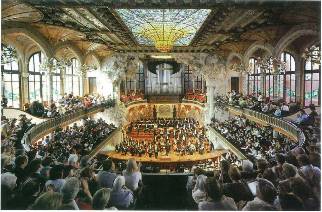
Palau de la Música Catalana konser salonu, (© Antoni Bofill).

mimar Lluís Domènech i Montaner (1850-1923) tarafından inşa edilen Barcelona'nın UNESCO listesindeki bu eşsiz müzik sarayı, içinde işitilen güzel seslerin insan hissiyatı üzerindeki etkilerle görsel anlamda da yarışmasına, zarafet ve ince işçiliğin, süsün ve renk cümbüşünün doruğa çıktığı bir saraydan öte kutsal bir tapınak havasında. İnsanoğlunun "Belle Époque" olarak tanımladığı o kibar ve ince ruh devri mimarisinin günümüze mucizevi bir şekilde orijinal halinde ulaşan yegâne örneklerinden biri olan bu sanat kompleksi güzel hislerin uyandırdığı yankıyı içinde duyabilenlerin kısa zamanda berberinde gelen sarhoşluğu tadabilecekleri büyüklü bir mabet havasını andırıyor. Dolayısıyla burada bir konser dinlemeden önce sadece binayı tek başına gezmek kesinlikle daha akıl kârı; zira bunu da her saat başı gerçekleşen turlarla yapmak mümkün.