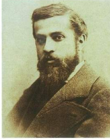
Antoni Gaudí (1852-1926).

Barcelona'nın silüetine uzaktan ilk defa bakan yabancıyı esasta, boyutları ve heybetiyle, bu şehirde karşılayan ve bu şehrin sadece coğrafi keşiflerde değil, Katalanların Art Nouveau'su olarak bilinen "modernista" mimari üslubunda,