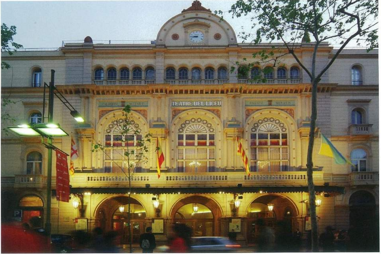
Gran Teatro del Liceu'nun dış cephesi

defa da ses boyutunun mükemmeliyetini eklerken içimdeki tek garip his bu ziyafetin bir bilgisayar tarafından veriliyor oluşuydu. Zira rehberimiz bu mini konseri elinde tuttuğu uzaktan kumanda aletin düğmesine basarak başlatmıştı; belki de bu romantik ortamın en anti-romantik unsuruydu bu, ancak yine de Katalan Müzik Sarayı'nın insanı süslü ipek bir kumaş gibi saran zarif dokusunu bozmaya yetmiyordu. Burada sahneye kimler çıkmamıştı ki: Maurice Ravel, Sergei Prokofiev, Igor Stravinsky, Manuel de Falla, Arnold Schoenberg, Anton Webern, Georges Enescu, Darius Milhaud, Francis Poulenc ve Arthur Honneger. Joaquin Rodrigo'nun meşhur "Aranjuez" gitar konçertosu da ilk defa 9 Kasım 1940'ta burada seslendirilmişti.