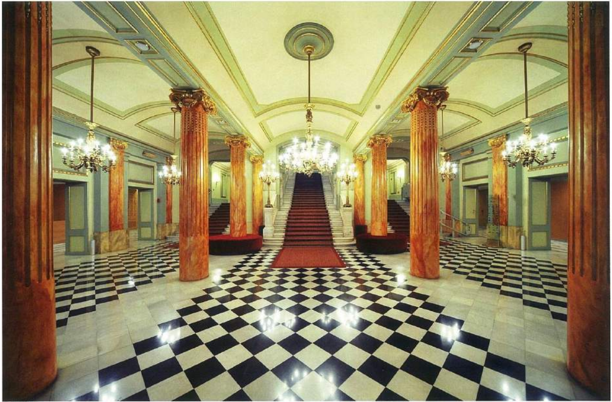
Gran Teatro del Liceu, (© Antoni Bofill).