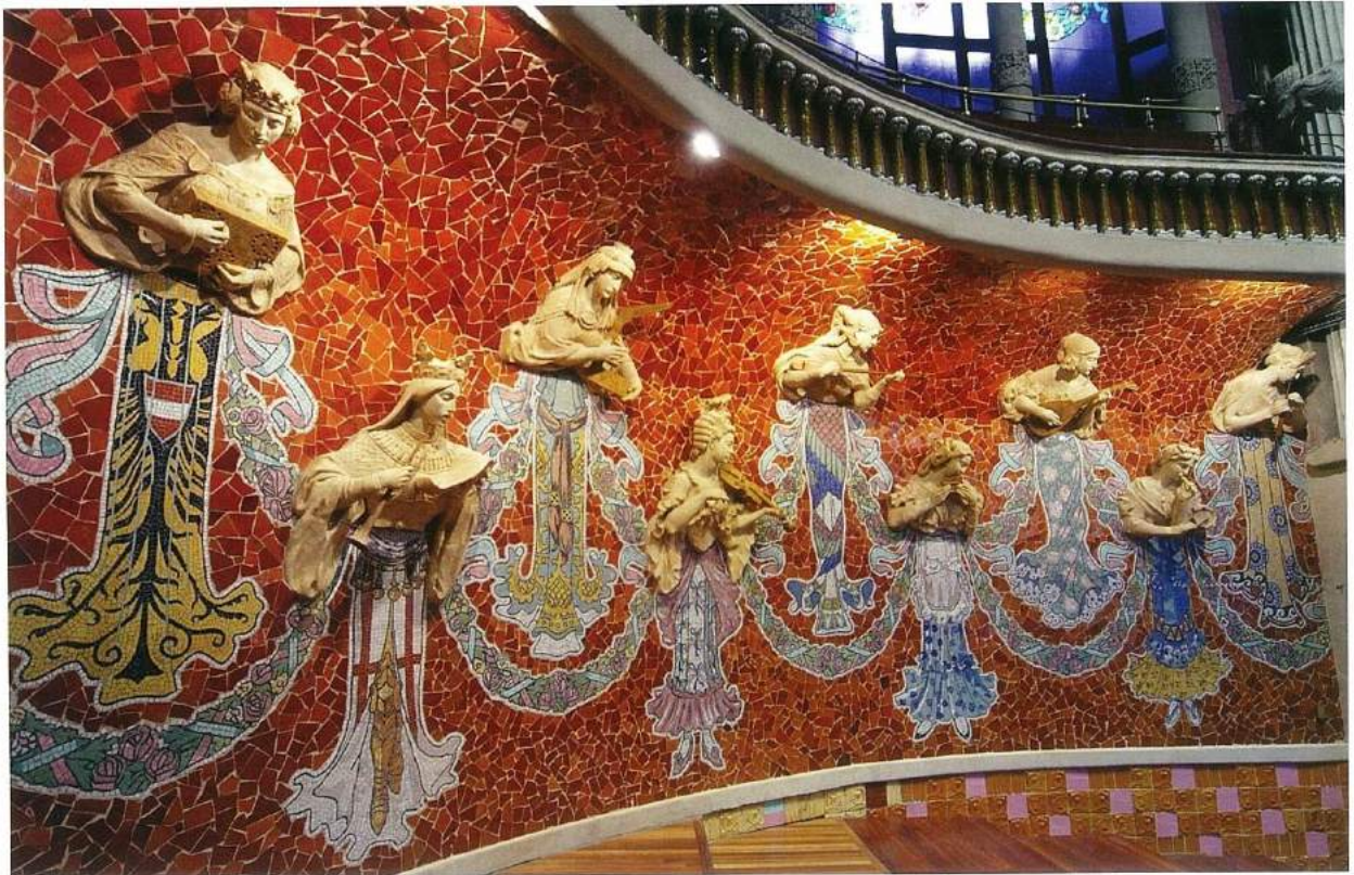
Palau de la Música Catalana, (© Antoni Gaudí).