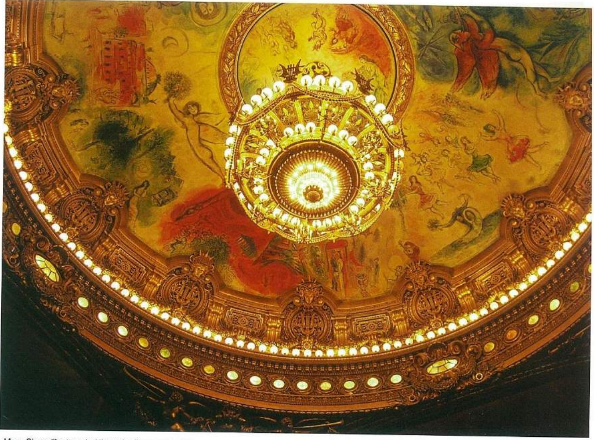
Marc Chagall'ın tasarladığı yeni oditoryum tavanı.

bahtan akşama kadar durmadan dönen yoğun araç ve insan trafiğine konumlandırıldıkları makamdan artık hayretle baktıkları hissediliyor. Onların bu heybetli bakışlarına uzaktan bakarken aklıma evimize seneler önce temizliğe gelen gündelikçi hanımın piyanomun üzerinde sıralı duran besteci büstlerini gördükten sonra 'nedir bu kelleler' şeklindeki yorumu geliyor.