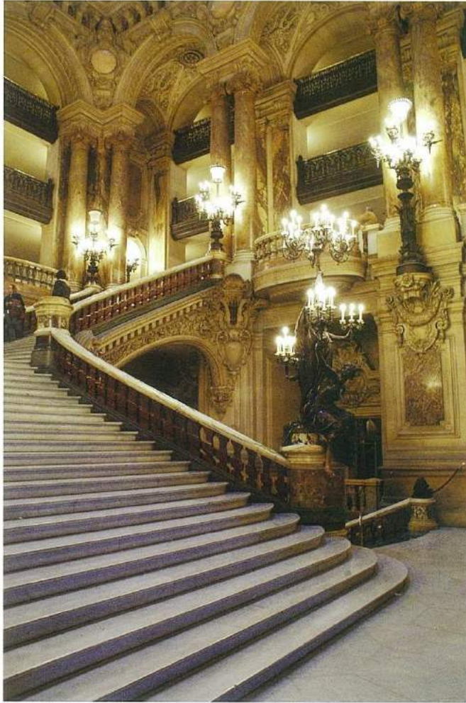
Opera Garnier'nin merdivenleri.

çirkinlikler güzel, bütün gözler kamaşmaya hazır. Attığımız her bir adım hislerinizi ateşleyecek, heyecanınızı tetikleyecek ve başınızı döndürecek. Garnier'nin sarayına hoş geldiniz.