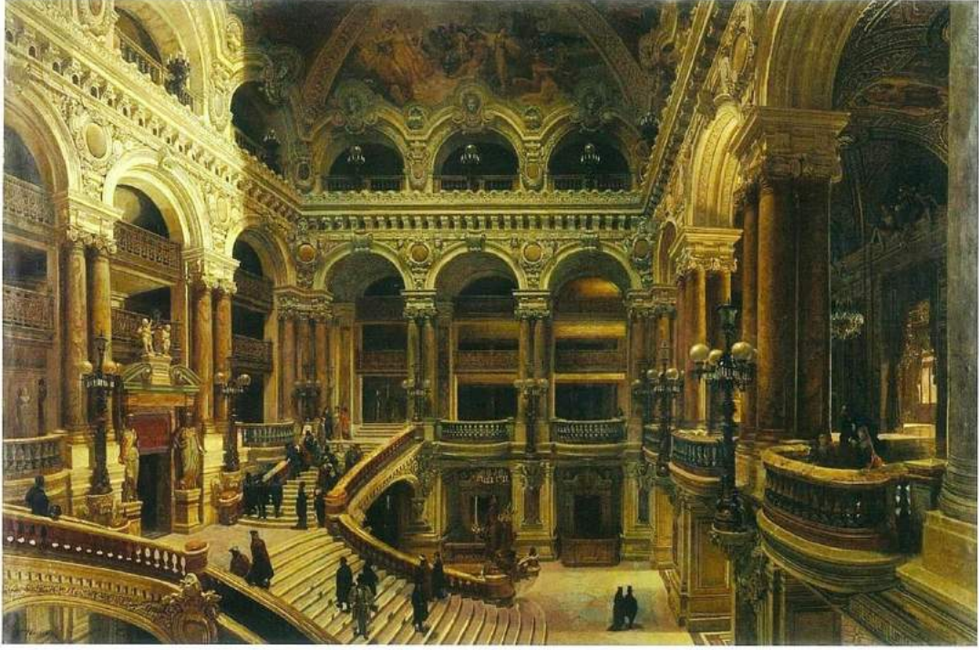
Victor Navlet'in Opera Garnier'nin Büyük Merdiveni tablosu.