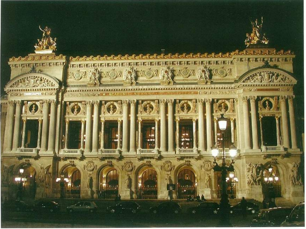
Opera Garnier'nin etkileyici gece görüntüsü.