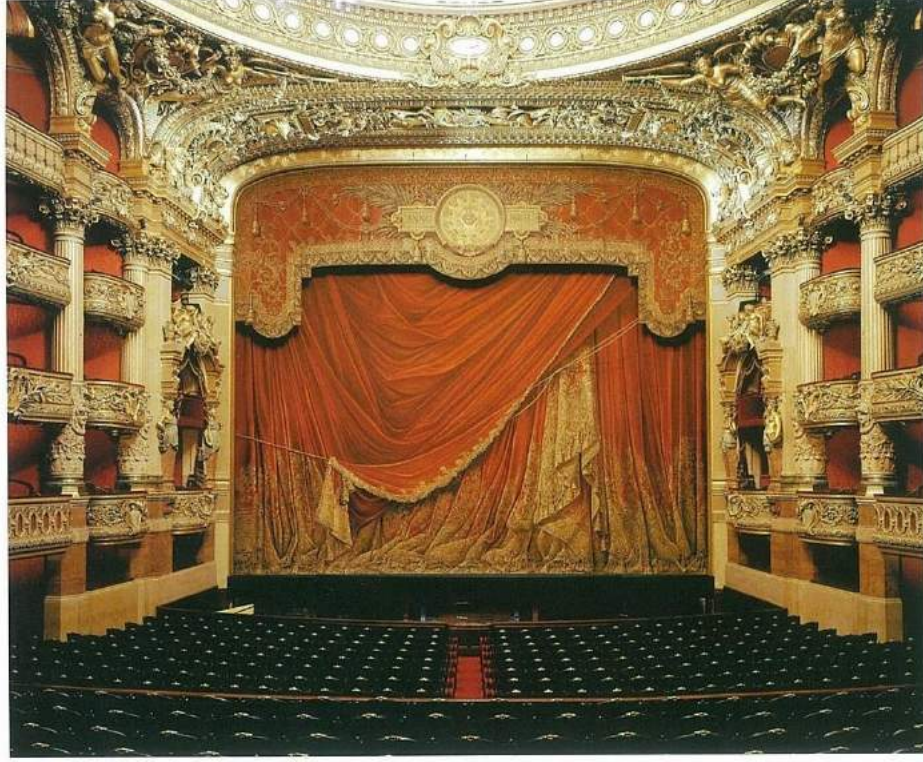
Opera Garnier oditoryum.

yayımladığı "Le Fantôme de l'Opéra" sındaki hayâletin bir an için gözlerini görür gibi oluyorsunuz. Palais Garnier'nin temellerindeki gizli gölün ve dehlizlerin bu hayâli kahramanı artık tavandan pek avize yere indirmese de mevcudiyetini yine de az çok hissettirmiyor değil.