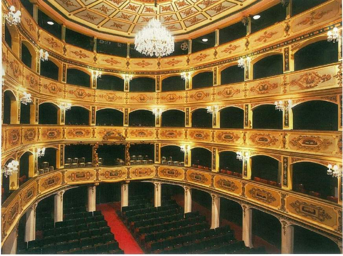
Manoel Opera binasında, altın varak süslemelerin bezediği ahşaptan üç kat loca bulunuyor, (© Teatru Manoel).

ra II. Dünya Savaşı sonrası hemen hemen her safta Avrupa opera binalarının başına gelen talihsiz felâketlerin ne boyutlarda olduğunu bugün de ziyaretçisine hissettirebilen yegâne canlı ve üzücü bir örnek; böylesine zarif bir eseri ortaya koyabilir kudrette olan insanoglunun muhteşem yaratıcılığının yanında aynı zamanda ne derece acımasızca tahrip eder bir kudrette olduğunu bizlere gösteren bir ibret tablosu. Neredeyse 70 yıla yakın bir süredir seçim hükümetleri arasında bu enkazla ne yapacağını bilemeyen Malta bürokrasisinin ise kanımca şaşkınlığının bir alâmeti.