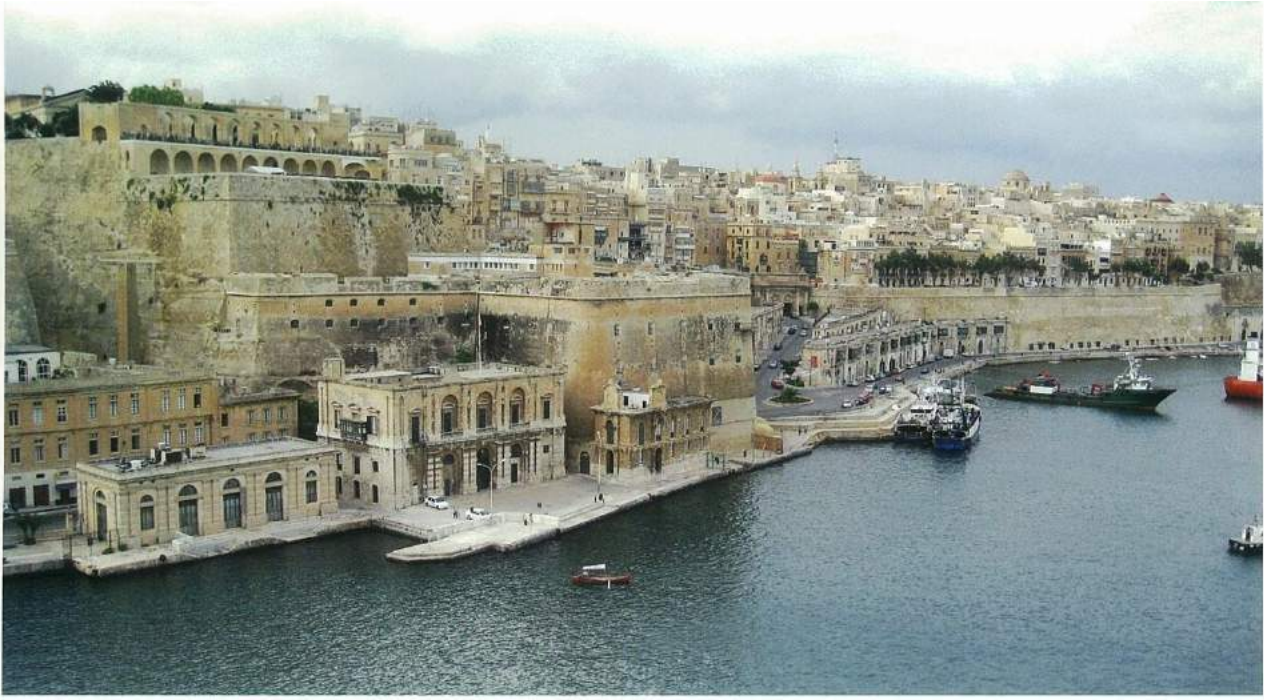
Malta'nın UNESCO dünya kültür mirası şehirleri listesinde bulunan başkenti Valetta, (Fotoğraf: Emre Aracı).