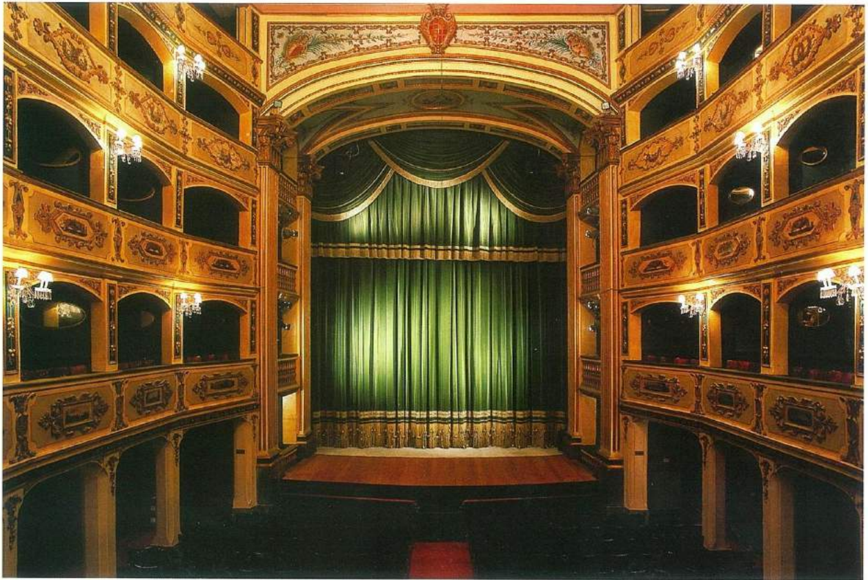
Manoel Opera binası 623 kişi kapasitesiyle günümüzde Avrupa'nın işleyen en eski üçüncü sahnesi konumunda, (© Teatru Manoel).

önce bir süre burada kalmış; İtalyan operası ise pek çok Avrupa şehri gibi burayı da etkisi altına almış. Zira operaseveri Valetta'da hem büyüleyen, hem de şok eden iki değişik manzara var: biri 1731'den günümüze Avrupa'nın faaliyet gösteren en eski tiyatrolarından biri olan, istila ve saldırıya açık bu adada mucizevi bir şekilde ayakta kalmayı başaran Teatru Manoel; diğeri ise 1866'da açılışından sonra II. Dünya Savaşı sırasında, 1942'de, Nazi bombaları tarafından yerle bir edilen, bir zamanların Malta başkentini muhteşem sütunlu dört cephesiyle âdeta taçlandıran Royal Opera House'un çağdaş ziyaretçinin karşısına çıkan, savaş filmlerinden çıkma, trajik mi trajik, perişan ve zavallı enkazı. Bu manza-