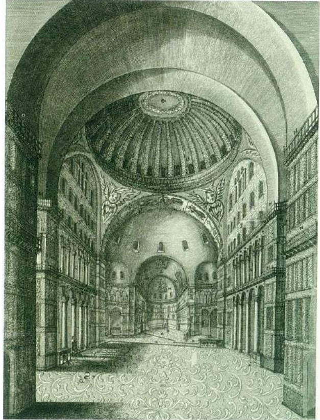
1672 yılında, Ayasofya'nın iç görünümü. Taht salonunda, Doğu mistizmine de büyük ilgi duyan Ludwig'in özel direktifleriyle salon tasarımında İstanbul'daki Ayasofya'nın içi model olarak seçilmiş.

olarak durmakta. Yalnız mermerlerin parlaklığı, parkelerin yeniliği ve varakların aşırı temizliği gezenlere burasının büyük bir renovasyondan geçmiş olduğunu ve savaşın acımasız yok ediciliğini hatırlatmakta. Ancak bunu muhteşem güzellikteki 18. yüzyıldan kalma saray tiyatrosunun içi için söylemek mümkün değil. Çünkü Almanlar II. Dünya Savaşı patlak verdiğinde tarihi tiyatronun ahşap localarını ve süslemelerini demonte ederek saklamışlar, ardından da eski haline sadık bir şekilde koca tiyatroyu yeniden inşa etmişler. Mimar François de Cuvilliés'nin (1695-1768) adını taşıyan rokoko stilindeki bu tiyatronun ebatlarının ve ihtişamının bizim ne yazık ki günümüze ulaşamayan Dolmabahçe Sarayı tiyatromuz ile aynı olduğunu düşünüyorum. Mozart'ın (1756-1791) "Idomeneo" sunun dünya prömiyerinin de gerçekleştiği bu tiyatro, II. Ludwig tarafından zaman zaman ruhsal durumuna uygun tek başına, özel tem-