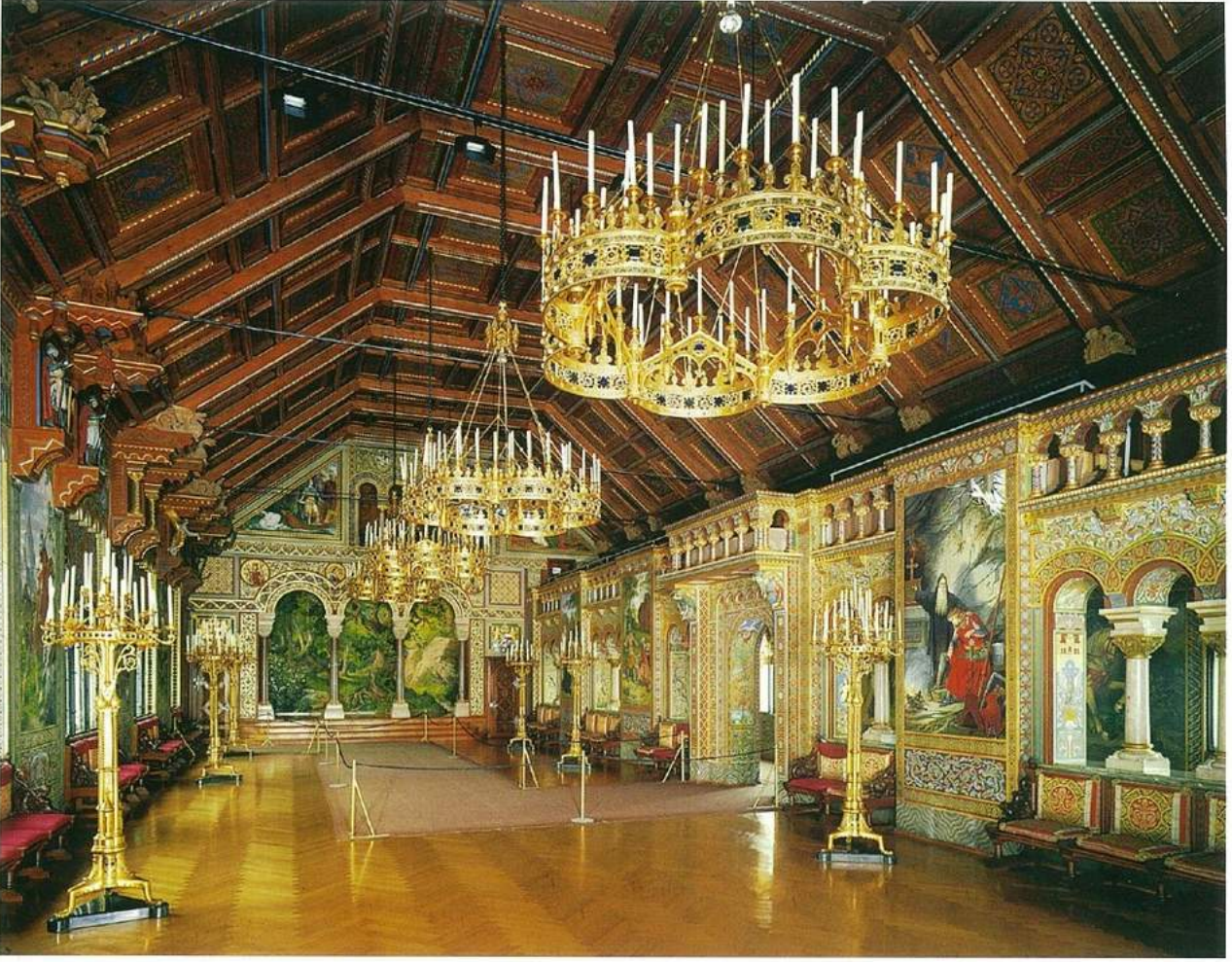
"Aşık Salonu"ndan bir görünüm. Bu bölümde, Alman Besteci Richard Wagner'in Münih'teki Tannhäuser operasından esinlenilmiş. Duvarlarda yer alan resimler "Parvizal" efsanesini anlatırken, salonda yer alan avizeler ve şamdanlar birinci sınıf pirinçten yapılmış.

özgü kurgusunda her zaman bir düşüşün ardından bir yükselişin öyküsünün yer alması ve bu tema değişik şekillerde işlenmiş olsa da her seferinde düşen erkeğin, bir kadın sevgisinin tutkulu gücü ile yükselmesi, ölüm kavramının ölümden sonraki değişime -transfiguration- bir adım olarak yüceltilmesi ve bunu Ludwig'in hayalindeki kuğularla simgeleştirilerek eşleştirilmesi Wagner'i bencil ve çıkarıcı karakterinin hayli olumsuz yönlerine rağmen Ludwig'in gözünde düşsel dünyasındaki müziği canlandırabilen yegâne besteci yapmıştır. Dolayısıyla o sırada yok olmanın ve iflasın eşliğinde bulunan Alman besteci, Ludwig'in kendisine bağladığı maş ve maddi imkanlar sayesinde anıtsal "Der Ring des Nibelungen" opera dörtlüsünü tamamlamış ve sonradan kazandığı haklı üne kavuşabilmiştir. Ludwig Kral olarak gerçek hayatın ilk sillesini Wagner için Münih'e inşa ettirmeyi düşündüğü yeni opera binası projesinin kendi parlamentosu tarafından itirazına tanık olarak yaşar. Ancak seneler sonra Almanya'nın güneydoğusunda küçük bir kent olan Bayreuth Wagner'i bağrına basınca hayalini kurduğu Festival Tiyatrosu Münih yerine burada kurulur. Wagner, bu tiyatro binasını, geliştirdiği "sanatta bütünlük" anlayışı doğrultusunda bir-