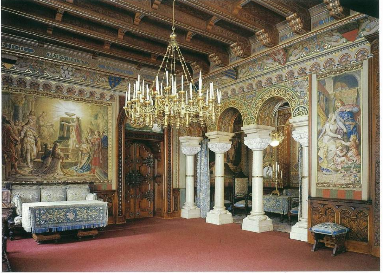
Kral II. Ludwig'in oturma odası. Duvarlarda yer alan resimler "Lohengrin" efsanesinden betimlemeler içeriyor. Oturma odasının bitişiğinde, II. Ludwig'in kitap okumayı ve hayal kurmayı en sevdiği yer olan cumbası "Kuğu'nun köşesi" yer alıyor. Cumbanın girişindeki mavi perdeler zambak ve kuğu desenleriyle süslenmiş.

silleri izlemek için kullanılmış. Ludwig 25 Ağustos 1845'te Wittelsbach'ların Münih yakınlarındaki yazlık sarayı olan Nymphenburg'da doğmuş olmasına rağmen çocukluğunu babası II. Maximilian'ın (h.1848-1864) Gotik stilde eski bir kale yıkıntısı üzerine inşa ettirdiği ve Neuschwanstein'in hemen yakınındaki Alpsee gölüne tepeden bakan Hohenschwangau Şatosu'nda geçirmiş. Hohenschwangau'nun duvarlarındaki Alman mitolojisine ait betimlemeleri ve şatodaki kuğu sembollerini takip ettikçe Ludwig'in romantik karakterine giden o hayal dünyasının dehlizlerine de birer birer girdiğini hissediyor insan. Sert tabiatlı babasıyla iletişim kuramayan hassas yapıdaki bir çocuğun, duvarlarda büyük panoramalar halinde gözüne çarpan ve Lohengrin operasından farklı ama yine başka bir "kuğu şövalye" efsanesiyle kendisini özdeşleştirmesi ve giderek gerçek dünyadan kopmasının hikâyesi bu sarayda geçirdiği yalnız çocukluk günlerinde aranmalıdır. Hohenschwangau'da beni etkileyen odalardan bir tanesi de Maximilian'ın velihtliği döneminde II. Mahmud'un (h.1808-1839) konuğu olarak İstanbul'u ziyaretinin hatırası olarak duvarlarına Boğaz manzaralarını resmettirdiği Kraliçe Marie'nin yatak odası oldu. Odanın tam ortasında da kendisine II. Mahmud tarafından hediye edilen Türk ku-