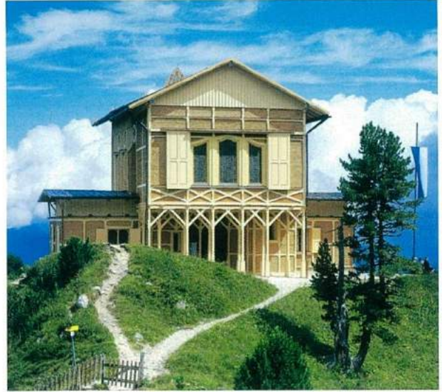
Schanzen'deki kraliyet evinin dış görünümü.