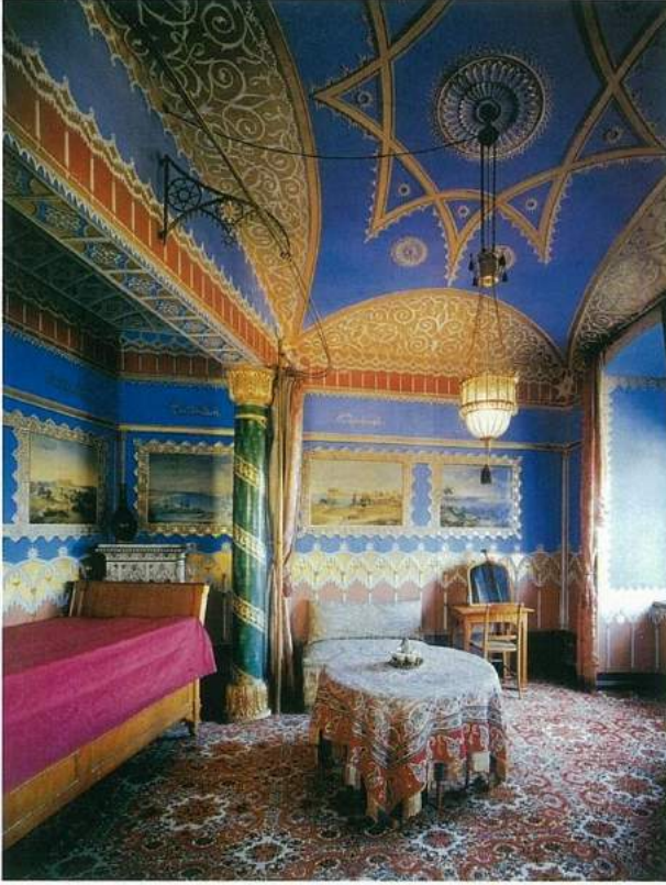
II. Ludwig'in doğduğu "Hohenschwangau Palace'daki Kraliçe Marie'nin yatak odası. Oryantal oda olarak da bilinen bu mekânın tasarımı, 1832-33 yıllarında Türkiye ve Yunanistan'a yaptığı ziyaretlerinden esinlenerek gerçekleştirilmiştir.

la her taşın yerinin tesbitinde nasıl da söz sahibi olduğunu bir kere daha anlıyorsunuz. Dev kale kapısından içeri girdiğinizde artık Ludwig'in Wagner müziğiyle canlanan hayal dünyasının içine adım attığınızı düşününebilirsiniz. Mitolojik ve masalsi konulara eğilen, kalıcı simgesel değerler peşinde olan müziğin yansımalarını hissettiren duvardaki her freskin, her obje ve sembolün ardındaki gizli bir hikâye, şatoyu gezenleri adeta içine çekiyor. İçleri minyatürlerle süslü, tezhip sanatının doruğa çıktığı, varaklı eski yazmalar gibi işte Neuschwanstein'da böyle dev bir kitabın içinde dolaştığını hissettiriyor insana. Çivit mavisi tavanlarda altın varaklı parlayan yıldızlar, üzerlerini kuğu motiflerinin zenginleş-