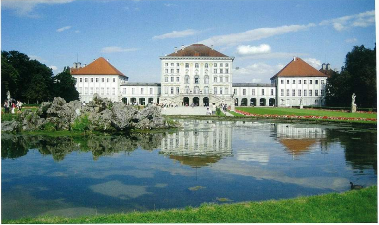
Kral II. Ludwig'in doğduğu Nymphenburg Sarayı, fotoğraf: Emre Aracı.

Nymphenburg'da saray arabalarının sergilendiği müzede yer alan bu kızaklara baktıkça Ludwig'in yalnız dünyasını, bu dünyayı renklendiren antik dönem efsaneleri, Ortaçağ şövalyeleri ve ozanları üzerine kurulmuş Wagner operaları ile canlanabilen o hayal alemini görebiliyor insan. Bu gerçek olmayan bir peri masalı gibi, ama gerçekte hüznünlü bir yaşam mücadelesidir.