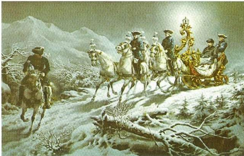
Kral II. Ludwig'in gece Linderhof'tan başlayan efsanevi atlı kızak gezisi, R.Wenig tarafından çizilmiş, 1885-86, © Marstallmuseum at Nymphenburg Palace.

la her taşın yerinin tesbitinde nasıl da söz sahibi olduğunu bir kere daha anlıyorsunuz. Dev kale kapısından içeri girdiğinizde artık Ludwig'in Wagner müziğiyle canlanan hayal dünyasının içine adım attığınızı düşününebilirsiniz. Mitolojik ve masalsi konulara eğilen, kalıcı simgesel değerler peşinde olan müziğin yansımalarını hissettiren duvardaki her freskin, her obje ve sembolün ardındaki gizli bir hikâye, şatoyu gezenleri adeta içine çekiyor. İçleri minyatürlerle süslü, tezhip sanatının doruğa çıktığı, varaklı eski yazmalar gibi işte Neuschwanstein'da böyle dev bir kitabın içinde dolaştığını hissettiriyor insana. Çivit mavisi tavanlarda altın varaklı parlayan yıldızlar, üzerlerini kuğu motiflerinin zenginleş-