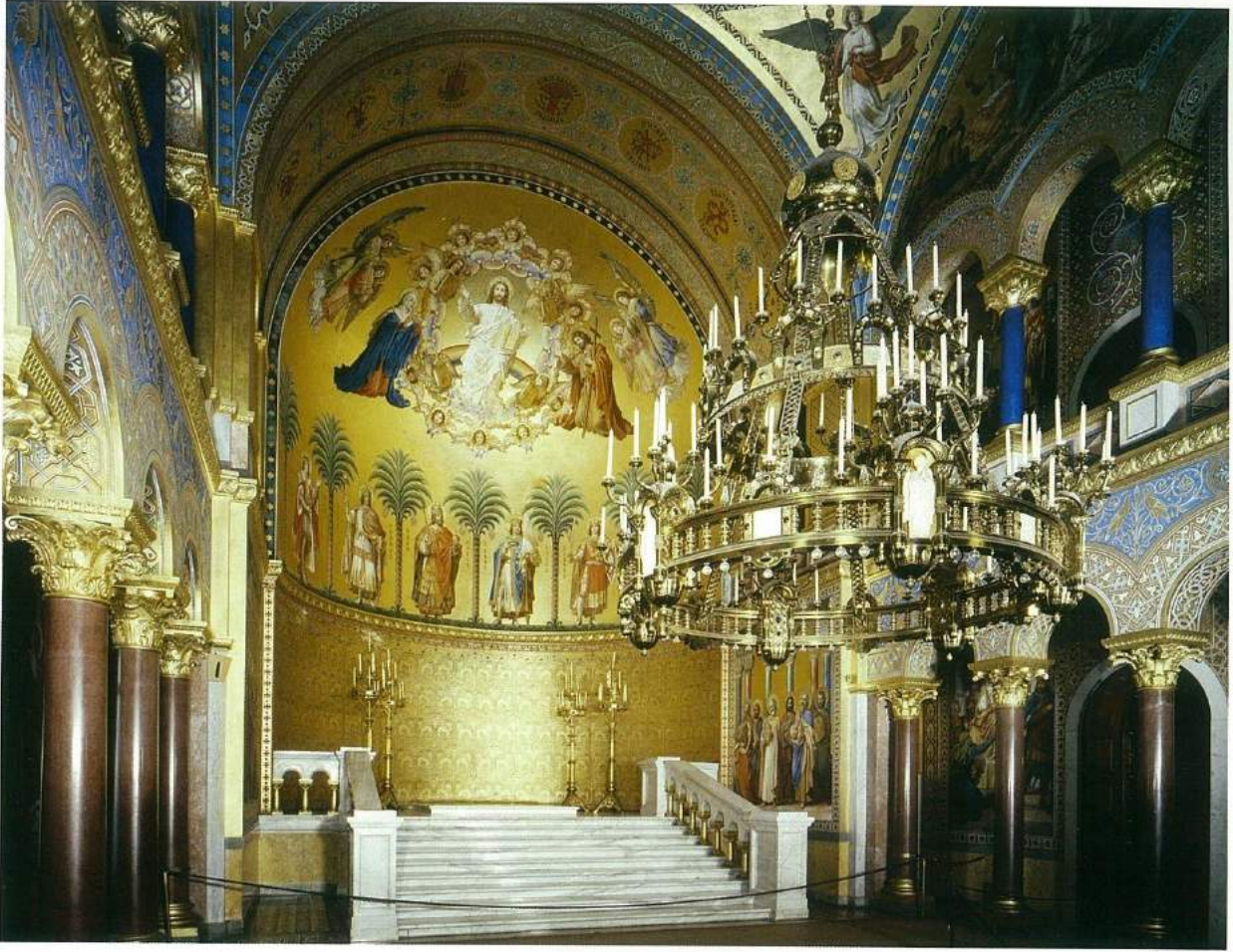
Taht salonunun farklı bir açıdan görünümü. Tavanları süsleyen Ortaçağ taç kesimli avize, Aachen Katedrali'ndeki Kutsal Kudüs'ü simgeleyen avizelerden esinlenerek yapılmış.

olarak durmakta. Yalnız mermerlerin parlaklığı, parkelerin yeniliği ve varakların aşırı temizliği gezenlere burasının büyük bir renovasyondan geçmiş olduğunu ve savaşın acımasız yok ediciliğini hatırlatmakta. Ancak bunu muhteşem güzellikteki 18. yüzyıldan kalma saray tiyatrosunun içi için söylemek mümkün değil. Çünkü Almanlar II. Dünya Savaşı patlak verdiğinde tarihi tiyatronun ahşap localarını ve süslemelerini demonte ederek saklamışlar, ardından da eski haline sadık bir şekilde koca tiyatroyu yeniden inşa etmişler. Mimar François de Cuvilliés'nin (1695-1768) adını taşıyan rokoko stilindeki bu tiyatronun ebatlarının ve ihtişamının bizim ne yazık ki günümüze ulaşamayan Dolmabahçe Sarayı tiyatromuz ile aynı olduğunu düşünüyorum. Mozart'ın (1756-1791) "Idomeneo" sunun dünya prömiyerinin de gerçekleştiği bu tiyatro, II. Ludwig tarafından zaman zaman ruhsal durumuna uygun tek başına, özel tem-