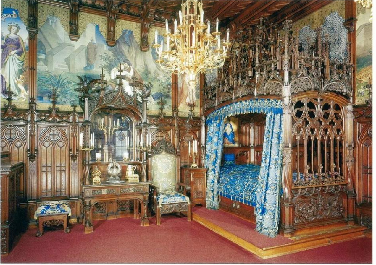
II. Ludwig'in yatak odası. Duvarlarda bulunan resimler "Tristan und Isolde" efsanesini anlatıyor. "Oak" ağacından yapılan mobilyaların oymaları Anton Pössenbacher tarafından yapılmış. Kuğu biçimdeki gümüş çeşme ve gümüş lavabo Julius Hofmann imzalı.