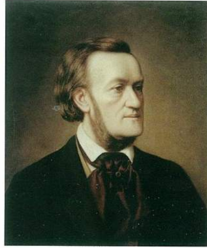
"Besteci Richard Wagner", Caesar Willich, 1862.