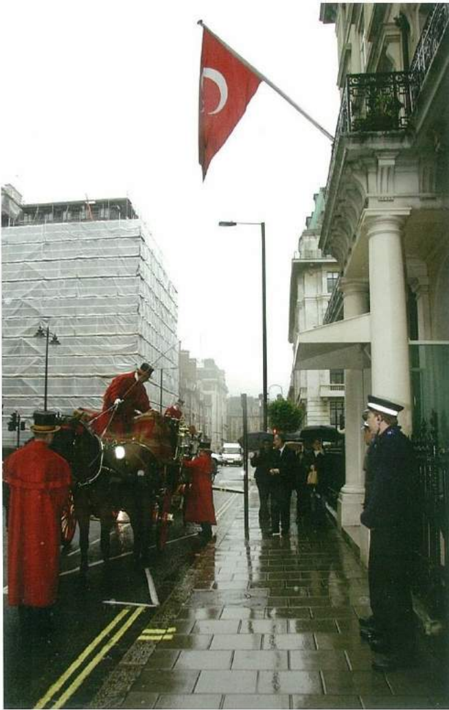
T.C. Büyükelçilik rezidansına dönüş.