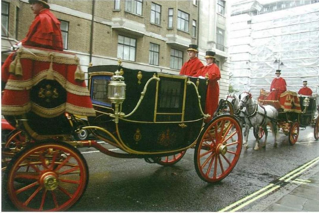
Büyükelçi Yiğit Alpogan 9 Ekim 2007 tarihinde itimatnameyi sunmaya giderken.