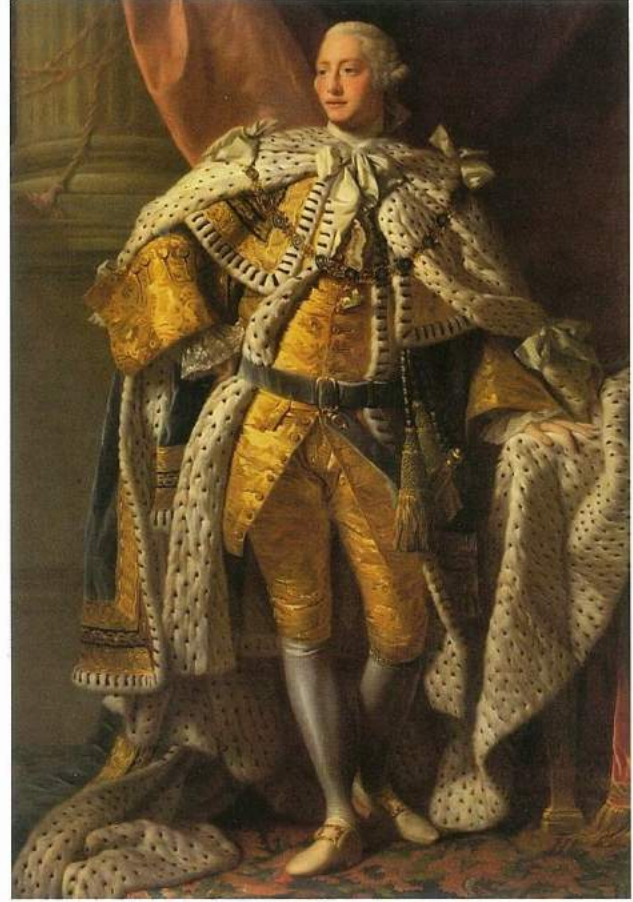
Allen Ramsay (1713-1784), "İngiltere Kralı 3. George'un Portresi", 1762, tuval üzerine yağlıboya, 80.3x64.3 cm, Ulusal Portre Galerisi, Londra.