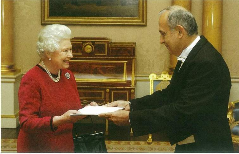
İngiltere Büyükelçimiz Yiğit Alpogan 9 Ekim 2007'de Buckingham Sarayı'nda Kraliçe 2. Elizabeth'e güven mektubunu sunarken.