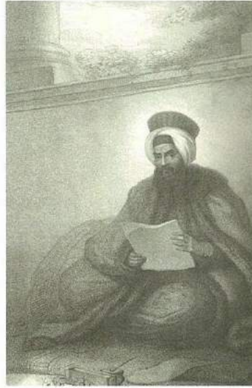
Padişah 3. Selim zamanında ilk daimi İngiltere elçimiz olarak Londra'ya giden Yusuf Ağâh Efendi, gravür.