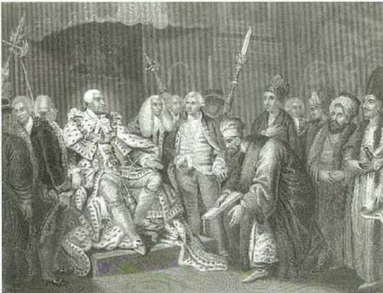
İlk İngiltere sefiri Yusuf Ağâh Efendi 3. George'a itimatnamesini sunarken, 29 Ocak 1795, gravür.