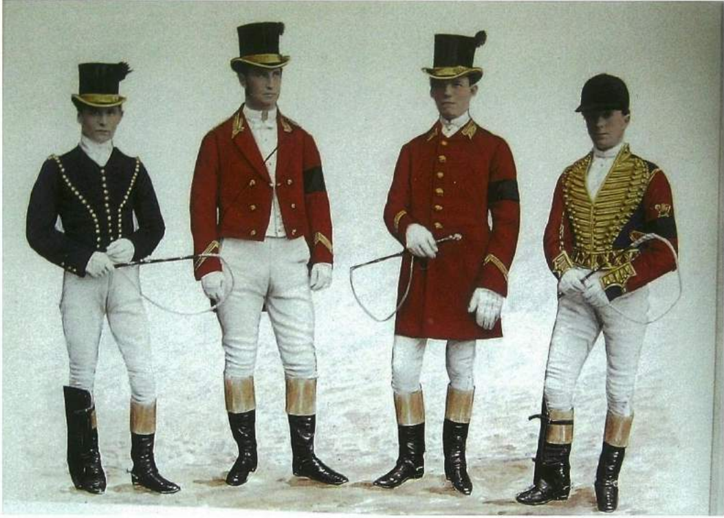
"Majestelerinin Seyisleri", The Royal Mews, 1991.

Entry and Public Audience", yani, arza kabul merasimine Şubat 1795 tarihli sayısında geniş yer vermişti; 'Yussuf Adjah Effendi' sabah 11'de Chelsea'deki Kraliyet Koleji'nden burada hazırlanan bir kortej eşliğinde Buckingham Sarayı'na doğru yola çıkar. En başta üç Türk seyis, 3. Selim'in Kral 3. George'a hediyesi olan üç Arap atını götürmektedir. Ardından saray arabası içerisinde Yusuf Ağâh, ardındaki arabada itimatnameyi sırmalı bir çanta içerisinde taşıyan Mahmud Raif Efendi, ardından da danışma meclisi üyelerini ("Gentlemen of the Privy Council") taşıyan Galler Prensi, York, Clarence ve Gloucester Dükleri'nin at arabaları gelmektedir. Saraya varıldığında Yusuf Ağâh özel bir odada kılığını değiştirir; üzerine sadece Osmanlı divan üyelerinin giydiği, derginin fonetik olarak "chorassau" şeklinde tarif ettiği özel kıyafetini giyer ve 3. George'un huzuruna çıkar. Gelenek olarak Kral'ı üç kere selamladıktan sonra tercümanı Signor Persiani tarafından tercüme edilen kısa bir konuşma yapar. İtimatname teslim edilir ve yine üç selamla huzurdan ayrılır. Daha sonra Yusuf Ağâh Kraliçe Charlotte'u da ayrıca ziyaret eder. Dergi verilen hediyeleri de detaylıca tasvir etmektedir: Kral'a üç Arap atının yanı sıra bir çift altın tabanca ve altın bir hançer, Kraliçe'ye ise ipek kumaşlar ve başına takması için değerli taşlarla bezeli tüylü bir taç hediye edilmiştir.