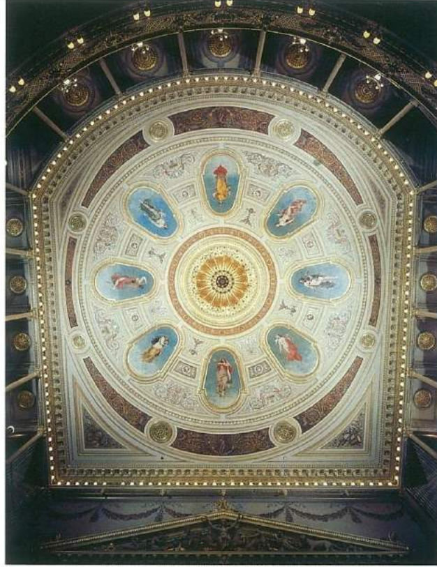
Prag Ulusal Tiyatro'nun tavan süslemesi.

zet'nin acı kaderine üzülmemek elde değildi. Sanatın kalpten geçtiğini düşünürsek şaşırılmak lazım bu ecele. Prag Devlet Operası her yılbaşı gecesi bu binada Sylvester Balosu olarak anılan şatafatlı bir balo düzenliyor. Johann Strauss'un "Yarasa" operetinin sahnelendiği gecede konuklar tam bir 19. yüzyıl balosunu yaşıyorlar. Zira temsil den sonra parter dans pistine dönüşüyor ve herkes coşkulu eğlenceye katılıyor. Ne de olsa eski bir Avusturya İmparatorluğu toprağı olmasından ötürü Prag'daki bu Viyana tarzı eğlence olağan hayatın doğal bir parçası.