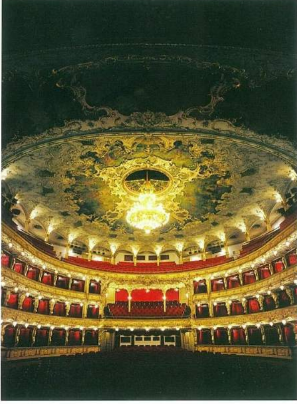
Prag Devlet Operası'nın sahnesinden bir görünüm.