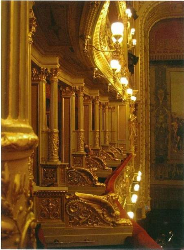
Prag Ulusal Tiyatro'nun locaları. Fotoğraf: © Emre Aracı, 2008.

yan bir Han'dan ötürü Villa Amerika olarak da anılır olmuş. "Yeni Dünya" senfonisinin bestecisinin hatırasına ev sahipliği yapması ise tamamen bir tesadüf. Zira Dvorák bu evde hiç bir zaman kalmamış, yaşamamış. Burası besteciye uzun bir süredir müze kurmak isteyen Dvorák Derneği tarafından satın alınmasının ardından 1932 yılında kapılarını açmış. Küçük mütevazı bir alan. Her ne kadar bestecinin orijinal yazmaları teşhir edilmese de Dvorák Müzesi'nde ona ait şapka, baston, madalyon gibi şahsi eşyaları görmek mümkün. Prag'da yaşadığı Zitna Caddesi'ndeki apartman daire-sinden getirilen bestecinin çalışma masası, viyolası ve Bö-sendorfer piyanosu da burada. Orijinal materyal ve notaların çoğunluğu ise müzenin zengin arşivine kayıtlı. Örneğin "Yeni Dünya" senfonisinin 120 sayfalık orijinal yazması bestecinin ölümünün 100. yılı olan 2004'te sadece 8 saat açık kalmasına izin verilen bir sergide Rudolfinum'da teşhir edilmiş. Beethoven'ın bir portresi ve Mozart'ın büstü de Dvorák'ın çalışma alanında ona ilham kaynağı oluşturmuş objeler arasında. Cambridge Üniversitesi'nden 1891 yılında aldığı fahri doktora unvanının cübbesi de Michna Yaz Sarayı'nda teşhir ediliyor. Bestecilerin manevi huzurunda onları hissetmekten keyif alan herkes için ziyaret edilmesi gereken bir yer Prag'daki Dvorák Müzesi.