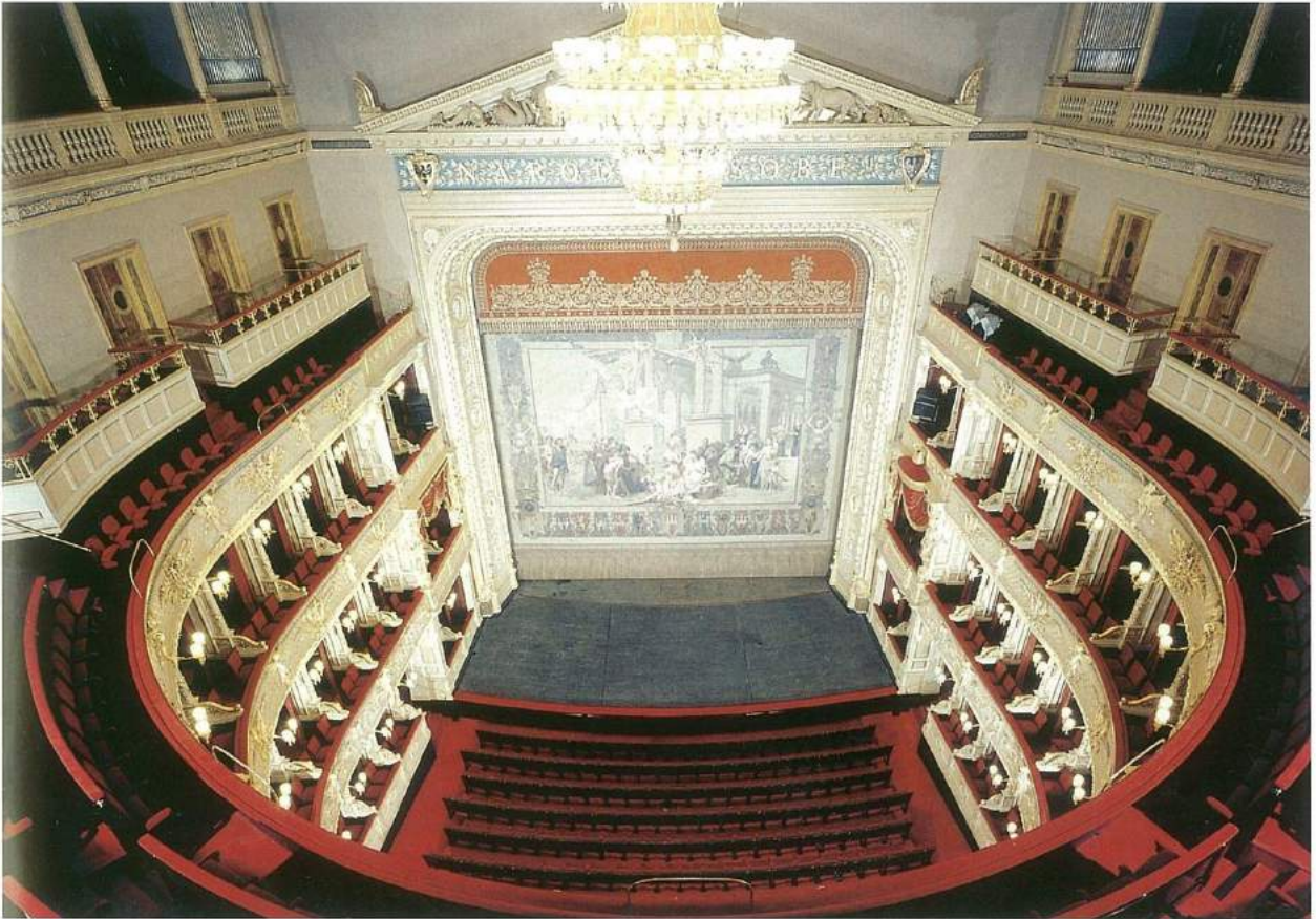
Prag Ulusal Tiyatro'nun oditoryumu.

Prag'da izini sürdürdüğümüz ikinci besteci ise Antonin Dvorák oldu. Çek milliyetçiliğinin müzikte doruğa çıktığı 19. yüzyıla damgasını vuran Dvorák için de Çek'ler başkentlerinde bir müze kurmuşlar. Mimar Ignaz Dientzenhofer'in imzasını taşıyan bu kiremit ve krem rengi villa geç Barok döneme ait. Michna Ailesi'nin yazlık sarayı olarak inşa edilen bina daha sonra yakınlarında açılan ve Amerika adını taşı-