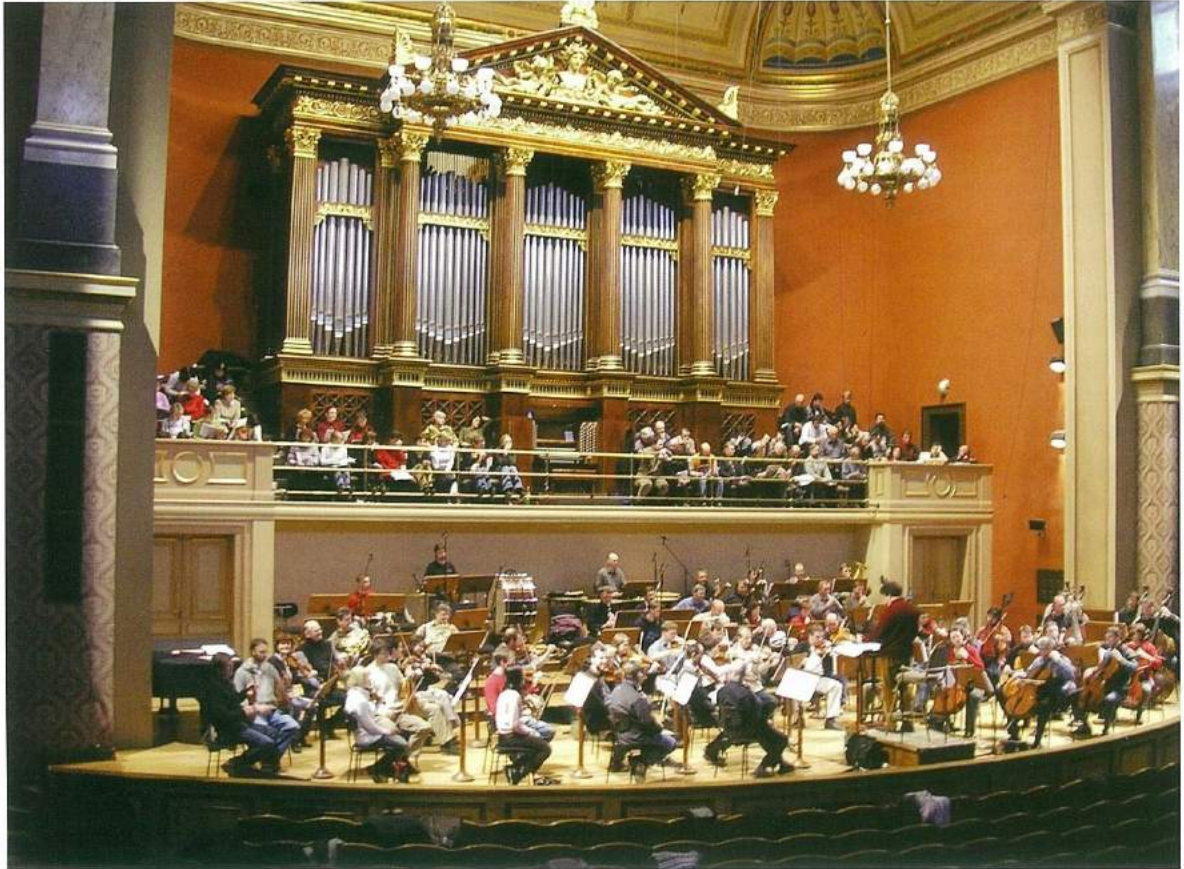
Emre Aracı idaresindeki Prag Senfoni Orkestrası ve Filarmoni Korusu, Rudolfinum'un Dvorák Salonu, Mart 2005.

özel bir gönül bağı duyan Mozart burayı dört kere ziyaret etmiş. İlk ziyareti "Figaro"nun temsilinden hemen sonra olmuş ki meşhur Prag Senfonisi'ni de (Re Majör, K 504) 1787 Ocak'ındaki bu ziyaret esnasında ilk defa bu şehirde 19 Ocak'ta seslendirilmiş. Bunu "Don Giovanni" prömiyeri için geldiği ikinci ziyaret takip etmiş. 1789'da Prens Lichnowsky ile birlikte Berlin'e giderken Mozart kısa bir süre için tekrar Prag'a uğramış. Son ziyareti ise Bohemya tahtına çıkan Kutusal Roma Cermen İmparatoru 2. Leopold'un Prag'daki taç