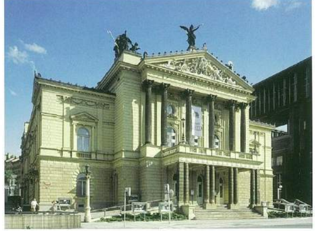
Prag Devlet Operası'nın dış cephesi.

özel bir gönül bağı duyan Mozart burayı dört kere ziyaret etmiş. İlk ziyareti "Figaro"nun temsilinden hemen sonra olmuş ki meşhur Prag Senfonisi'ni de (Re Majör, K 504) 1787 Ocak'ındaki bu ziyaret esnasında ilk defa bu şehirde 19 Ocak'ta seslendirilmiş. Bunu "Don Giovanni" prömiyeri için geldiği ikinci ziyaret takip etmiş. 1789'da Prens Lichnowsky ile birlikte Berlin'e giderken Mozart kısa bir süre için tekrar Prag'a uğramış. Son ziyareti ise Bohemya tahtına çıkan Kutusal Roma Cermen İmparatoru 2. Leopold'un Prag'daki taç