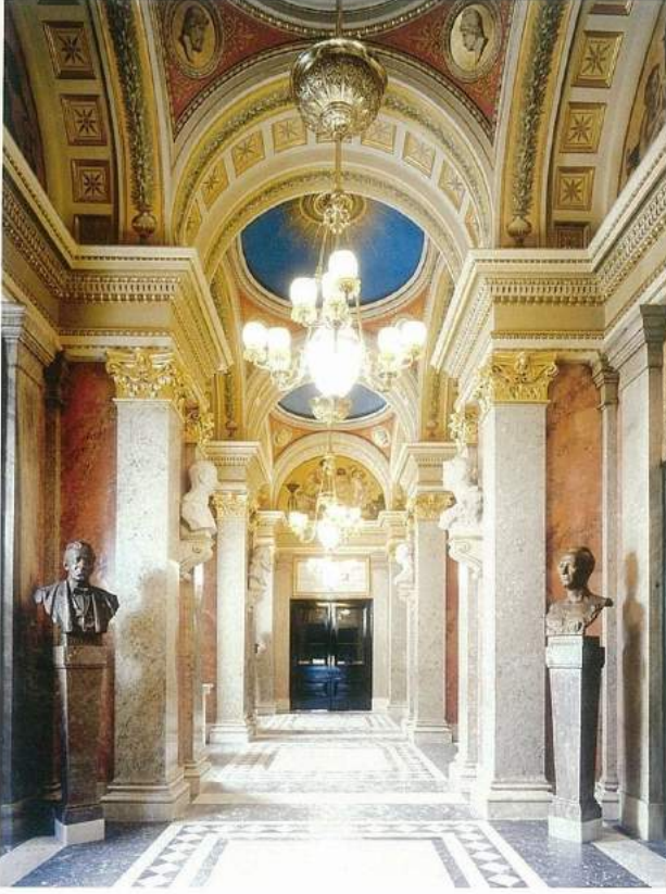
Prag Ulusal Tiyatro, ana giriş.