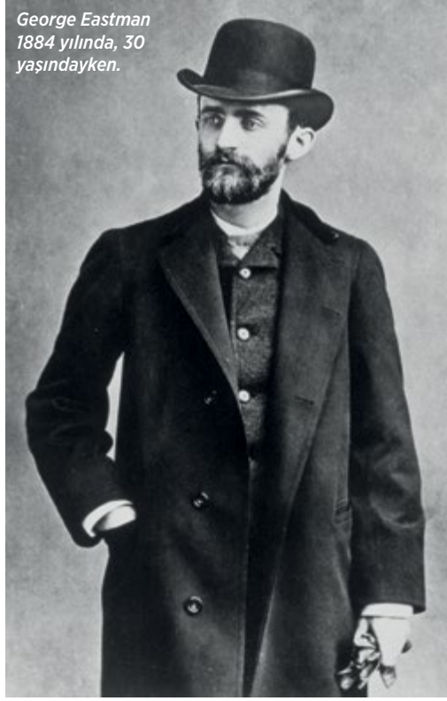
George Eastman 1884 yılında, 30 yaşındayken.

Sibelius, Klingenberg'i geri çevirmedi; teklifini düşündü. Genç, dahiyane öğrencilere ders verecek ve Amerika'nın mükemmel orkestralarıyla konser vermek için bol bol zamanı olacaktı. Üstelik maaş olarak 20 bin Amerikan doları talep etti. Bugün neredeyse çeyrek milyon dolar olan bu ücret o zaman için de büyük bir rakamdı. Belki de Sibelius Rochester'dakileri bu talebiyle caydırmak istemişti. Ama Eastman, Sibelius'un bu arzusunun