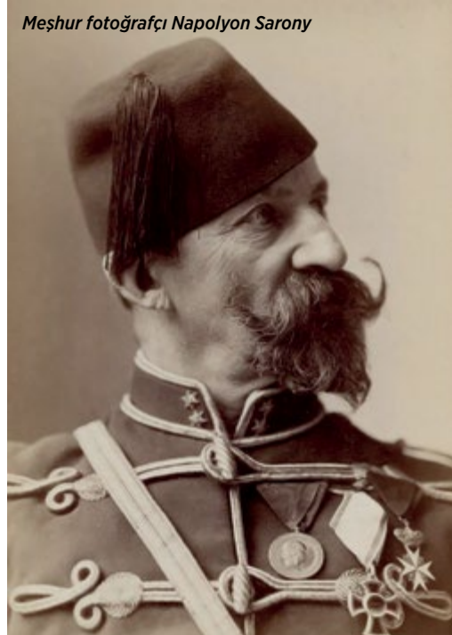
Meşhur fotoğrafçı Napolyon Sarony

George Eastman bütün bu girişimlerini taçlandırmak üzere 1922'de ayrıca Rochester Filarmoni Orkestrası'nın kurulmasını sağladı. Bu orkestranın başına 1923'te İngiliz orkestra şefi ve besteci Eugene Goossens getirildi. Fritz Reiner, Sir Thomas Beecham, Serge Koussevitzky, Aaron Copland, Leonard Bernstein ve Leopold Stokowski gibi meşhur şef ve besteciler de Eastman'ın kurduğu orkestrayı idare eden maestro'lar arasında yer alacaktı.