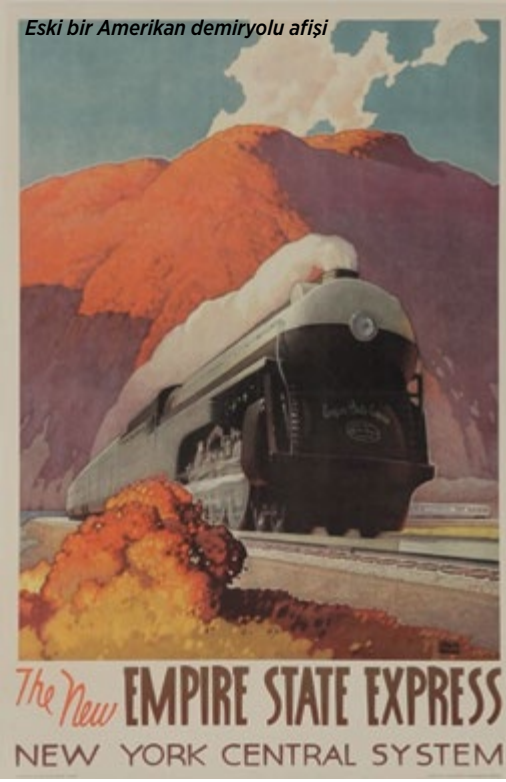
Eski bir Amerikan demiryolu afişi

verde sansasyon yaratan genç estet 'in sunumunu ışıklarla sabote etmeyi başarmıştı. Opera binasının yandığı 1891'de bu defa Çaykovski New York'tan Niagara Şelaleri'ni görmek üzere trenle bu diyarlara gelmiş ve onu taşıyan vagon da bu hattan geçmişti. New York'tan çıkınca uzun bir süre Hudson Irmağı boyunca giden demiryolunun manzarası hoşuna giden Çaykovski yolculuğunun Albany sonrasındaki kısmında biraz sıkılmıştı. Ancak Niagara'ya vardığında, akşam kulağına uzaktan gelen dev şelalelerin sesi onu büyülemiş ve çıktığı kısa süreli ziyaret yapmış olduğu bu uzun tren yolculuğuna değmişti. Hem Wilde ve hem de Çaykovski dokuz yıl arayla New York'ta buldukları sırada sosyete fotoğrafçısı Napolyon Sarony'nin kamerası karşısında poz vermeyi de ihmal etmemişlerdi. Başında fesıyla kendi otoportresini de çeken Sarony bıyık tarzıyla Fransız İmparatoru III. Napolyon'a benzetilirdi.