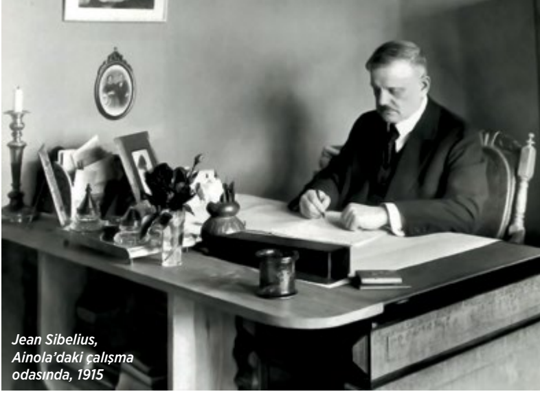
Jean Sibelius, Ainola'daki çalışma odasında, 1915