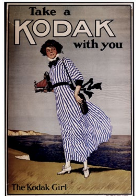
Fotoğraf makinasının Kodak adıyla eş anlamlı tutulduğu yıllardan bir reklam