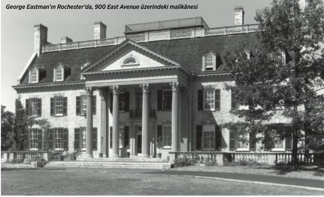
George Eastman'ın Rochester'da, 900 East Avenue üzerindeki malikânesi