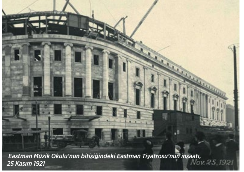
Eastman Müzik Okulu'nun bitişindeki Eastman Tiyatrosu'nun inşaatı, 25 Kasım 1921

Rochester Sibelius'a ev sahipliği yapamadı; onun yerine Norveçli besteci Christian Sinding kompozisyon profesörlüğüne getirildi ve ardından da, ilk adından Türk sanacığınız, ama Finlandiyalı bir başka besteci, Selim Palmgren bu görevi devraldı. 1921 Eylül'ünde okul kapılarını açtığında 104 öğrenci kayıt yaptırmıştı. George Eastman'ın müzik eğitim misyonu henüz daha ilk adımlarını atıyordu; cephesinde "for the enrichment of community life" (toplum yaşamını zenginleştirmek için) yazan 3094 kişi kapasiteli, dev bir kristal avizenin süslediği büyük bir tiyatro binası da okulunun bir parçası olarak inşa edilerek, ertesi yıl, 4 Eylül 1922'de Çaykovski'nin 1812 Uvertürü 'nün de yer aldığı bir programla açıldı. Ressam Ezra Augustus Winter'ın New York'taki Grand Central Tren İstasyonu'nun çatı katındaki stüdyosunda boyadığı dev duvar resimlerinde Roma devrinden çıkma süvarilerin Rönesans'ın askeri bandolarıyla buluştuğu, lirik ve pastoral sahnelerle örtüştüğü bu tiyatrodaki Kodak bağlantısından ötürü orkestra eşlikli sessiz filmler de gösteriliyordu. Hatta Eastman sinema gelirleriyle