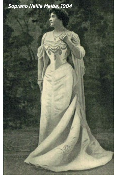
Soprano Nellie Melba, 1904