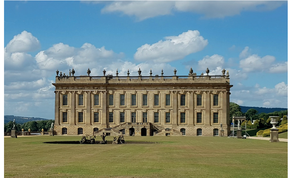
Chatsworth House, Derbyshire, (Fotoğraf Emre Aracı)

tamamladığı düşünülür ve dükün kılavuz kitabını 1844'te kaleme aldığı göz önünde tutulursa Bir Yaz Gecesi Rüyası Chatsworth için gerçekten de çağdaş bir yapıt idi o zamanlar. Dük'ün orkestrası, o devrin gazetelerine bakılırsa, zaman zaman repertuarını da kendisinin seçtiği, düzenli konserler de verirdi ve hatta bu konserlerin bazıları,