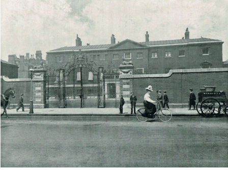
Günümüze sadece demir bahçe kapıları ulaşan Londra'daki Devonshire House

bugün ne yazık ki sadece armalı demir bahçe kapısı günümüze ulaşmış olan, Londra'nın Green Park'ına bakan Devonshire House'da gerçekleşirdi. O zaman evde kandillerin aydınlattığı görkemli salonlar açılır ve bütün Piccadilly, aristokratların sıra sıra dizilmiş at arabalarıyla dolardı. 1825 tarihli The Quarterly Musical Magazine and Review dergisinin VII. cildinde (s. 302) duyurulduğuna göre 13 Mayıs 1825'de Devonshire Dükü'nün ikinci konserinde, piyanoda adı "Master Litz" olarak verilmiş olan 14 yaşındaki Franz Liszt de sanatçı kadrosu arasında yer almış ve konser Rossini'nin Il Tancredi operası finaliyle son bulmuştu.