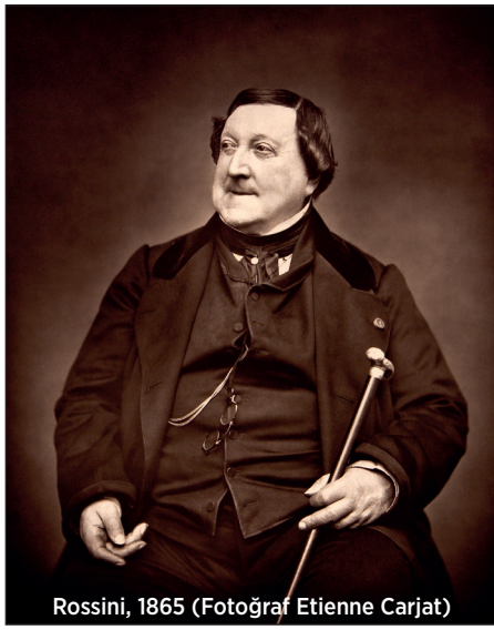
Rossini, 1865

takdimini sağlamak üzere referans mektupları da vermişti. 20 yıl sonra Rossini Bologna'nın pazar meydanında dolaşırken tekrar Devonshire Dükü ile karşılaşacaktı. Dük besteciyi hemen tanıdı. Yanına geldi ve bestecinin elini sıktı. Birkaç gün sonra ise, söz verdiği üzere, onu evinde ziyaret etmeyi ihmal etmedi. O ziyarette Rossini'ye kıymetli bir enfiye kutusu da hediye etti. Ancak Rossini enfiye kutusunun maddi kıymetinden ziyade Dük'ün kendisine göstermiş olduğu bu manevi nezaketten ötürü bir hayli etkilenmişti.