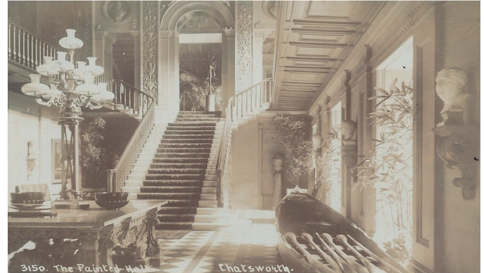
Chatsworth'te Sultan II. Mahmud'un hediyesi olduğu kayık, (Emre Aracı koleksiyonu)

inşaata tamamlanmış olan yapay şelâlenin tepesindeki o 18. yüzyıl tapınağı ise yıldızlar altında bir loca gibi uzaktan sessizce bu manzarayı izliyordu. Ama o tapınakta o gece hâlâ müzik odasından yankılanan, Mendelssohn'un Bir Yaz Gecesi Rüyası duyuluyor gibiydi âdeta. Zira böylesine bir manzara ve bu ortam sadece bir rüyadan