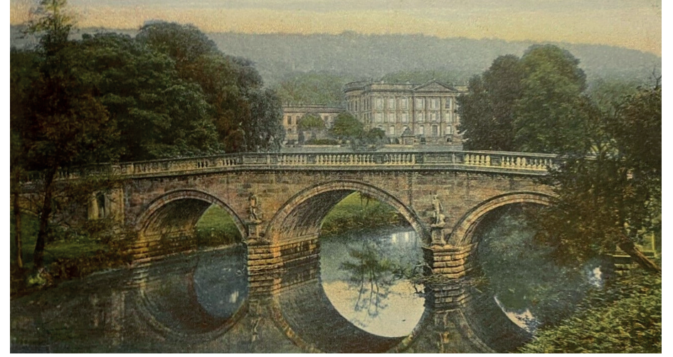
Eski bir kartpostalda Chatsworth House

odasını tasvir ederken geçmiş devirde burada pek çok defalar dans edildiğini yazıyor, ama artık kendi orkestrasının burada çok daha ciddi bir repertuar seslendirdiğini de ekliyor ve kız kardeşinden buradaki şömine çerçevesinin Mendelssohn'un Bir Yaz Gecesi Rüyası 'nı dinlediğini hayal etmesini istiyordu. Uvertürünü 1826'da bestelediği bu eserini Mendelssohn'un 1842'de bir süit olarak