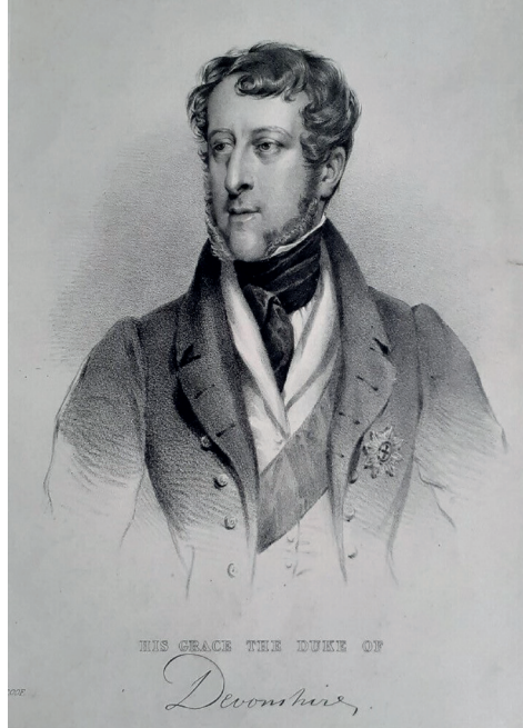
Devonshire Dükü William Cavendish