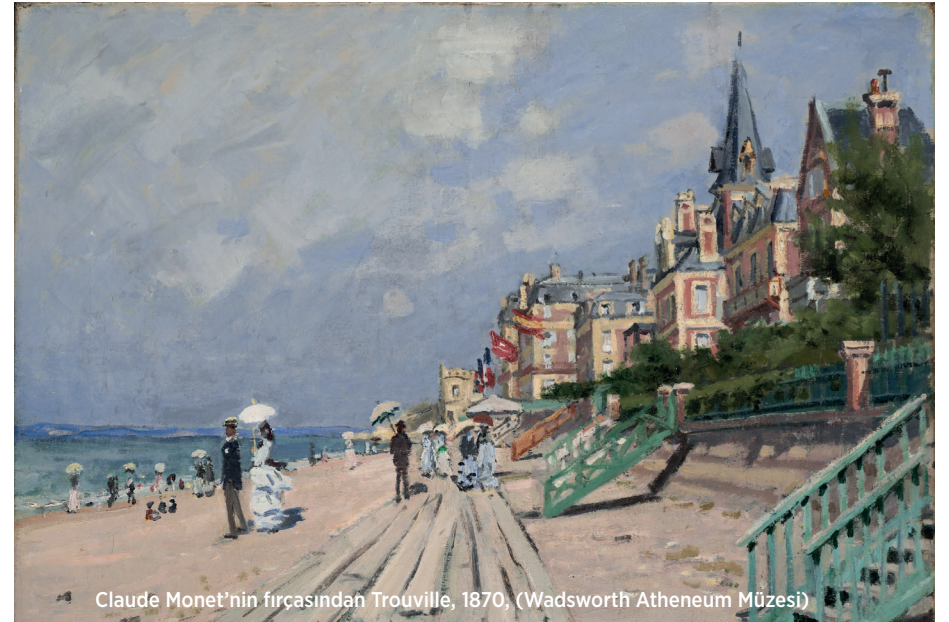
Claude Monet'in fırçasından Trouville, 1870, (Wadsworth Atheneum Müzesi)

"Dükü görmeye giden bir ahbabım, üzerimde bir İngiliz asilzadesinin salonuna yakışır türden bir kılığım olmamasına rağmen, bensiz gitmeye razı olmadı" diye sözlerine başlamıştı Rossini ve şöyle devam etti: "Ancak çok büyük bir müzik hayranı olan Dük, nezaketiyle beni büyüledi; birlikte yemek yedik ve yemek sonrası ona iki, üç şarkı söyledim". Hiller ise yemek üzerine şarkı söylemenin doğru olup olmadığını sorgulamakta gecikmemişti. "Evet, ama şunu itiraf etmeliyim ki böylesine güzel bir yemeğin ardından hiç bu kadar şevkle ve coşkuyla şarkı söylememiştim" diye cevapladı Rossini. Üstelik Dük hazretleri o buluşma sonrasında maestroya Londra'da yardımcı olması için nüfuzlu çevrelere