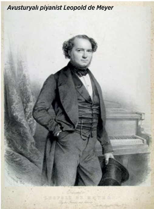
Avusturyalı piyanist Leopold de Meyer

H arvard Kütüphanesi'nden dijital ortama aktarılmış 1845'ten kalma eski bir kitabın sayfalarını internet teknolojisinin sınır tanımayan mucizesiyle kişisel bilgisayarımın ekranında binlerce kilometre öteden yavaş yavaş çeviriyorum. Esasında o kitabın sararmış yapraklarına dokunabilmeyi, kokusunu teneffüs edebilmeyi, satırları arasında dolaşırken kendi kendime "acaba kimler dokundu bu sayfalara" diyebilmeyi çok arzu ederdim; dahası bana Oxford ve Cambridge'i anımsatacak olan Harvard Üniversitesi'nin o tarihi merkez kütüphanesinde bu eski cildi loş lambaların ışığında incelemek ve öylesine bir ortamın içerisinde edineceğim bilgilerle bu tarih yolculuğuna başlamak isterdim. 1845'te Londra'da Palmer and Clayton Yayınevi tarafından basılan bu kitabın adı The Biography of Leopold de Meyer, Imperial and Royal Court Pianist, by diploma to their Majesties the Emperors of Austria and Russia . Böylesine görkemli bir takdimle, birazdan bu satırlarda aktaracağım gibi, Avusturya ve Rus İmparatorlarının resmi ve diplomalı piyanisti olan ve bütün bir dünyayı bir ucundan diğerine dolaşmış bulunan Leopold de Meyer'in hayat hikâyesi nasıl olmuş da unutulup gitmiş. Bir zamanlar bir fenomen haline gelmiş olan bu yıldız piyanisti bugün kaç kişi tanıyor? Daha doğrusu onu hiç tanıyan var mı? Doğumunun 200.