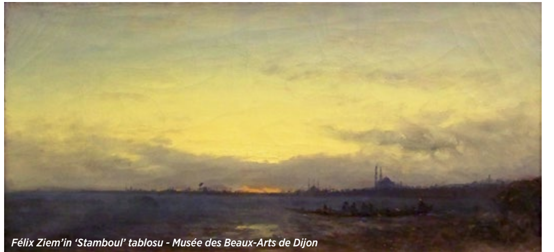
Félix Ziem'in 'Stamboul' tablosu - Musée des Beaux-Arts de Dijon