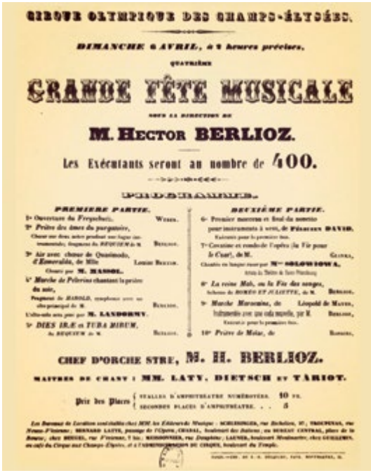
6 Nisan 1845 tarihinde Cirque Olympique’te verilen Berlioz konserinin afişi.

konserlerinin ertesi yılında gittiği Paris’te de Mahmudiye Leopold de Meyer’in repertuarında yer almaya devam etti. Hatta 8 Ocak 1845’te La France Musicale için verilen bir gecede Paris’te ilk defa seslendirdiği eser herkesi büyülediği gibi defalarca tekrarlandı; Berlioz Mahmudiye için “büyüleyici bir orijinalliği var” tanımını yaptı ve 400 kişilik dev bir orkestra için aranjmanını hazırladı ( Kern Holoman, Berlioz, Harvard University Press, 1989, s. 315-316 ). Eser bu haliyle ilk defa 6 Nisan 1845’te Berlioz’un Cirque Olympique konserinde seslendirildi. Böylelikle İstanbul’da yaratılmış bir Türk Savaş Marşı Paris’te dev bir konserde Berlioz’un orkestrasyonu ve idaresiyle Marche Marocaine olarak yeniden hayat bulmuş oldu. Berlioz aranjmanını Beethoven’ın Op 80 Koral Fantezisi ’nin de librettosunu kaleme almış olan Avusturyalı şair Christoph Kuffner’e (1780-1846) ithaf etti. Leopold de Meyer ise, Kuzey Teksas Üniversitesi Dijital Kütüphanesi’nde bir nüshasını tespit ettiğim Londra’da basılan orijinal piyano notasının kapağında da belirtildiği üzere, Marche Marocaine ’ini İngiliz Muhafız Alayı’nda yüzbaşı olan Charles Henry Cust’a (1813-1875) ithaf etmişti.