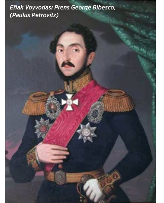
Eflak Voyvodası Prens George Bibesco

1843 yazında Leopold de Meyer, Eflak Voyvodası Prens George Bibesco ile birlikte İstanbul'a geldi. İngiltere Büyükelçisi Sir Stratford Canning'in himayesi altında 3 ay Birleşik Krallık Büyükelçiliği'nde misafir olarak ağırlandı. Büyükelçiliğin Beyoğlu'nda bulunan ve "Pera House" olarak bilinen anıtsal rezidans binası henüz o tarihlerde inşa edilmemişti. De Meyer'in İstanbul'a varmış olduğunun haberi 26 Temmuz 1843 tarihli Journal de Constantinople gazetesinin sütunlarında da yer aldı. Gazete de Meyer için "çağımızın en büyük piyanistlerinden" tanımlamasını yaparken, birkaç senedir İstanbul'un