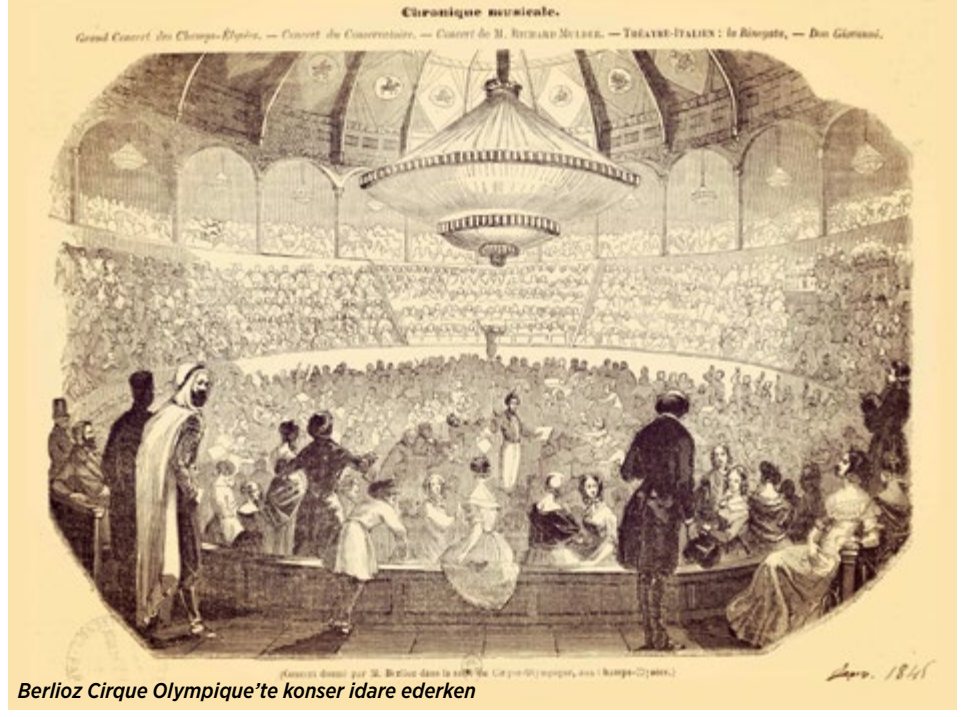
Berlioz Cirque Olympique'te konser idare ederken

tarihli köşe yazısında bu sonbahar havasını şehrin farklı din ve mezheplere mensup insanların dostluk içerisindeki bütünselliğine gönderme yaparak, şiirsel bir üslup içerisinde, dile getirmeyi tercih etmişti: “Kışın gelişi ve parlak geceler tiyatromuzun başlamak üzere olduğunu müjdeliyor. Ne mutlu eşsiz Pera tepesine! Stamboul her gece senin için aydınlanıyor, çünkü bu şehir sessiz semtlerindeki göz kamaştırıcı silüetini ortaya koyarken muhteşem manzarasını da en ince ayrıntılarına kadar sunmaktan haz alır. Lâkin Tophane'den kulaklarımıza davul, flüt ve zil sesleri geliyor, iyi Müslümanların huzurlu coşkusu bayram havasına davet ediyor, bu hareketli ve neşeli ortam tam da konserlere yaraşır. Şimdi tiyatromun bize sunacaklarından tat almanın tam zamanı, çünkü önemli ve ciddi oyun sezonu önümüzdeki ayın ilk günlerinde yeniden açılacak, kış mevsiminin yaklaşmasıyla daha korunaklı ülkelere göç etmek zorunda kalan sonbaharın hızlı kuşları gibi büyük zorlukla ve vaat patırtılarıyla yeni toparlanan kumpanya sezonluk oyuncularını sayesinde o mutlu heyecanları bize yaşatacak mı, ya da her zaman zevk alacak mıyız, Tanrı bilir”.