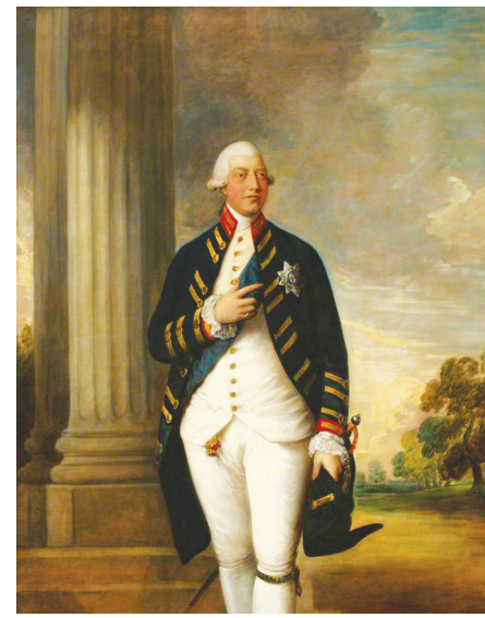
Kral III. George, (Gainsborough Dupont, RSM koleksiyonu, Londra)

Royal Society of Musicians" tarih seven bir müzisyen için Londra'daki belki de yegâne adres olmalı. 228 müzisyenin kurduğu dernek esasında düşkün müzisyenlere maddi destek sağlamak amacıyla hayırsever bir yardımlaşma cemiyeti olarak hayata geçmişti. Hatta derneğin 1738'de Drummond's Bankası'nda açılan hesabı dahi aynen durmakta. Bugün de hayırsever işlevini aynen sürdürmekte olan derneğin üyeleri arasında Handel'in yanı sıra Henry Purcell'in