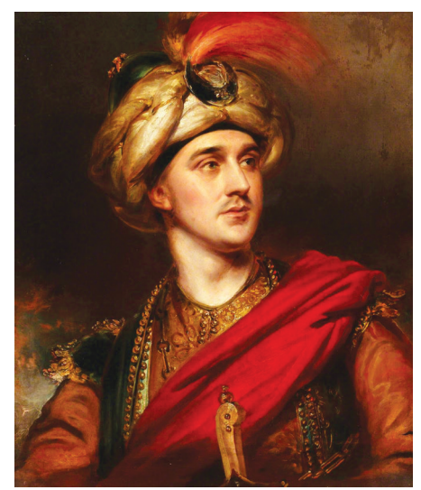
Serasker rolünde Charles Edward Horn, (Isaac Pocock, RSM koleksiyonu, Londra)

1762'de Londra'nın Marylebone semtinde dünyaya gelen Stephen Storace'ın annesi İngiliz, babası İtalyan asıllı bir kontrabasçıydı. Kız kardeşi Anna Selina (Nancy) Storace (1765-1817) ise devrinin ünlü bir sopranosuydu. Hatta Mozart, Figaro'nun Düğünü 'ndeki Susanna rolünü