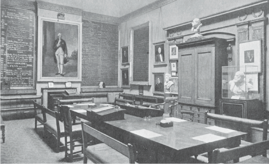
Kraliyet Müzisyenler Derneği'nin Lisle Street binasında toplantı salonu

derneğin 147. geleneksel yemek davetinde iki şarkısına piyanoda eşlik eder.