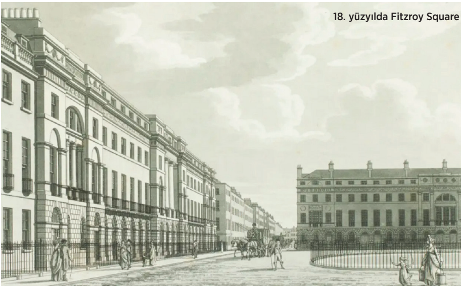
18. yüzyılda Fitzroy Square

adresinde benzer boyutta görkemli bir binaya yerleşecekti. Ancak buradan da 2018'de taşınan Kraliyet Müzisyenler Derneği bugün 26 Fitzroy Square'de bulunan, 18. yüzyıldan kalma, krem rengi iyon sütunlu cephesiyle, kuruluş tarihçesine yakışır bir başka tarihi binaya yerleşti. Üç kapı ötesinde ise bir zamanlar George Bernard Shaw ve ardından Virginia Woolf'un da yaşadığı bu meydan ve semt Bloomsbury edebiyatının da merkezi sayılır aynı zamanda. Ama 26 Fitzroy Square'in koyu kırmızı boyalı duvarlarında altın varak çerçeve içerisindeki portrelerinden