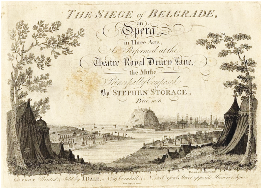
The Siege of Belgrade operasının 1791'de Londra yayımlanan notası

Nancy ve Stephen Storace 1787'de Viyana'dan Londra'ya döndüler. Stephen daha Viyana'da bulunduğu yıllarda iki opera bestelemiştir ve İngiltere'ye dönüşünde de opera besteciliği kariyerine devam etti. Bu esnada kız kardeşi de ağabeyinin operalarında başrolleri çıkıyordu. Nitekim 1 Ocak 1791'de Londra'nın Drury Lane'deki Kraliyet Tiyatrosu, Theatre Royal'da Belgrad Kuşatması 'nın prömiyeri gerçekleştirildiğinde Lilla başrolünde Signora Storace yer aldı. Serasker rolünde ise Haydn ve Mozart'ın Viyana'daki kuartet konserini dinlemiş olan tenor Michael Kelly sahnede idi. Arya, düet ve korolar arasında konuşma diyalogları da içeren, bir tür İngilizce 'Singspiel' olarak tasarlanmış olan eser aynı zamanda bir pastiş operası idi, çünkü Storace Belgrad Kuşatması 'nda yarattığı kendi özgün temaları dışında Mozart, Salieri, Giovanni Paisiello'nun eserlerinden ve bilhassa Martin