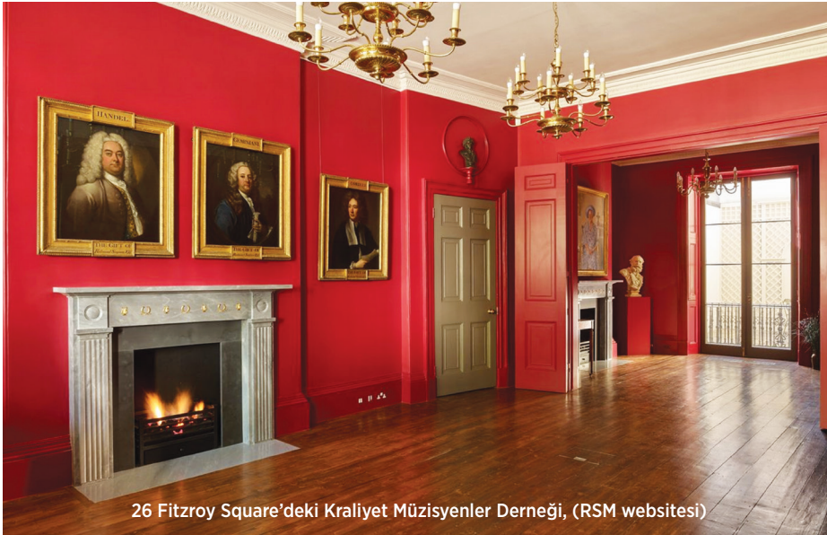
26 Fitzroy Square'deki Kraliyet Müzisyenler Derneği

gelen bir genç" derneğin her yıl düzenlenen geleneksel yemek davetinde piyano başında doğaçlama çalar. İngiltere'de daha önce hiç konser vermemiş olan ve kimselerin varlığından haberdar olmadığı "Master Liszt" adındaki bu genç piyanist, onu o gün dinleyenleri derinden etkilemiştir. Liszt 1827'de de dernek için bir konser verecek, gerisini zaten tarih yazacaktır. Ondaki iki yıl sonra, 1829'da 20 yaşındaki Mendelssohn bu defa derneğin geleneksel yemek ziyafetine katılanlar arasındadır. O davette İskoç Senfonisi 'nin bestecisi de piyanonun başına geçer, Mozart, Haydn ve Beethoven senfonilerinden seçme temaların kulaklara çalındığı bir doğaçlamayla davetlileri büyüler. Esasında Mendelssohn'un Haydn'a bu şekilde ve bu ortamda atıfta bulunmuş olması çok yerindedir; zira Londra'ya gelen Haydn'ın kendisi de bizzat derneği ziyaret etmiş ve hatta Kraliyet Müzisyenler Derneği için bir marş bestelemiştir. 39 yaşında 1826'da Londra'da vefat eden Carl Maria von Weber'in de dernek için kaleme aldığı bir marş bulunmaktadır. Berlioz da 1848'de derneğin o yılki davetinde onurlandırılmış ve üyelere Fransızca hitabında şükranlarını dile getirmiştir. 7 Mayıs 1885'te ise Dvorak