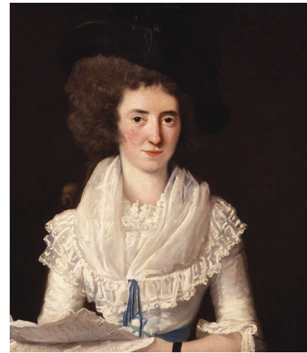
Nancy Storace

onun için yazmış ve operanın 1 Mayıs 1786'da Viyana'nın Burgtheater'indeki prömiyerinde Storace bu rolü canlandırırken Mozart da fortepiyanodan temsili idare etmişti. Macar şair Ferenc Kazinczy 1828'te yayımlanan anılarında "Güzel şancı Storace, göz, kulak ve ruhlarımızı büyüledi. Mozart fortepiyanosunu çalarak orkestrayı idare etti. Bu müziğin verdiği keyif, şehvetten o kadar uzaktır ki, ondan söz edilemez. Böyle bir sevinci tarif etmeye değer kelimeler nerede bulunabilir?" diye yazacaktı. Edinburgh'daki üniversite yıllarımda Music in the Romantic Era kitabını elimden düşüremediğim müzikolog Alfred Einstein'a göre ise Nancy'nin Mozart'ın yaratıcı dehası üzerindeki etkisi çok büyüktü; zira aralarındaki ilişki mesleki ve profesyonel çerçevenin çok ötesine geçerek romantik bir boyut dahi almıştı. Nancy ile birlikte Viyana'da bulunan ağabeyi Stephen da Mozart evinde sıklıkla görüldü; çünkü kendisi o yıllar Mozart'ın öğrencisi olmuştu. Storace kardeşler Viyana'da Haydn ile de yakın dostluk kurmuşlardı. Hatta Mozart ve Haydn Storacelerin evinde birlikte oda müziği konserleri dahi verirdi. Nitekim İrlandalı tenor Michael Kelly anılarında Storace kardeşlerin evinde böyle bir kuartet konseri dinlediğini yazarken birinci