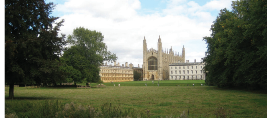
Forster'in yaşadığı King's College, Cambridge

dünyaları ve estetikleri Linley Sambourne'un evinde bu defa dışarıdan içeriye açılan bir pencerenin manzarasında bir araya gelmişti. Lucy o akşam Bertolini Pansiyonu'nun aksine Beethoven çalmamıştı; Schumann'ı tercih etmişti. Çünkü Forster'in romanında da açıkladığı gibi "tamamlanmamış olanın hüznüydü bu; çoğu zaman 'Hayat' olan ama asla 'Sanat' olmaması gereken hüznü". Zira Forster hayatta yarım kalan mutluluklarını ve içindeki hüznünü sanatında telafi ederek, sınırlarını çizdiği kendi evreninde, inandığı estetiğe göre inşa etmiş ve bizlere de sunmuştu. Bu yüzden de Floransa sokaklarında turist selinin aksi yönünde Forster'la kaybolmak veya Linley Sambourne'un evinde onu hiç beklenmedik bir anda yeniden keşfetmek önemliydi.