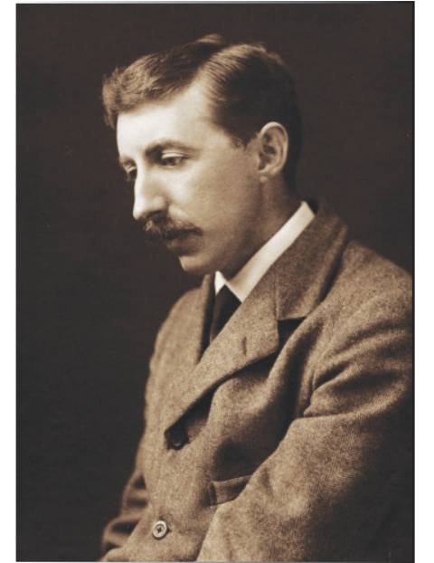
İngiliz yazar E. M. Forster

Daha önce Andante 'nin Kasım 2020 tarihli 169. sayısındaki Londra'da yağmurlu bir Beethoven konseri başlıklı yazımda da Forster'ın Howards End (1910) romanından hareketle onun Beethoven'ın eserlerine olan ilgisini ve yazım tekniğinde kendisine onu nasıl örnek aldığını detaylıca anlatmıştım. Ancak Howards End 'de 5. Senfoni'nin kader teması romanın kurgusunda kullanılırken