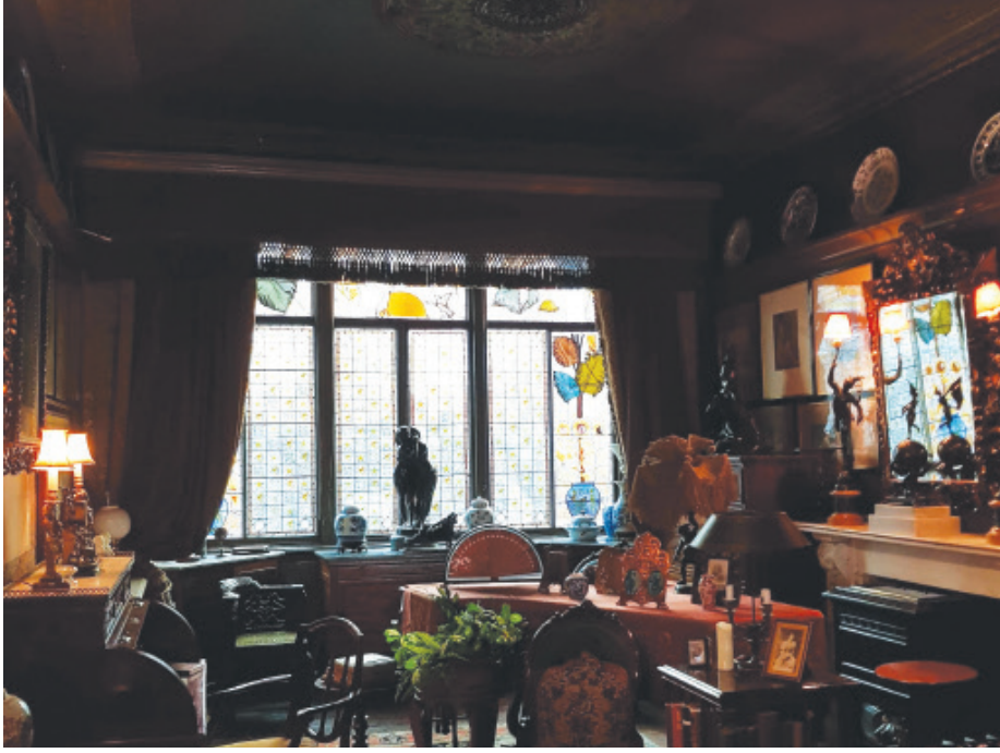
Linley Sambourne Evi'ndeki piyanolu salon, (Fotoğraf, Emre Aracı)