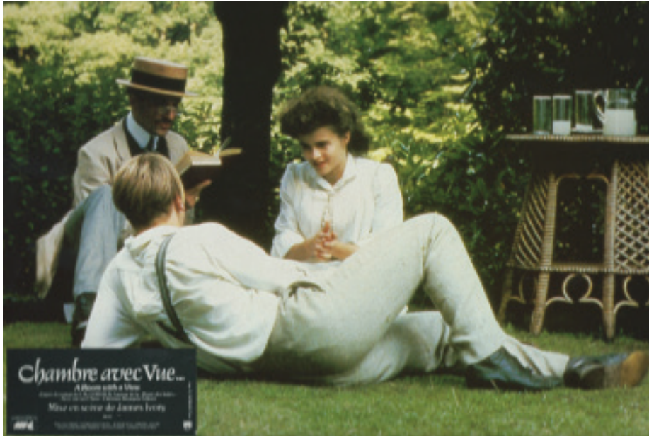
Görkemli çekimleriyle Manzaralı Bir Oda filminden İngiltere'de bir kare