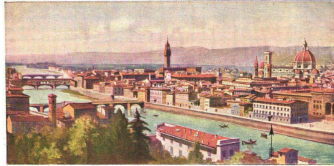
Forster'ın Floransa'da kaldığı pansiyonun kartpostalı

Forster romanında sadece Beethoven'ın estetiğinden değil 'Exposition' (Serim), 'Development' (Gelişme) ve 'Recapitulation'dan (Yeniden serim) oluşan 'Sonat Allegro' formundan da bir hayli etkilenmiş, hatta 'İtalya - İngiltere - İtalya' aksinde gidip gelen Manzaralı Bir Oda 'yı bu üç kısımlı formda inşa etmiştir. Gerçi Merchant Ivory filminde Beethoven'ın 32. Piyano Sonatı değil, onun çok daha iyi bilinen Opus 57, 23. Sonatı olan Appassionata Lucy'nin tuşesinden Bertolini Pansiyonu'nda duyulur, ama verilen mesaj elbette ki aynıdır. Nitekim Forster, "müzik" ve "menekşeler" ile bezeli romanın 3. bölümünde, "Müziğin egemen olduğu krallık bu dünyanın krallığı değildir; görgülü, entelektüel ve kültürlü