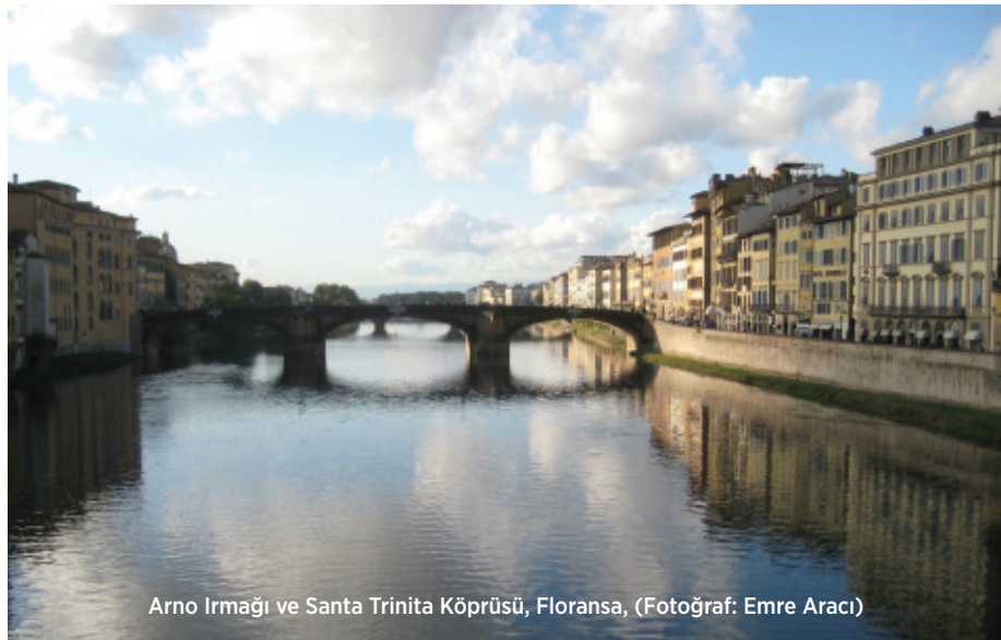
Arno Irmağı ve Santa Trinita Köprüsü, Floransa

İşte yine böylesine kaybolduğum günlerden birinde Londra'nın Kensington semtindeki 18 Stafford Terrace adresinde Viktorya devrinden kalma Linley Sambourne Evi'nin basamaklarını çıkıyordum. 1910'dan beri donmuş bir fotoğraf karesi gibi aynen korunmuş olan tablolar ve antikalarla dolu bu evin birinci katındaki piyanolu büyük salona adım attığım an ise donup kalmıştım, çünkü Manzaralı Bir Oda 'nın Londra sahnelerinden biri, mum ışıklarının aydınlattığı o zarif tuvaletli hanım ve beyaz papyonlu, fraklı beylerin piyano başına toplandıkları, Lucy'nin yine konser verdiği o an bu odada çekilmişti. Forster'ın, Merchant Ivory'nin